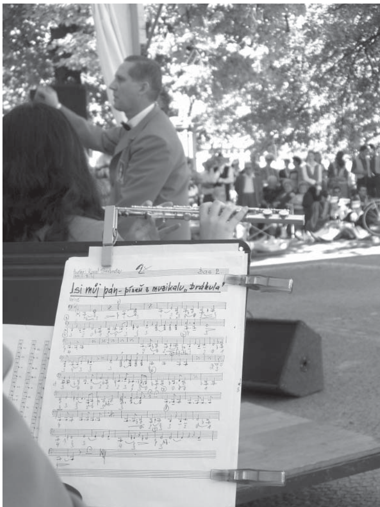
Fotografie Lucie Šedová - Čermákovo Vysoké Mýto 2004.