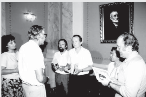
Expedice Po stopách bratří Škorpilů v Bulharsku 1984.

Pozn.: Výhledově bude na portál Vysokého Mýta ( www.vysoke-myto.cz ) umístěn celý text deníku Expedice po stopách bratří Škorpilů.