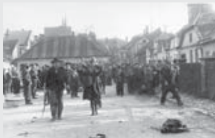
Němečtí civilisté zajatí na dnešním Tyršově náměstí vedeni k svému dočasnému uvěznění do Sokolovny. 9. 5. 1945

9. květen. Hloučky obyvatel se objevily na náměstí. Opět zaválaly československé vlajky. Náměstím projelo první vozidlo s rudoarmějci. Za chvíli se objevilo další vozidlo, ale s německými vojáky. Obyvatelstvo je hlučně zdravilo v domnění, že jsou to také Rusové. Poté se znovu objevili ruští vojáci. Ze zvonice zazněla střelba. Ruské dělo vystřelilo a nastal klid. Na náměstí jsem viděl rudoarmějce, jak chytil vojáka v německé uniformě – byl to také Rus - příslušník Vlasovovy armády - a na místě ho zastřelil. Dal mu čepici před obličej... zazněl výstřel... lidský