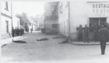
Civilní poprava zajatých německých vojáků, kteří se vzdali před Pražskou branou, na rohu dnešní Vrchlického ulice. 9. 5. 1945

Život neměl cenu. Na náměstí se objevila skupina ve stejnokrojích Todtovy organizace (v Říši pracující, tzv. totálně nasazení cizinci, včetně Čechů). Obyvatelstvu to nevažilo, stačilo, že vidělo cizí uniformu, a začalo je lynčovat. Nyní bylo možné vyřadit se na nevinných. U Pražské brány se vzdala skupina německých vojáků. Jeden z místních obyvatel - počestný živnostník, který po celou dobu protektorátu řádně pracoval, provedl popravu zajatců. Nejdříve jim střílel do přirození a pak je dorazil. Dalším otřesným zážitkem bylo zacházení rudoarmějců s válečnými zajatci (většinou Rusy), které Němci drželi v měšťanské škole v Jungmannových sadech. Ruská tajná služba nechala většinu z nich odvézt za město a tam je popravili. (Ruský voják nesměl upadnout do zajetí...) Občané oslavovali. Děvčata a ženy byly v národních krojích...