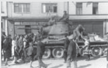
Tank Rudé armády vítán obyvatelstvem na náměstí před budovou cukrářství (dnes Hejhalova cukrárna).