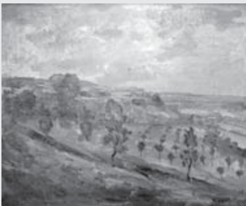
Bohumil Knyttl: Střemošická stráž , 1937 olej, plátno, soukromá sbírka, Ostrava

Působil v kraji pod Poklonou od roku 1936 do roku 1947. Na svých plátnech z tohoto období nesčetněkrát ztvárnil pohled z Poklony (viz 2. strana obálky), Střemošickou stráž, Košumberk, okolí Luže a Novohradky, ale i okolí Vysokého Mýta a Brtče. Ve Vysokém Mýtě měl za svého života celkem 4 výstavy. Tato, pátá vysokomýtská výstava je jeho první posmrtnou a současně první po 58 letech... V roce 1948 se Knyttl programově odmlčel a nevystavoval až do své smrti.