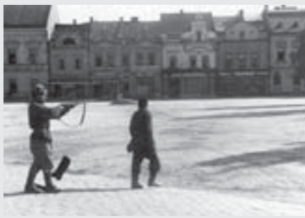
Rudoarmějec vede k popravě zajatého ruského vlasovce. Vzadu jihovýchodní část náměstí ve své levé polovině.