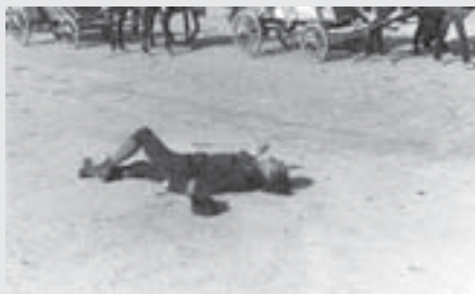
Ubíjí člověk na vysokomýtském náměstí: v německé pracovní uniformě, ale se zřetelnou páskou s nápisem TODT, v té době všeobecně srozumitelnou identifikací totálně nasazeného cizince.