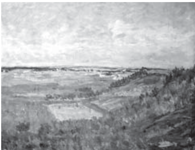
Bohumil Knyttl: Pohled od Poklony , olej, plátno 1936. Vlevo Paletínská kaple, uprostřed hrad Košumberk a Luže s poutním mariánským kostelem na Chlumku. Vpravo Střemošická stráň.