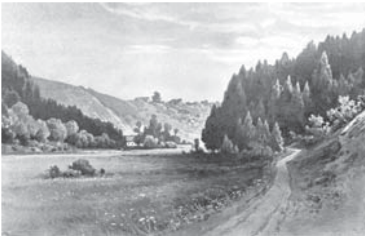
Karel Liebscher: Údolí pod Domoradicemi , asi 1904, lavírovaná kresba