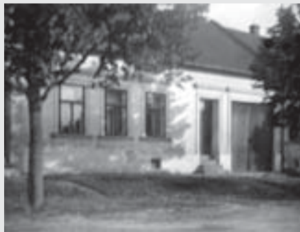
Dům ve Vysokém Mýtě, Českých bratří 195