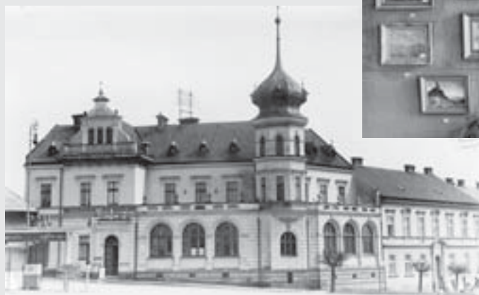
Budova bývalého vojenského kasina v době konání druhé Juškovy výstavy v roce 1941.