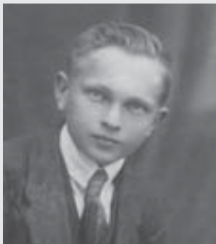
1921, student Učitelského ústavu v Litomyšli