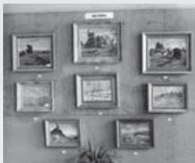
Instalace Juškových obrazů na výstavě v roce 1941.