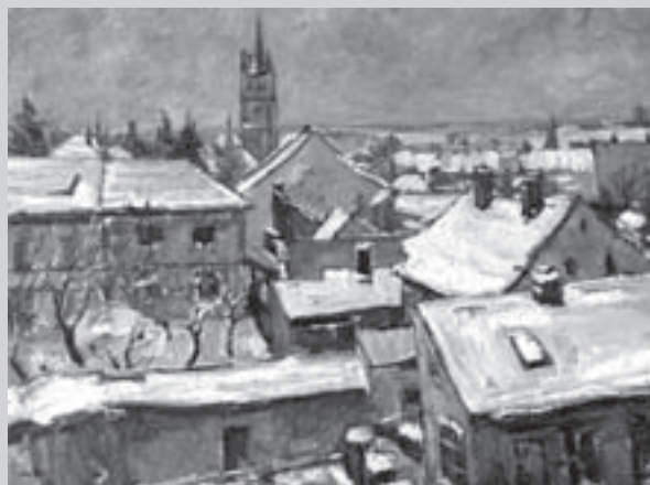
Jan Juška: Vysoké Mýto v zimě, olej, plátno, 1959. Městská galerie Vysoké Mýto