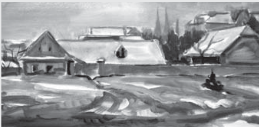
Z naší ulice v zimě (ulice Českých bratří ve Vysokém Mýtě), 1968, tempera, papír, 32 x 66 cm.