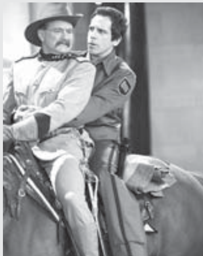
Noc v muzeu