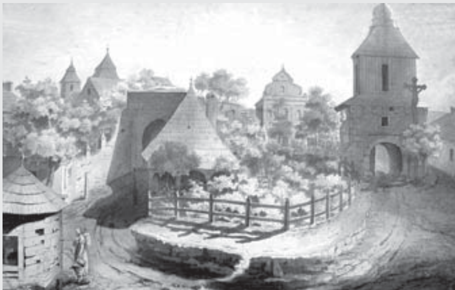
Partie z Litomyšlského předměstí ve Vysokém Mýtě , 1823, lavírovaná kresba perem, 32 x 48 cm, RMVM.

Požár roku 1816 dokončil zkázu, kterou způsobily obří požáry z let 1700 a 1774, během kterých vedle dřevěných staveb vzalo za své téměř celé středověké opevnění včetně věží a bran, které se ocitly v ruinách, které nikdo neopravoval a byly, jak se říkalo, ostudou města. Radní je chtěli zbourat. Stalo se zejména zásluhou bratří Šemberových, že byly na sklonku 19. století rekonstruovány, některé pak, jako Litomyšlská brána, téměř celé zgruntu znovupostaveny.