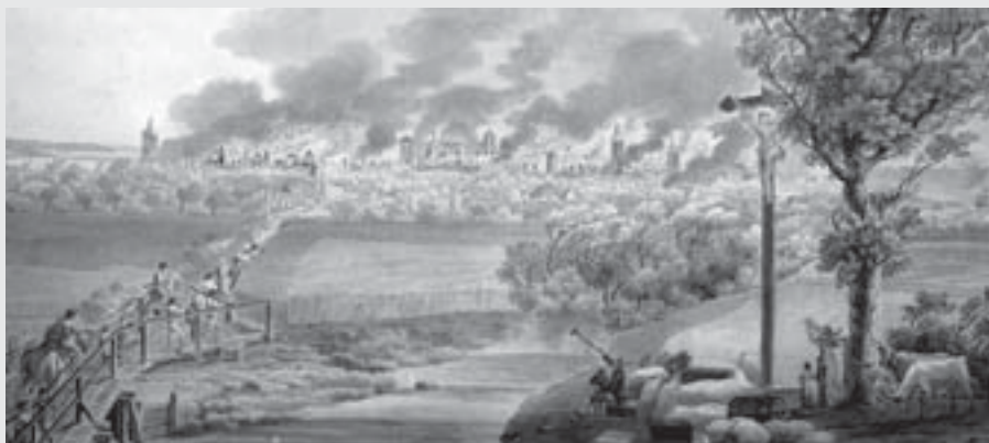
Požár Vysokého Mýta roku 1816 , kolorovaná kresba perem, 35 x 54 cm, RMVM.

Požár roku 1816 dokončil zkázu, kterou způsobily obří požáry z let 1700 a 1774, během kterých vedle dřevěných staveb vzalo za své téměř celé středověké opevnění včetně věží a bran, které se ocitly v ruinách, které nikdo neopravoval a byly, jak se říkalo, ostudou města. Radní je chtěli zbourat. Stalo se zejména zásluhou bratří Šemberových, že byly na sklonku 19. století rekonstruovány, některé pak, jako Litomyšlská brána, téměř celé zgruntu znovupostaveny.