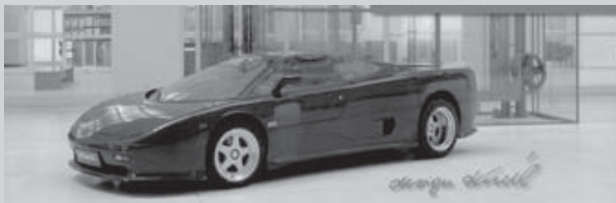
Supertatra MTX V8i, design Václav Král, 1991, jeden ze 4 vyrobených kusů; v pozadí další designérské dílo Václava Krále, výtah v prostorách Národní galerie ve Veletržním paláci v Praze.