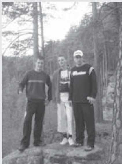
Setkání probíhalo ve Vranicích uprostřed skal a lesů.