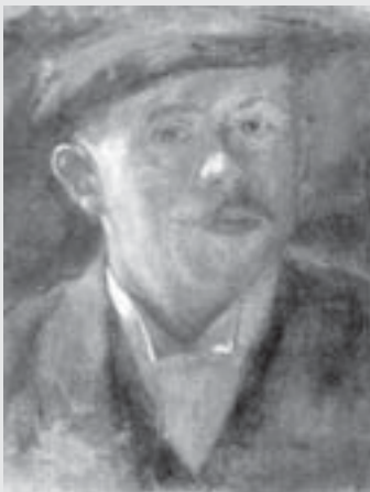
Autoportrét , 1916, olej, plátno, 36 x 36 cm, Městské muzeum a galerie, Polička.