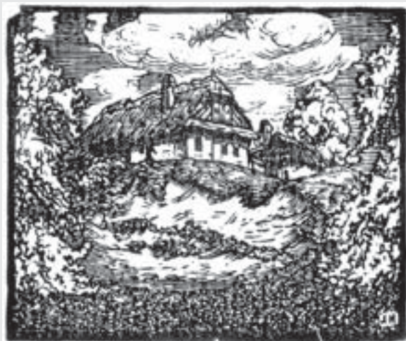
U Honsů v Běstovicích , 1922, dřevoryt, 63 x 76 mm, Městská galerie, Vysoké Mýto.