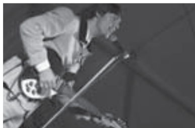
Koncert kladenských The Beatles Revival.

Ve dnech od 6. – 10. srpna probíhal na náměstí Přemysla Otakara II. 8. ročník hudebního festivalu Týden hudby . Na podiu se vystříдалo 10 skupin různých hudebních žánrů. Hlavními hvězdami byli pro letošek Jan Budař a Eliščin Band, The Beatles Revival z Kladna, houslista Jan Hrubý a další.