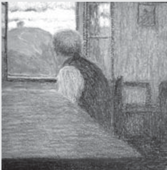
Otec (u okna v Běstovicích), kolem 1900, pastel, olejová tempera, papír, 50 x 50 cm, Galerie Kroupa, Litomyšl.