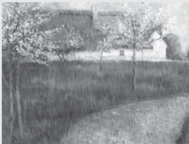
Honsův statek v Běstovicích , 1909, olej, plátno, 47 x 62 cm, Městská galerie, Vysoké Mýto.