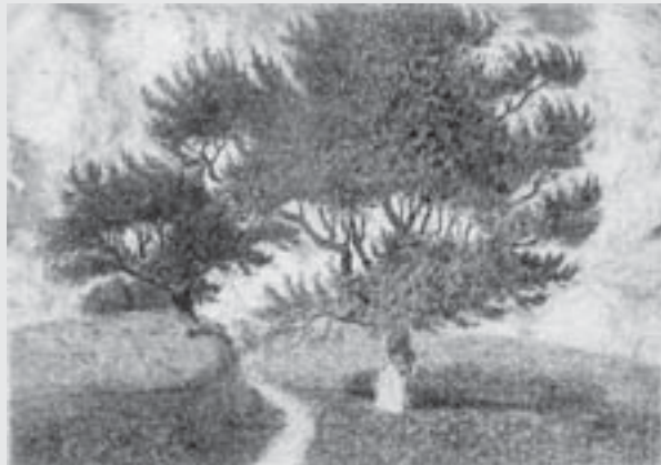
Stromy v poli , 1910, suchá jehla, Městská galerie, Vysoké Mýto.