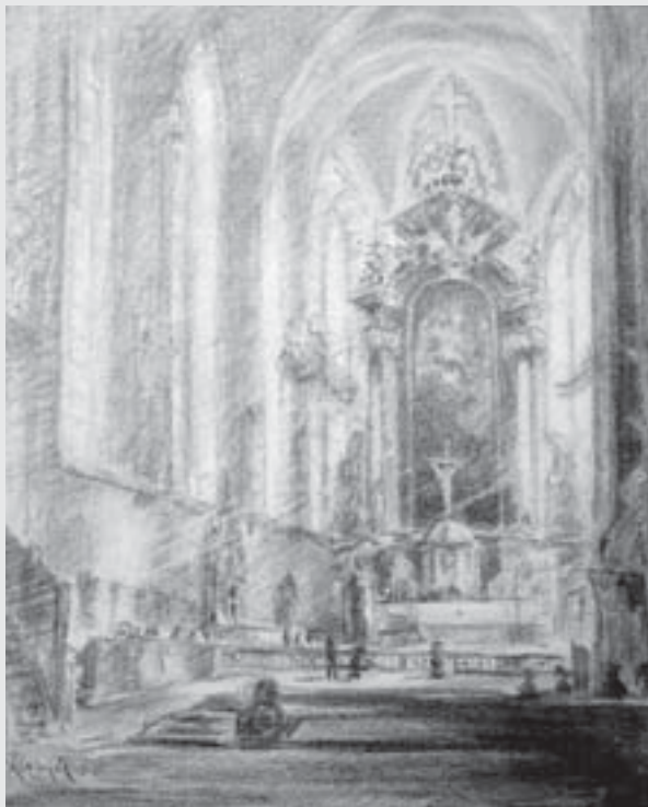
Interiér chrámu svatého Vavřince , 1942, kresba tužkou, papír, Městská galerie, Vysoké Mýto.