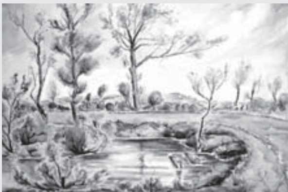
Pod Vinicemi , 1940, lavírovaná kresba, Galerie na Mýtě, Vysoké Mýto.