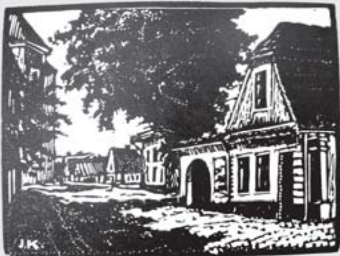
Na Kostelním náměstí (dnes penzion Tošovský), 1933, dřevoryt, papír, Městská galerie Vysoké Mýto.