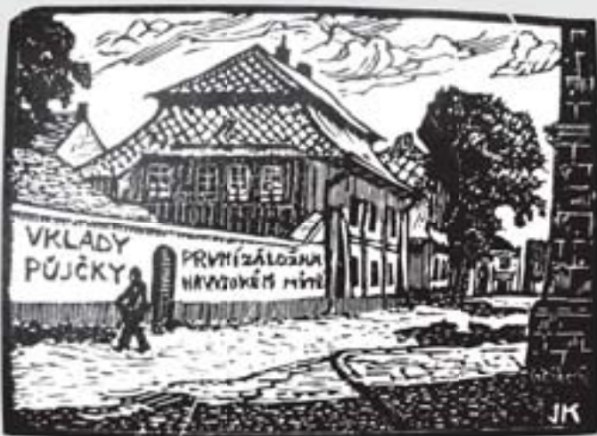
Na Kostelním náměstí II (pohled od gymnázia), 1933, dřevoryt, papír, Městská galerie Vysoké Mýto.