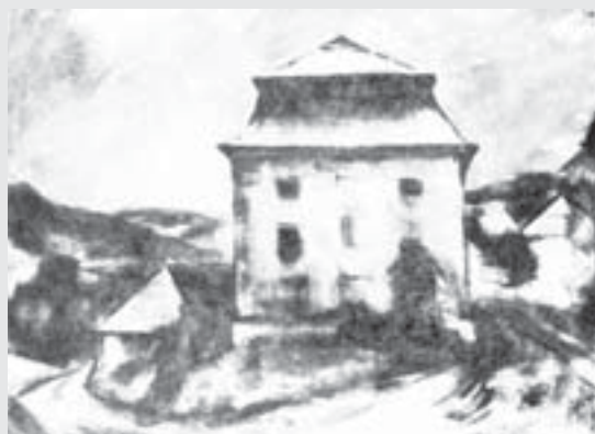
Špejchar v Nových Hradech, 1964, akvarel, papír, 40 x 60 cm.