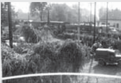
Převrácený polský obrněný transportér.

Již na počátku našeho projektu se nám tak podařilo získat nesmírně zajímavé informace i jiný dokumentační materiál. Za skutečně raritní a ojedinělý snímek považujeme ten, který nám zapůjčil Luděk Hejhal. Jeho otec na něm zachytil událost, která se stala v počátcích okupace a při níž na železničním přejezdu u staré zastávky (dnes restaurace U Brežněva) narazil polský obrněný transportér do právě projíždějícího vlaku. Při nehodě našťastí neutrpěl nikdo vážná zranění a hned po události začal po Vysokém Mýtě kolovat následující vtip: „Víte, kdo může za srážku na přejezdu? Strojvedoucí lokomotivy. Netroubil polský!“