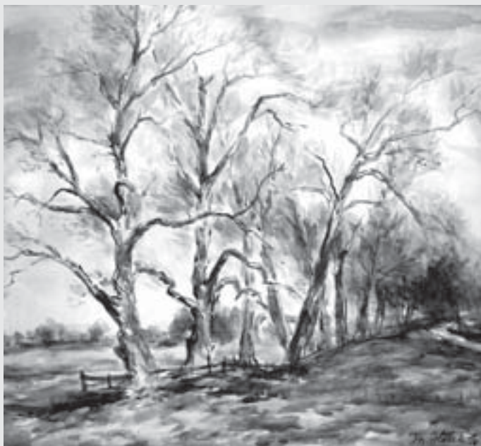
Ze zámeckého parku v Chroustovicích, 1956, akvarel, papír, 50 x 55 cm.

Výročí stého narození Josefa Haška věnujeme i dnešní Vitrinku. Jde o výběr jeho prací na papíře, které jsou v majetku Městské galerie ve Vysokém Mýtě.