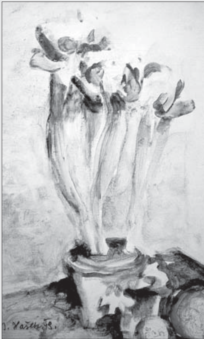
Zatíší , 1943, kvaš, papír, 38 x 24 cm.