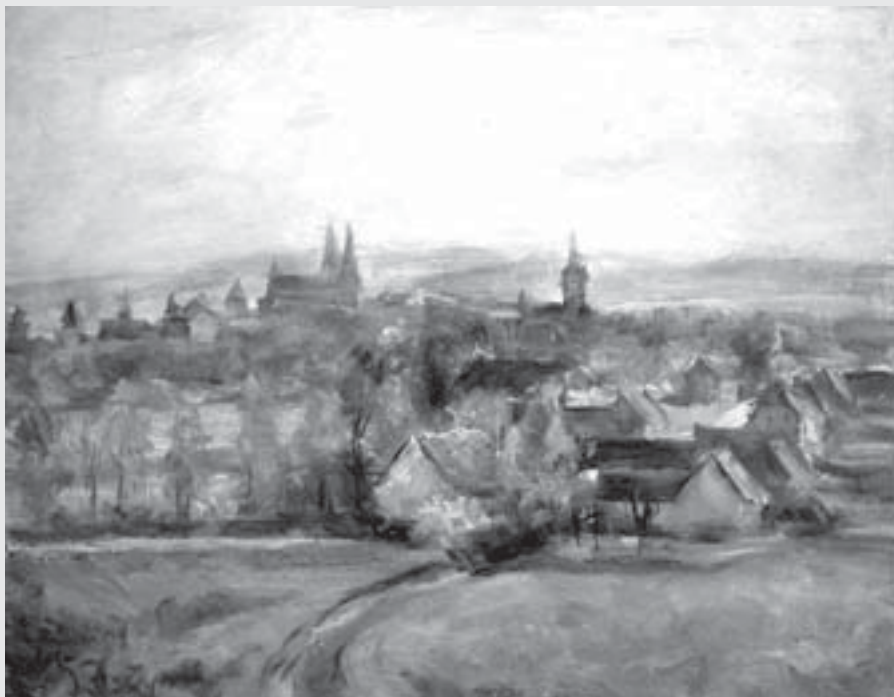
Václav Peřina: Panorama Vysokého Mýta , 70. léta, olej, lepenka, soukromá sbírka Vysoké Mýto.