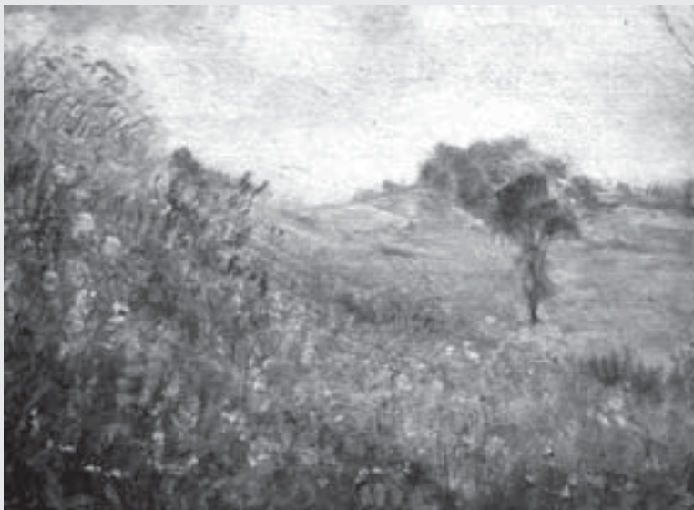
Ke Knířovu v létě , 60. léta, olej, lepenka, Městská galerie Vysoké Mýto.