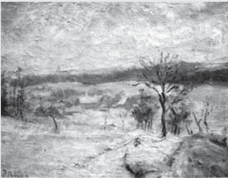
Ke Lhůtě v zimě , 60. léta, olej, lepenka, Městská galerie Vysoké Mýto.