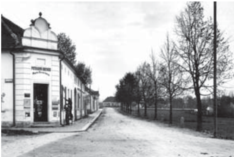
Křižovatka ulic Českých bratří a Jeronýmovy s obchodem Marie Benešové. polovina 30. let 20. stol.