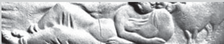
Domov, 1940-1941, mramorová reliéfní plastika pro dvoranu Zemské banky v Praze, 50 x 400 cm, nahoře levá část, dole část pravá.