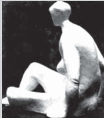
Sedící žena, volná plastika, 1931.