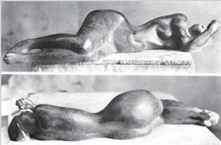
Ležící, 1934, bronz, d. 60 cm.

Na závěr kladu do Vitřinky úryvek z Kaplického textu. Je to text o umění, jakých napsal ve druhé polovině 30. let několik desítek; tento úryvek je koncentrovanou zkratkou toho hlavního, oč v nich šlo. Přestože nikoho nejmenuje, je jasné, že potrefenou husou jsou tu čeští formalističtí modernisté v čele s Filloou. Jinými slovy se tu říká: maluje-li v Čechách někdo jako Picasso, největší světový malíř, nedělá to z něj největšího českého malíře. Tyto rouhačské myšlenky stály v roce 1936 Kaplického členství ve Spolku výtvarných umělců. Něco takového se prostě neodpouští... A Fillova pozice jako nejdražšího domácího malíře současnosti je jen smutným svědectvím o tom, že po sedmdesáti letech se situace příliš nezměnila.