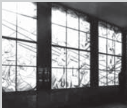
Josef Kaplický: Vitráž ve vestibulu Ředitelství státních drah v Hradci Králové, navrženého architektem J. Gočárem (1927–1932).