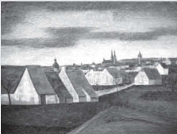
Vysoké Mýto mého mládí, vosková technika, 54 x 70 cm, Městská galerie Vysoké Mýto, v současné době vystaveno ve vestibulu Šemberova divadla ve Vysokém Mýtě.