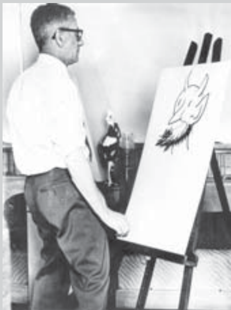
Jean Effel ve svém pařížském ateliéru v roce 1960