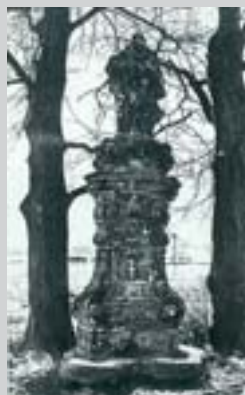
Sv. Josef kolem roku 1905 a na počátku 90. let.