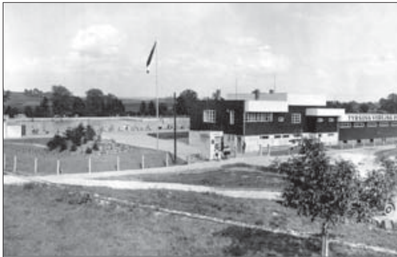
Tyršova veřejná plovárna, kolem roku 1933.