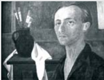
Autoportrét, 1958, olej, plátno, 55 x 70 cm, Městská galerie Vysoké Mýto