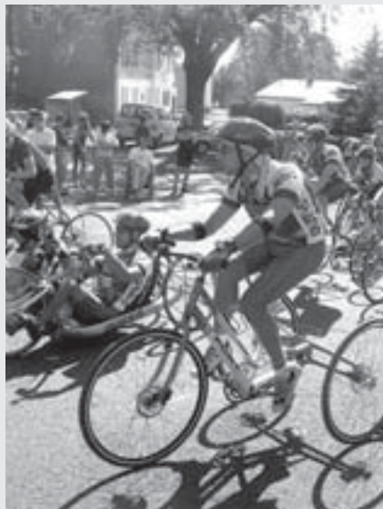
Ilustrační foto - archiv TJ Léčebna Košumberk.

Ve čtvrtek 8. 5. pořádá TJ Léčebna Košumberk z pověření České federace Spastic Handicap o. s. otevřené cyklistické závody ve Vysokém Mýtě. Akce je určena především pro hendikepované sportovce, ale je otevřena i zájemcům z řad zdravých cyklistů.