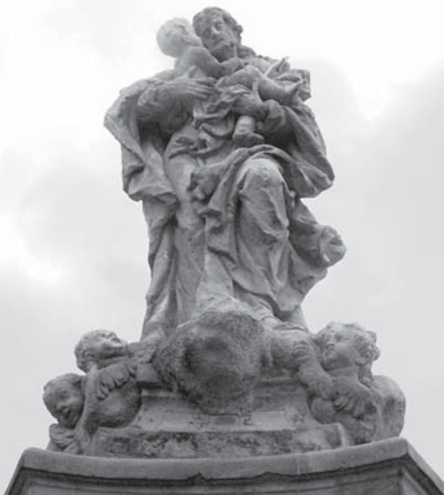
Svatý Josef, současný stav.