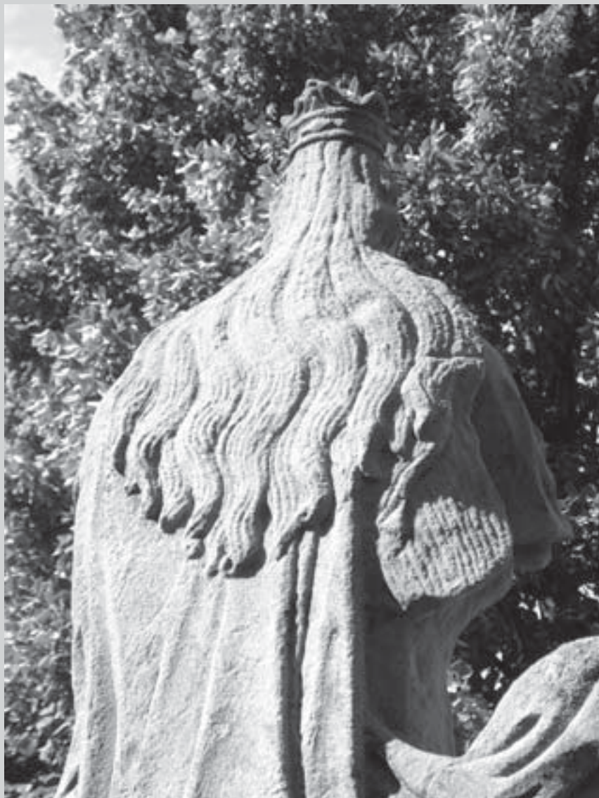
Knířovská madona, pohled od Zvonice.