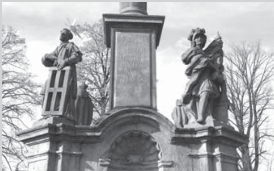
Sv. Vavřinec a Sv. Florian