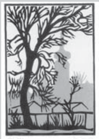
Panorama města s Choceňskou věží, barevný linoryt, 1986

16. 11. – 19. 12., denně kromě pondělí 9 – 12, 13 – 17 hod.