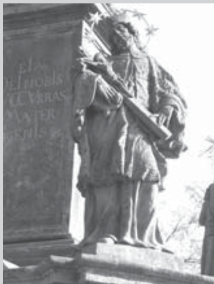
Sv. Jan Nepomucký