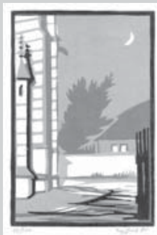
Na náměstí Otamara Vaňorného, barevný linoryt, 1985