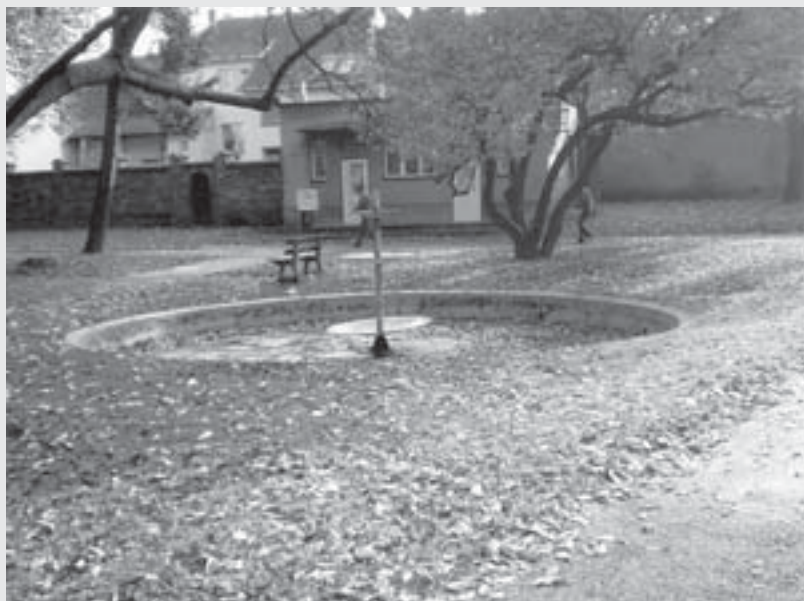
Stav fontány v Havlíčkových sadech těsně před jejím zrušením v listopadu 2008.