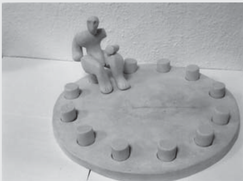
Klára Klose: Opuštěný měsíc, betonová plastika (model).