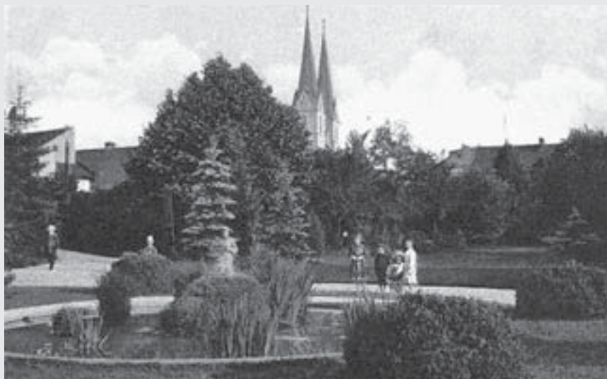
Pohled na jezírko asi o deset let později, kolem roku 1914.