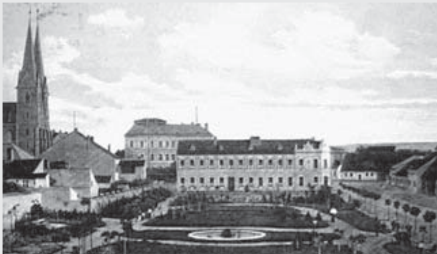
Opatrovna a asi čtyřleté Havlíčkovy sady v roce 1904.