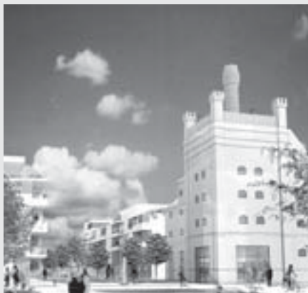
Stejné místo v budoucnosti, vizualizace podle arch. J. Panny