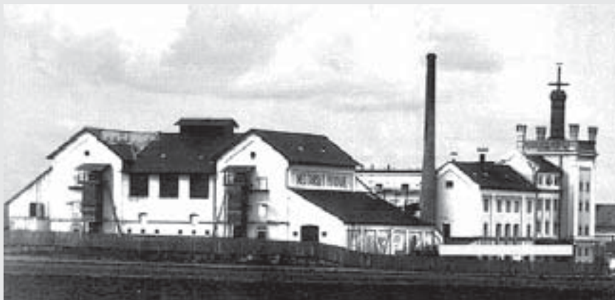
Pivovar v roce 1910