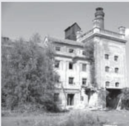
Současný stav, 2006