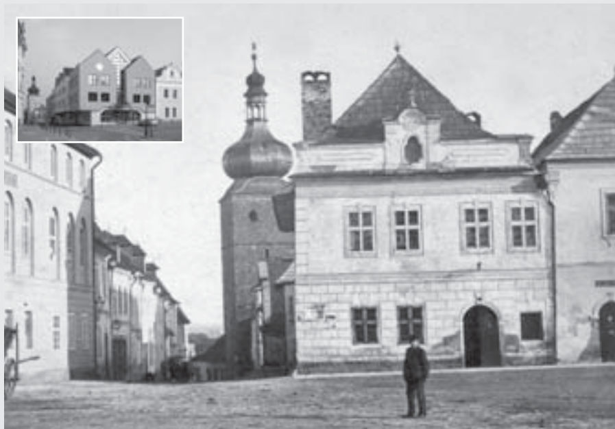
Nejstarší zachovalá fotografie domu čp. 89 z roku 1871 Současný stav s budovou České pojišťovny