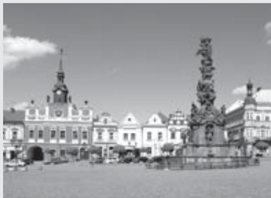
Stará radnice a morové sousoší

lohorského období bylo založení kapucinského kláštera na Novém městě. V 1. polovině 18. století se na chrudimském náměstí objevilo monumentální morové sousoší , kterým město reagovalo na morové epidemie, barokně byla přestavěna radnice, nově upraven byl i chrám Nanebevzetí Panny Marie , který je nejvýraznější dominantou Chrudimi. Nachází se na Resselově náměstí a je charakteristický dvěma vysokými věžemi. Z čelního pohledu na kostel se levá věž jmenuje Černá, pravá pak Trubačka.