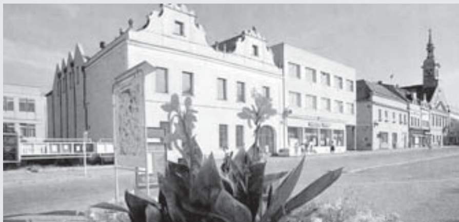
Proluka v roce 1992

Vitrinku připravili Zuzana Krchová a Pavel Chalupa