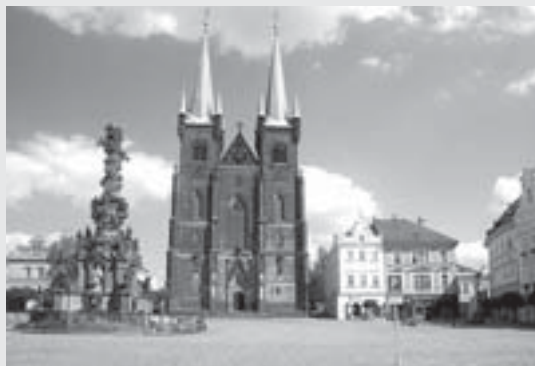
Chrám Nanebevzetí Panny Marie

Vývoj přerušila třicetiletá válka. Za své vzala třetina domů, zejména v centru, a trvalo sto let, než se město z pohromy vzpamatovalo. Patrně nejdůležitější změnou pobě-