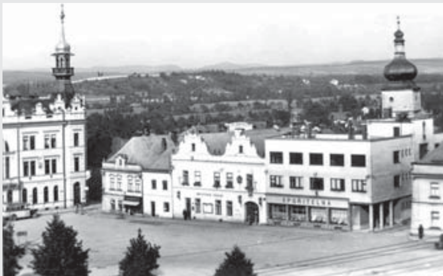
Pohled do severovýchodního rohu náměstí se Zápalovým řeznictvím z konce 30. let 20. stol.