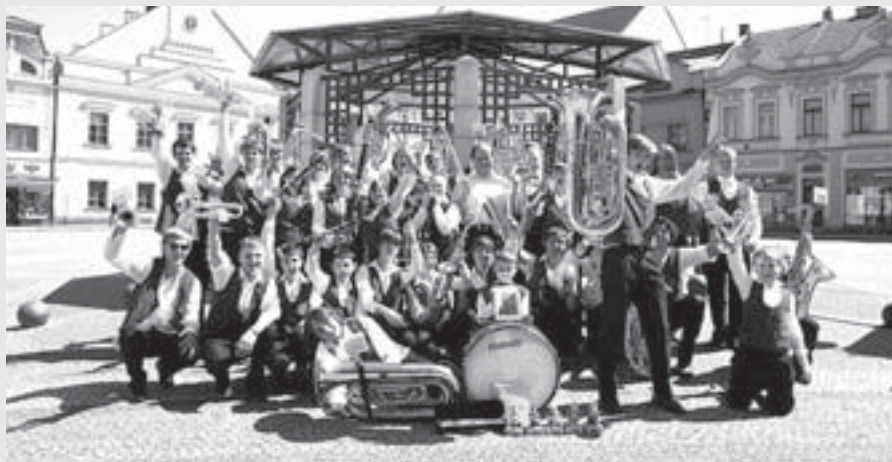
Vítěz XVII. ročníku: DO ZUŠ Bystřice nad Pernštejnem