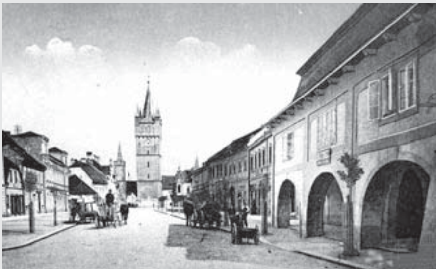
Pohled na Bílého beránka (vpravo) z opačné strany kolem roku 1911.