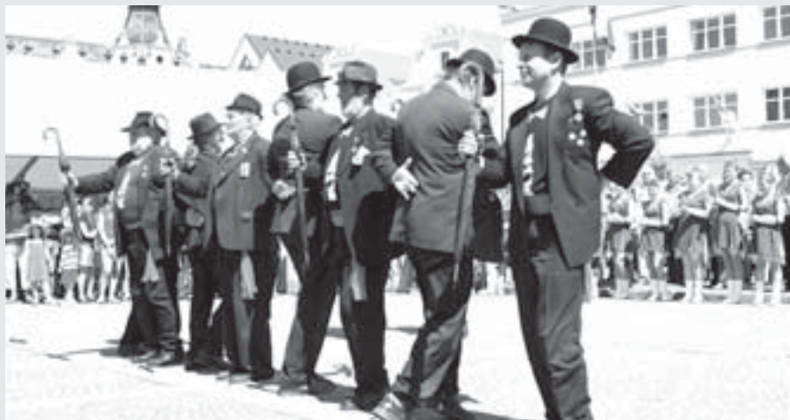
Vystoupení skupiny mužoretů ARTRÓZA z Hořic