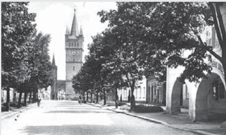
Stejný pohled z poloviny 50. let, krátce před zbouráním.