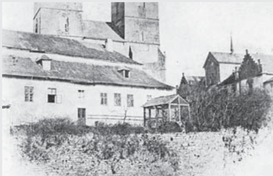
Zadní trakt budovy starého děkanství a děkanská zahrádka s altánem na bývalém parkáně. Foto Ferdinand Brožek kolem roku 1875, archiv MGVM.