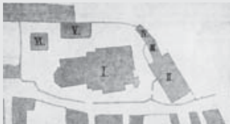
Plán Kostelního náměstí z roku 1824: I. chrám sv. Vavřince, II. staré děkanství, III. Kaplanka, IV. kostnice, V. škola, VI. zvonice.

V říjnové Vitřince zůstaneme v putování po zmizelých vysokomýtských památkách a zákoutích na náměstí Otmara Vaňorného, tedy na bývalém Kostelním náměstí, kde před hlavním vchodem do chrámu sv. Vavřince, na místě dnešního gymnázia, stávala ještě v 19. století budova starého děkanství .