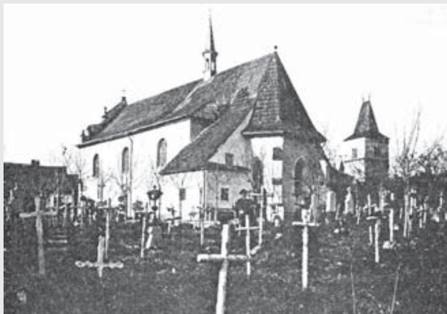
Starý hřbitov s kostelem Nejsvětější Trojice kolem roku 1900.