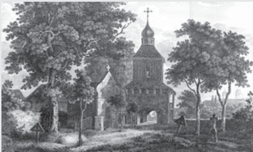
Josef Šembera: Zvonice na starém hřbitově, 1823.