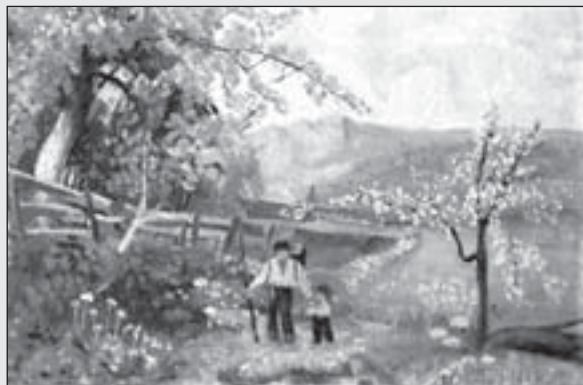
Jarní procházka u Terstu, olej, plátno, 1912