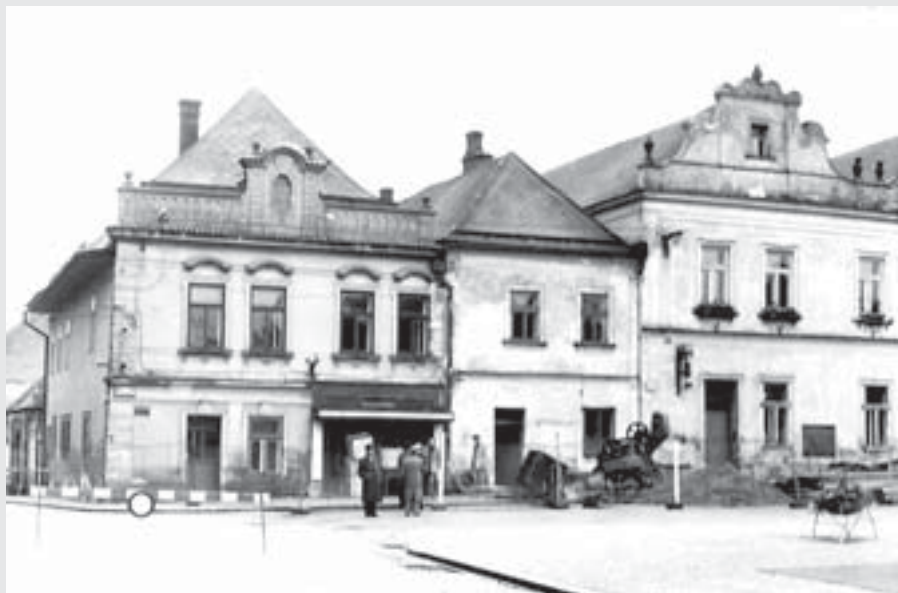
Pohled z náměstí na Zápalovo řeznictví a ústí Vladislavovy ulice v roce 1967.