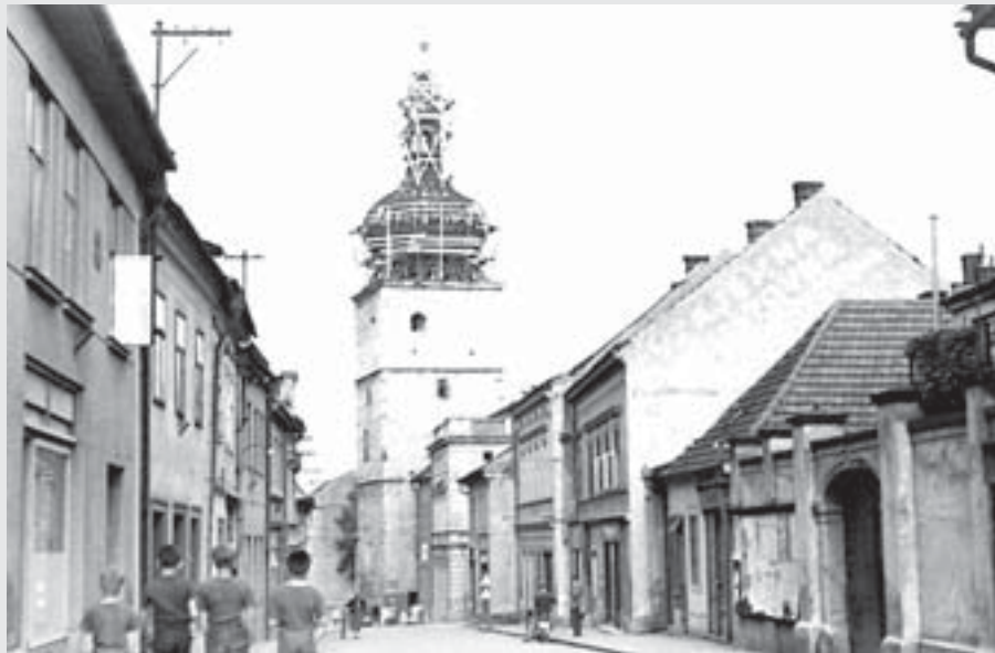
Pohled od Okresního domu do Vladislavovy ulice ve 40. letech (vpravo domy č. p. 42, 88, 33 a 87).

Prosincová Vitrinka nás v putování po zaniklých vysokomýtských domech a zákoutích zavede k poslednímu zastavení, do Vladislavovy ulice v místech, kde dnes stojí budovy České pošty a České pojišťovny.