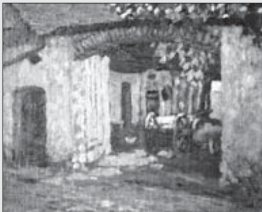
Pohled do venkovského dvora, olej, plátno, kolem roku 1918