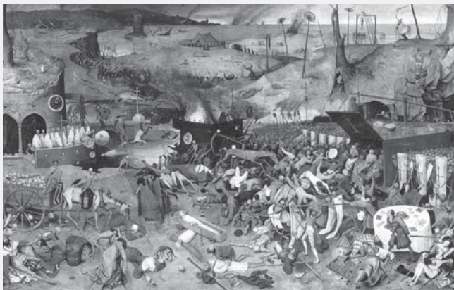
Triumf smrti, Pieter Brueghel starší

Zdeněk Horák, Regionální muzeum ve Vysokém Mýtě