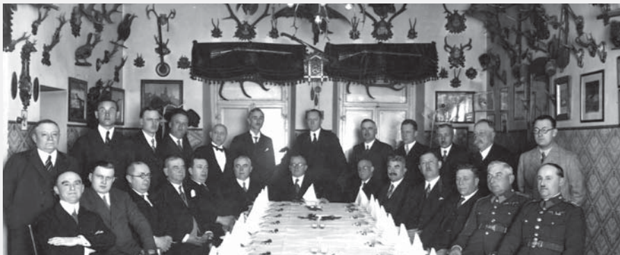
Mnoho let za první republiky se scházeli milovníci myslivosti v klubovně hotelu Kobylka u zeleného stolu k pravidelným schůzkám.