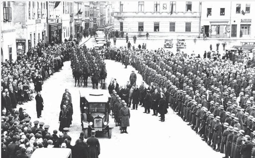
Smuteční průvod při převozu ostatků Aloise Jiráska ve Vysokém Mýtě 18. března 1930.

Čtyři měsíce po této události, 12. března 1930, Alois Jirásek v Praze zemřel. O 4 dny později se na pražských Olšanech konala jeho kremace, které se účastnil i vysokomýtský 30. pěší pluk. 18. března byla převážena urna s jeho popelem z Prahy do Litomyšle, a odtud přes Vysoké Mýto a Hradec Králové (v každém z měst spjatých se spisovatelem se uskutečnil krátký pietní akt) do Jiráskova rodného Hronova, kde byla následující den uložena do