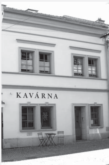
Kavárna v roce 2011.