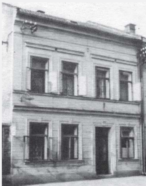
Č. p. 141 v roce 1937.

V prázdninové Vitrince přerušíme naše návštěvy vysokomýtských restaurací a zastavíme se pro změnu v kavárně. Výjimka potvrzující pravidlo vždycky může být jen jedna, ale to se právě hodí, protože opravdová kavárna je ve Vysokém Mýtě (ač to zní neuvěřitelně) skutečně jen jedna. Jde o kavárnu v Šafaříkově ulici 141 (naproti Smékalovu pekařství), kterou si tu roku 2010 otevřeli mladí kavárníci Marta Klementová a Filip Burš. Ne že by to byla první kavárna v Mýtě. Mnozí si ještě pamatují na kavárnu u Tejnorů (v místech dnešní lidovky), v hotelu Pošta (v prvním poschodí) nebo u Kobyeků, kde se už za dob první republiky pořádaly (na kavárnu paradoxně) tzv. čaje. Všechny však časem zanikly, a dlouhou dobu nebyla v Mýtě žádná. Sympatický počín mladého páru – jinak absolventů Střední průmyslové školy grafické v Praze – kteří podle svých slov pocítovali při pobytu v Mýtě silný abstinenci příznak nedostatku kavárenské kultury, je obzvlášť chvályhodný, neboť se rozhodli pověsit grafické řemeslo na hřebíček a na ten zavěsili také vývěsní štít s prostým názvem svého podniku: Kavárna.