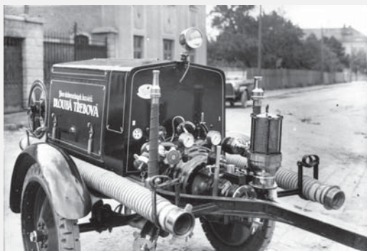
Foto: Jan Popelka, 1931 (archiv Regionálního muzeum ve Vysokém Mýtě)

K nejrozšířenějším výrobkům významné vysokomyštské továrny Stratílek patřily dvoukolové motorové stříkačky, tisíce kusů byl zhotoven již v roce 1930. Konstrukce se skládala z rámu dvoukolového podvozku, do kterého byl umístěn motor s čerpadlem a vývěvou. Stroj byl opatřen úchyty pro savice a další příslušenství potřebné pro využití stříkačky u zásahu. Stříkačky byly ještě doplňovány dopravním vozem pro mužstvo, kde se také nacházela další výzbroj – zejména hadice. Mezi nejvýkonnější dvoukolové motorové stříkačky Stratílek lze zařadit typ 605, jenž byl stavěn pro nejtěžší podmínky. Patentovaný šestiválcový