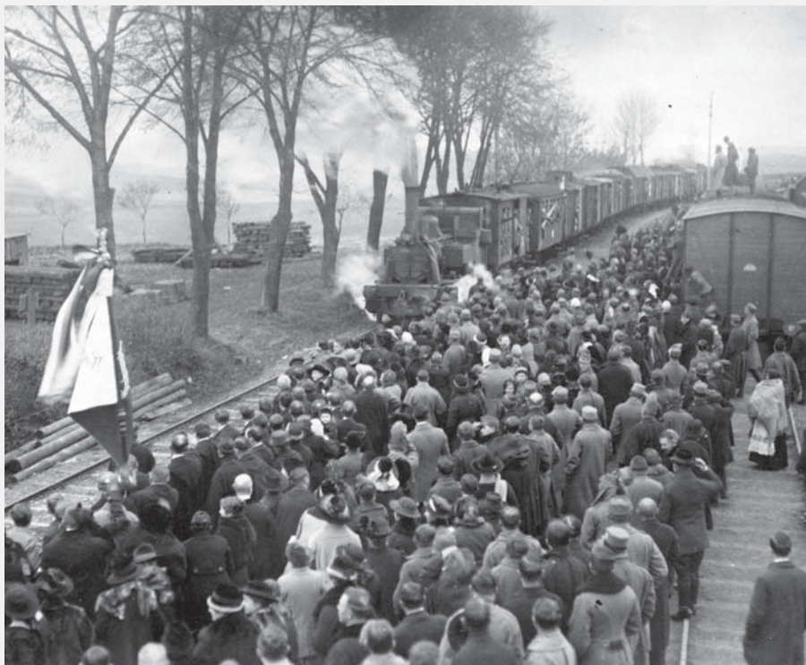
Příjezd vlaku s třícátníky na nádraží ve Vysokém Mýtě, listopad 1918.

Spisovatel, jehož jméno pluk od 28. dubna 1929 nesl, je na naší desce nazván mistrem. Dnes je vnímán spíš kontroverzně, vždyť historie, kterou předkládal, je často jen autorovou fantazií a mýtem. Ale lidé, kteří jeho knihy tenkrát četli, se ideálům těchto mýtů dokázali přiblížit. Jejich vlastenectví nebylo jen rvaním hololebých rváčů, byl to výraz s obsahem a hodnotou. Díky tomu se Československo nestalo pouhou několikaměsíční epizodou dějin, ale státem, který těžké situaci dokázal čelit s odvahou a nadějí až do poslední chvíle.