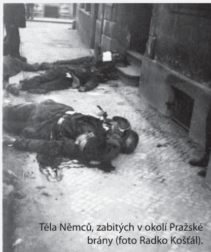
Těla Němců, zabitých v okolí Pražské brány.

Jičíně a Lomnici nad Popelkou. V severovýchodních Čechách se do podobných akcí zapojili členové sovětských výsadků a osvobození sovětsí vojáci, skrývající se v lesích. Avšak velká část těchto prvních ohnisek odporu byla do 4. května potlačena a docházelo k odvetám. Například v Třešti členové SS postříleli 34 náhodně vybraných rukojmí, ve Velkém Meziříčí policejní jednotky zabily 59 lidí. Zcela specifickým případem byla Praha, kde se spontánně vypuklé povstání podařilo dostat pod organizované velení a situaci po 5. květnu lze bez nadsázky označit za skutečný vojenský střet. Generál Schröner sem pro potlačení svolal tankové divize SS Wiking, Das Reich a útvar SS Kampfverband Wallenstein se značným počtem tanků a dělostřelectva. Objevily se barikády, proti kterým vojáci SS nezdědka posílali české civilní obyvatelstvo, například na Hlávkově či Trojském mostě, kde po rozebrání zátaras rukojmí postříleli. Snad k největším ukrutnostem došlo v Krči, kde němečtí vojáci ve sklepě domu povraždili 14 mužů, 13 žen včetně dvou těhotných a deset dětí mezi šesti a patnácti lety.