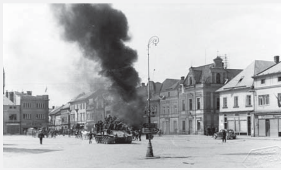
Sovětský tank na náměstí, dým stoupá z hořícího německého motocyklu.

Na Vysokomýtsku probíhaly odzbrojovací akce vcelku organizovaně. V lesích okolo Horního Jelení, Skutče a na Novohradsku už delší dobu působily ozbrojené partyzánské skupiny, složené z místních lidí, uprchlých válečných zajatců a členů sovětských výsadků. Výraznou pomoc bojující Praze představovaly zejména sabotážní akce na železniční trati mezi Zámrskem, Sruby a Dobříkovem, realizované často