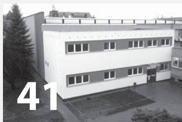
Slavnostní otevření sportovní haly