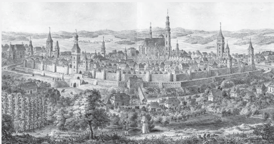
Josef Šembera: Vysoké Mýto v 17. století, 1843.