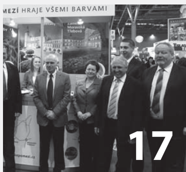
Českomoravské pomezí v Brně