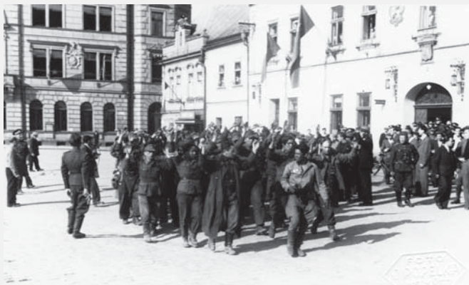
Zajatí němečtí vojáci na náměstí.