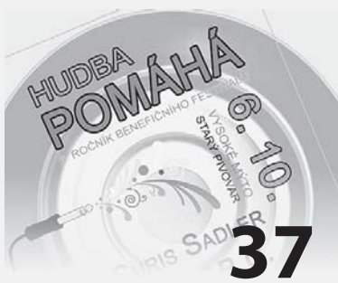
Projekt Hudba pomáhá