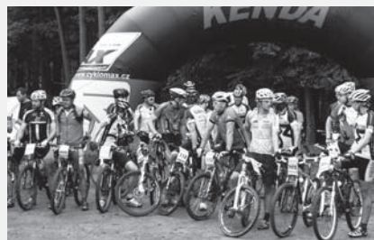
Foto ze závodu horských kol KUJEBIKE 2012. Výsledky na www.sk.donocykl.cz .