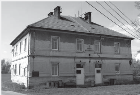
Unikátní „Domov mlynářských“ vybudovaný pro potřeby bydlení mlynářské chasy. Foto Radim Urbánek, 2011.

Opomenout nemůžeme ani mlýny s velkou mlecí kapacitou. Krom již uvedených mlýnů čp. 31 v Hrušové a čp. 78 ve Vysokém Mýtě jsou to zejména mlýny čp. 17 v Tržku a Valcha čp. 187 ve Vysokém Mýtě. Prvně jmenovaný má dva unikáty. Patří k nejstarším osmi českým akciovým mlýnům vybudovaným na začátku 70. let 19. století a následně se vyvinul do podoby areálu velkého mlýna s „domovem mlynářských“ (viz foto) a velkým mlynářským skladem u železniční trati vedle nynější zastávky Tržek.