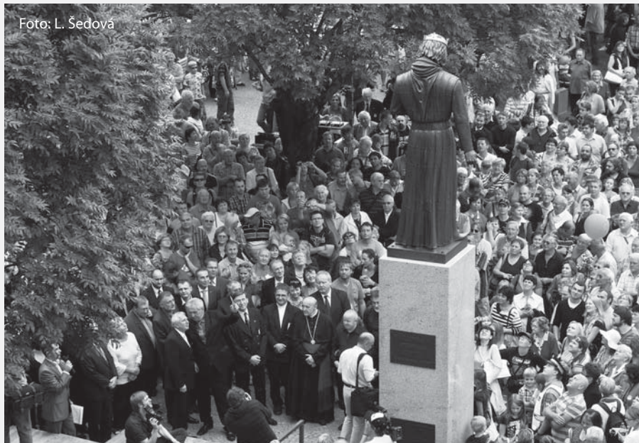
Odhalení sochy Přemysla Otakara II. přihlížely davy lidí.