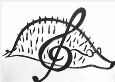
Pocta Jaroslavu Ježkovi