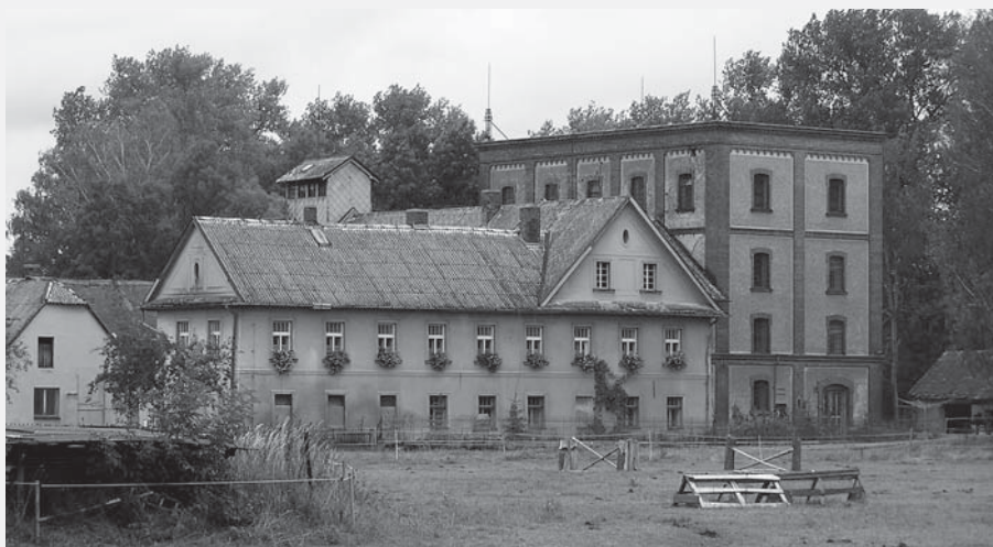
Areál Vozenílkova mlýna čp. 31 v Hrušové. Vpravo čtyřpodlažní mlýnice z doby krátce před I. světovou válkou s působivou fasádou z režného zdiva, díky níž budí dojem průmyslového objektu. Foto Radim Urbánek, 2003.

Jednoduché umělecké složení na mletí pšenice si můžeme přiblížit takto. V čistírenské části dochází pomocí hranolového vysévače (rotující šesti- až osmiboké síto), kookolníku (rotující dutý válec s vylišovanými důlky, které oddělí kulovatinu od podlouhlého zrna) a případně taráru (stroje na principu rozdělení různě těžkých frakcí proudem vzduchu) ke kvalitnímu vyčištění a vytřídění zrna včetně oddělení jedovatého kokuolu, či znehodnocujícího česneku, máku aj. Mlecí část tvořila nejméně jedna válcová stolice, v níž se mezi dvěma kovovými rýhovanými válci zrna rozemlelo a ve vysévací části na dalším hranolovém vysévači s různě hrubými sítý oddělovaly mouky, krupice a krupičky. A ještě se na strojích zvaných savka, štoska či reforma opět pomocí proudu vzduchu oddělí nejkvalitnější krupice a zbaví otrub (obalových částí zrna). Tato čistá bílá krupice se tzv. vyluští („semele“) na další válcové stolici s porcelánovými nebo hladkými kovovými válci, čímž se získá kvalitní bílá jemná mouka.