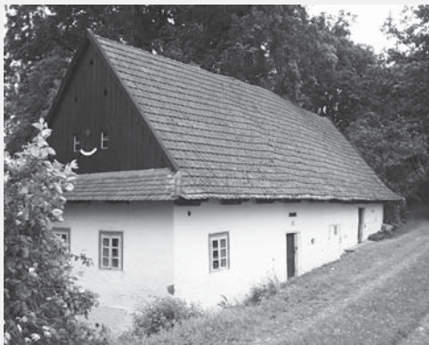
Mlýn Betlém čp. 35 v Zálší. Ve třetím dílu (zcela vzadu) s nevelkou mlýnicí, do níž se podařilo vměstnat jednoduché umělecké složení.

Na závěr zmiňme, že i na Vysokomýtsku stejně jako jinde v Čechách se projevila snaha o modernizaci v realizaci tzv. mlecího složení polouměleckého. Spočívalo v tom, že mlynáři k mlecím kamenům z obyčejného složení doplnili některý ze strojů složení uměleckého, což mohl být třeba i jen kapsový výtah anebo některý ze strojů k čištění obilí či vysévání meliva. Příkladem můžeme uvést mlýn Betlém čp. 35 v Zálší, který měl ve 2. polovině 19. století obyčejné složení doplněné „cylindrem na mletí žita“, tedy hranolovým vysévacem. A tato velmi prostá modernizace mlýna postačovala až do 20. let 20. století.