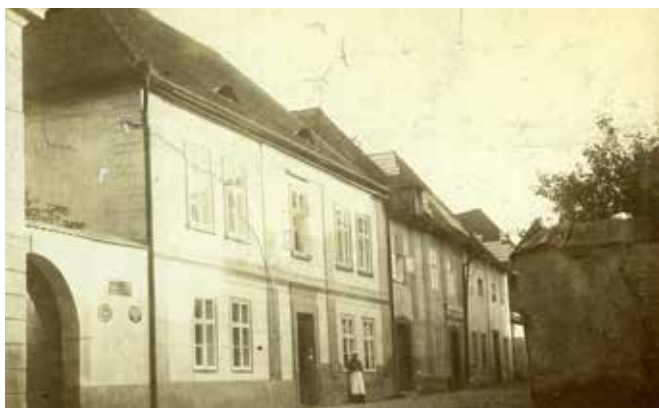
Pohled na rodný dům Aloise Vojtěcha Šembery v Damaškové ulici v roce 1866. U vrat je cedulka s názvem ulice a vpravo vybíhá ulice Masnokrámská ((dnes B. Smetany). Foto neznámý autor

Vojtěch Barcal, Regionální muzeum ve Vysokém Mýtě