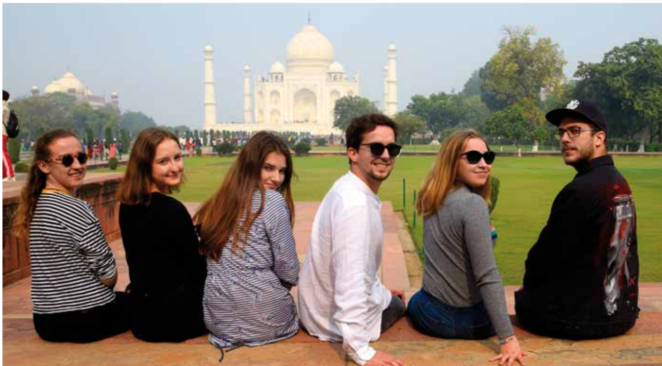
Divadelní soubor Na koni má vzpomínky na Indii.

Na cestu do Indie se vydává divadelní soubor Na koni hned ráno autobusem směr vídeňské letiště. Nocujeme už v Dubaji, kde jsme stihli prohlédnout Burž Chalífa, nejvyšší budovu světa, a pak už nasedáme do letadla a míříme směr Nové Dillí. Autobusem vyrážíme směr Greater Noida, kde na dívky čekají rodiny, ve kterých budou následující tři noci přebývat.