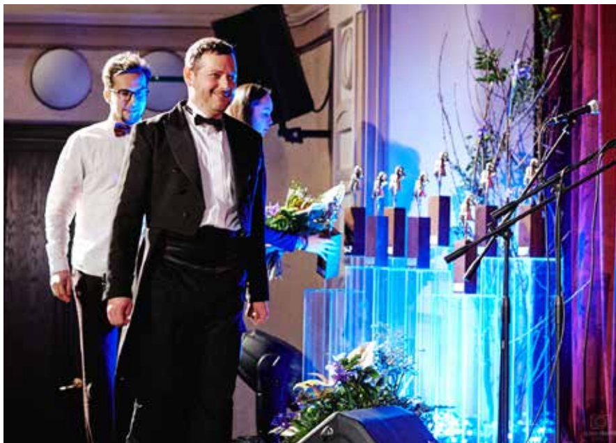
V divadle se pravidelně předávají ceny města.