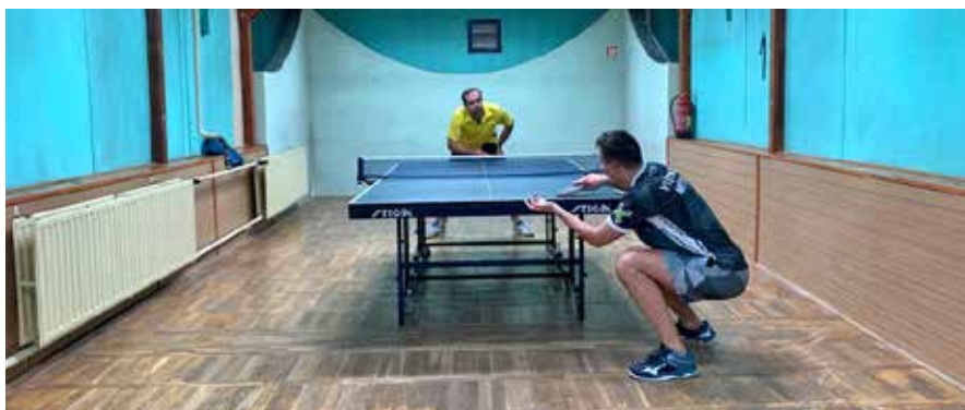
Další úspěch si připsali stolní tenisté Vysokého Mýta proti Sudslavě.

Úvodní čtyřhry nepřinesli nic dramatického a obě v pohodě získalo V. Mýto. Také v prvních kolech singlu to byla opět smrt vysokomýtských výher, kde Hýbl zdolal Dostálka 3:0, Fišer Karla Syrového 3:1 a Dvořák Valacha 3:0. První bod připsal na konto domácích Vojta Syrový, který zdolal po velké bitvě Vojnara 3:2 na sety. Další body opět