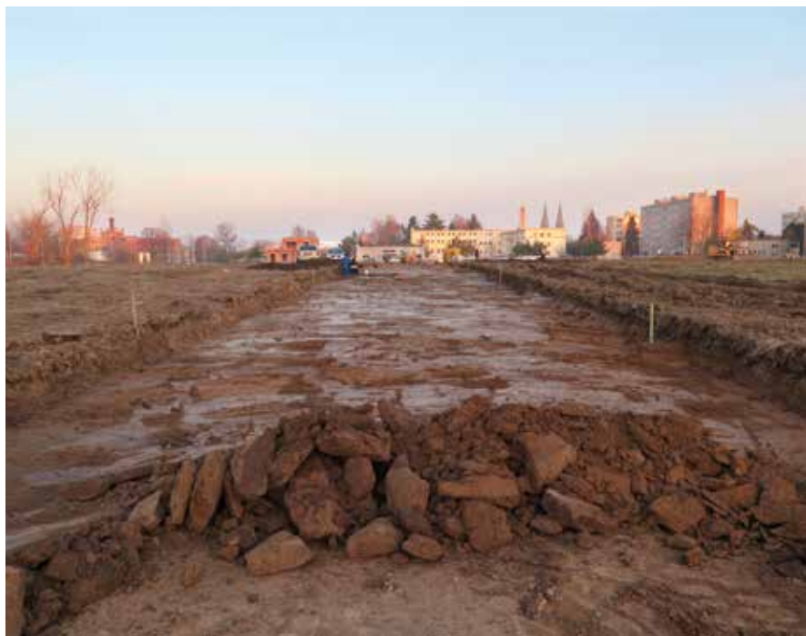
Tady povede budoucí Sodomkova ulice.

Řešení je v zásadě jednoduché. Je zapotřebí začít řešit archeologický výzkum co nejdříve, nejlépe po zakoupení pozemku. Archeologické pracoviště Regionálního muzea ve Vysokém Mýtě má na starosti