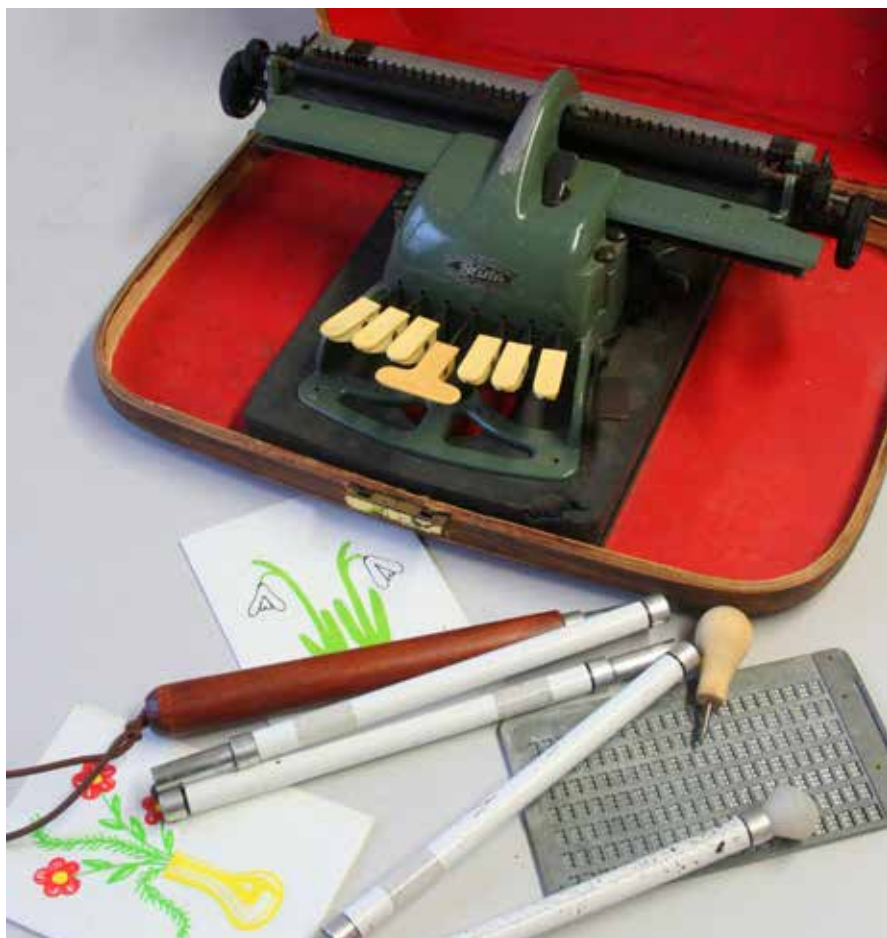
Pichtův psací stroj a další pomůcky pro nevidomé.

Od úterý do neděle bude v muzeu samoobslužný program přibližující život lidí se zrakovým postižením a nevidomých prostřednictvím speciálních pomůcek. Bude možné si osahat a vyzkoušet např. Pichtův psací stroj, Braillovo písmo či šablonku na rozlišování bankovek. Každý si bude moci prověřit, jaké má schopnosti pomocí hmatu rozpoznat tvary, či materiály. Chybět nebude chůze po slepu s bílou holí. (V případě dobrého počasí by dráha vznikla na dvorku muzea.)