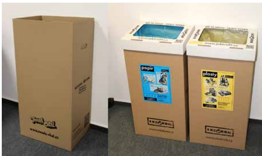
Kartonové boxy se v technické škole osvědčily.

Žáci školy byli poučeni o pravidlech třídění a mohli jsme začít. Výsledky byly překvapivé: během poměrně krátké doby jsme dokázali vytřídit opravdu velké množství odpadu. Takto ve škole vytríděný odpad je pak vysypán do velkých kontejnerů na tříděný odpad, které jsou umístěny na sta-