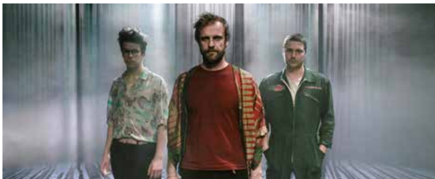
Skupina Please The Trees v únoru vystoupí v M-klubu.

Please The Trees je žánrově těžko uchopitelná a neustále se proměňující stálice české nezávislé scény, která je pověstná strhujícími koncerty a vždy přítomným environmentálním poselstvím.