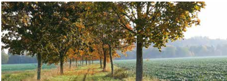
Plochy zeleně slouží lidem pro odpočinek a rekreaci.

Veřejné plochy zeleně slouží lidem pro rekreaci a krátkodobý odpočinek. Patří mezi ně například městské parky a parčíky, zeleň kolem významných budov či uměleckých děl, dětská hřiště, sídlištní zeleň, doprovodná zeleň podél komunikací, uliční stromořadí a jiné. Zeleň ve městě zahrnuje stromy, keře, květiny a travnaté plochy. Je nedílnou a nepostradatelnou součástí městského urbanismu. Významně ovlivňuje kvalitu života a to hned několika způsoby. Například po zdravotní stránce zeleň snižuje hluchost, prašnost a zvyšuje kvalitu vzduchu, vytváří příjemné mikroklima. Zadržováním vody a následně jejím výparem, zvlhčuje vzduch a vyrovnává teplotní bilance, čímž v létě snižuje okolní teplotu. Proto nám během horkých dnů připadá pobyt pod korunami stromů příjemnější. Zeleň působí jako přírodní klimatizace. Zajímavou a důležitou funkcí zeleně je i její významný vliv na psychiku lidí. Aniž bychom si toho byli mnohdy vědomi, i malý