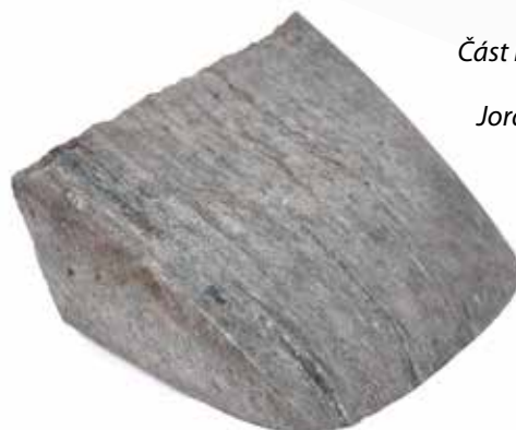
Část kamenné sekery Jordanovské kultury