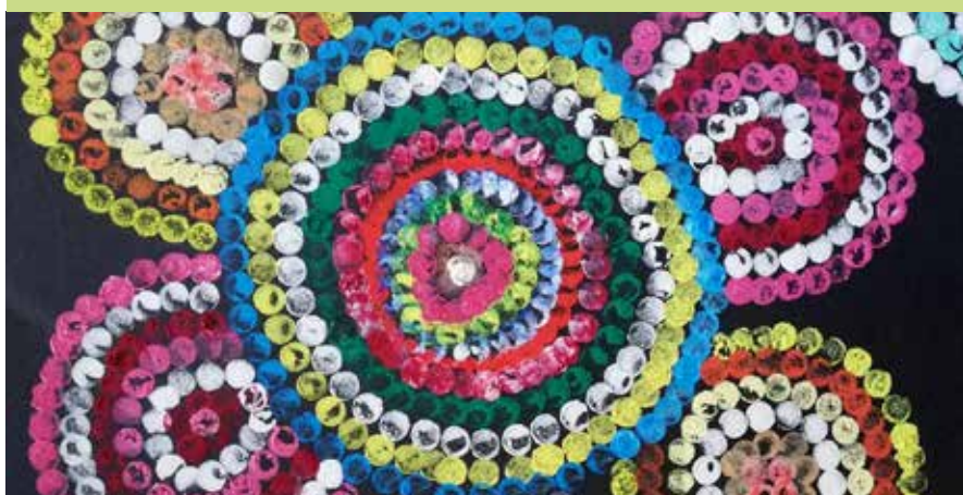
Kreativní obrázky klientů Bereniky.

20. 2. – 31. 3., vestibul knihovny VÝSTAVA KREATIVNÍCH OBRÁZKŮ