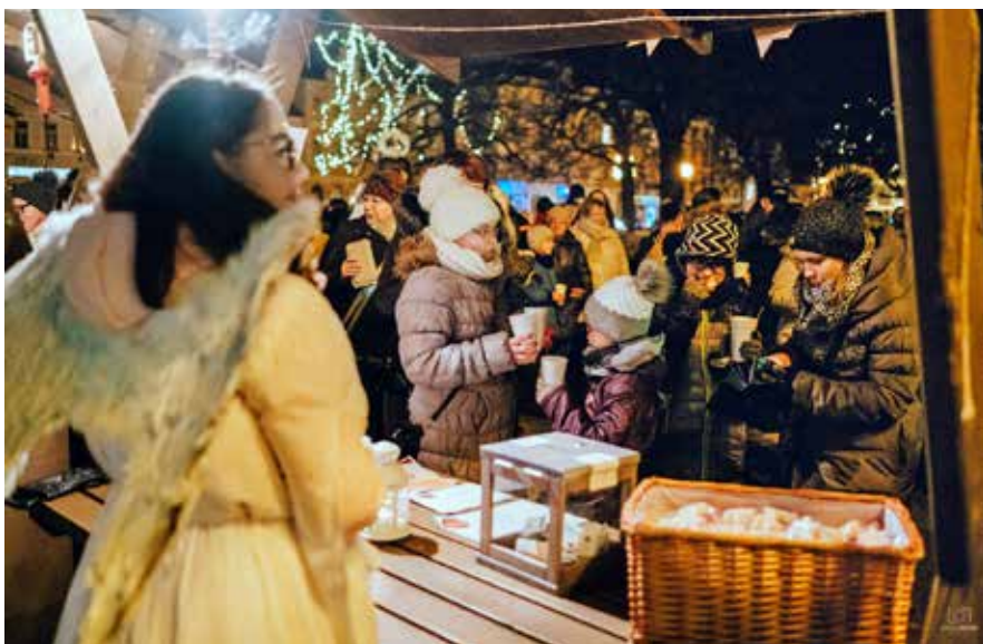
(red) První peníze se v kasičce objevily hned po začátku akce Česko zpívá koledy.

Turistické informační centrum a městská galerie vyhlásily v loňském roce dvě veřejné sbírky. Ta květnová, která se odehrávala během akce Noc v galerii, napomohla k dokonalému zrestaurování díla sochaře Jana Štursy s názvem Po koupeli. Celkové náklady na renovaci sádrové Štursovy plastiky, kde bylo mj. použito 50 gramů zlata, se vyšplhaly na 70 tisíc korun.