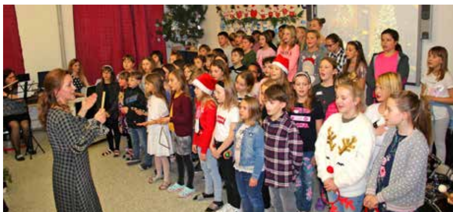
Při Vánočním jarmarku se také zpívalo.