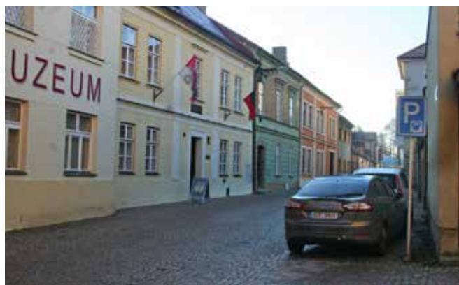
Pohled na rodný dům Aloise Vojtěcha Šembery dnes. Sídlí v něm Regionální muzeum Vysoké Mýto.