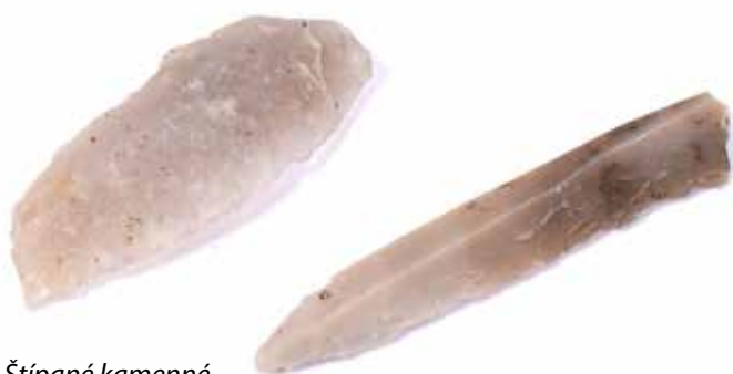
Štípané kamenné nástroje Jordanovské kultury