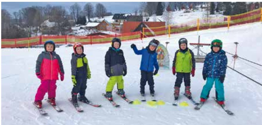
V Čenkovicích absolvovali žáci ze ZŠ Jiráskova lyžařský výcvik.

Ve Vysokém Mýtě není po sněhu ani památky, ale v Čenkovicích se lyžuje.