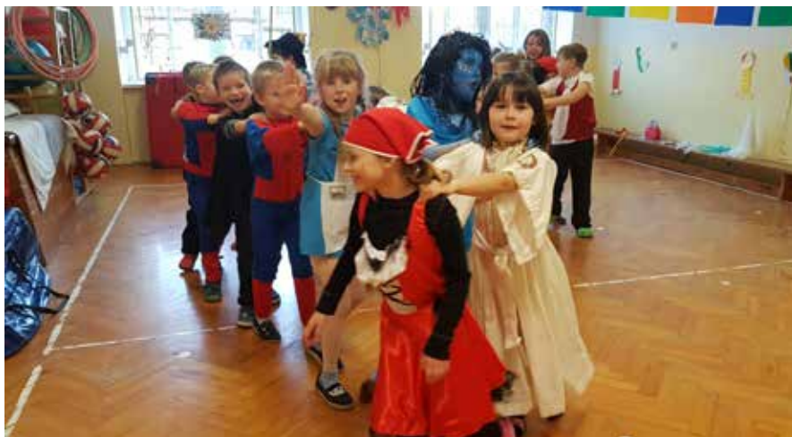
V knířovské škole připraví v únoru masopust.

Masopust je svátek, jenž se slaví ve dnech předcházejících Popeleční středě, kterou začíná 40 denní půst před Velikonocemi. Oblíbeným dnem býval „tučný čtvrtek“, kdy se mělo jíst a pít co nejvíce, aby byl celý rok při síle. Největší veselí vypuklo od neděle do úterý. V tomto období se tancovalo, hodovalo a vyvrcholením byly průvody i taškařice maškar. Někde zakončili o úterní půlnoci muziku „pochováním basy“ nebo pochovávali Bakcha. Tradiční masopustní obchůzky na Hlinecku jsou nyní součástí světového kulturního dědictví UNESCO.