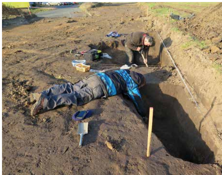
Archeologové při práci v lokalitě za pivovarem.

Jsem rád za tuto otázku, protože výzkum bude samozřejmě pokračovat dále i při stavbě rodinných domů. Jsem však přesvědčen o tom, že v okamžiku správného a včasného postupu ze strany majitelů pozemků se jich výzkum dotkne minimálně. Vlastník pozemků je před stavbou kvůli ochraně půdního fondu povinen provést skryvku ornice v ploše stavby, přičemž ta musí být reálně provedena až na podloží. Rozsah skryvky je dán rozsahem stavby. Ideální by však pochopitelně byla skryvka celé parcely, archeologové by tak získali celý půdorys pravěkého sídliště a majitel pozemku zase potřebný klid pro svá případná budoucí stavební rozhodnutí. Pro výstavbu bazénu, pergoly, garáže platí v tomto ohledu stejná pravidla jako pro výstavbu rodinného domu. Skryvka ale něco stojí, a tu si majitel hradí sám.