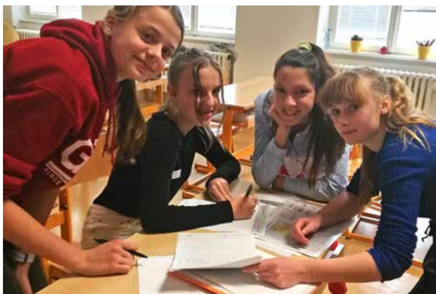
Žáci se učili, jak natočit vzpomínky pamětníka.