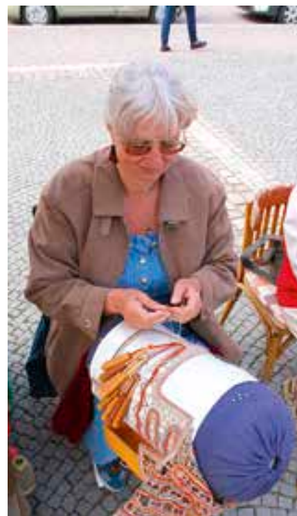
Na Dni Země se představí i stará řemesla.