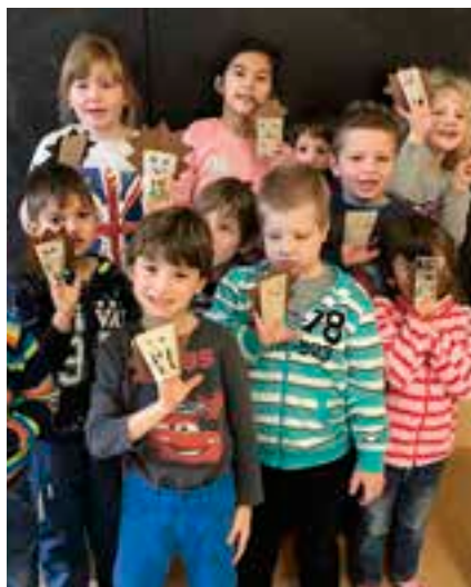
Přípravná třída – výroba maňáška na ruku.