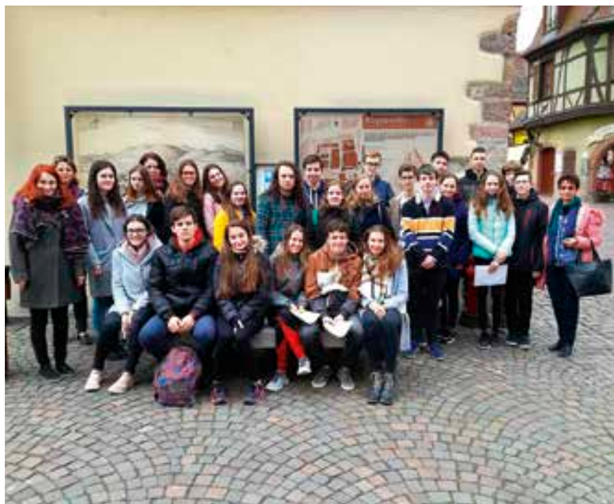
Gymnazisté navštívili vesničku Riquewihr.