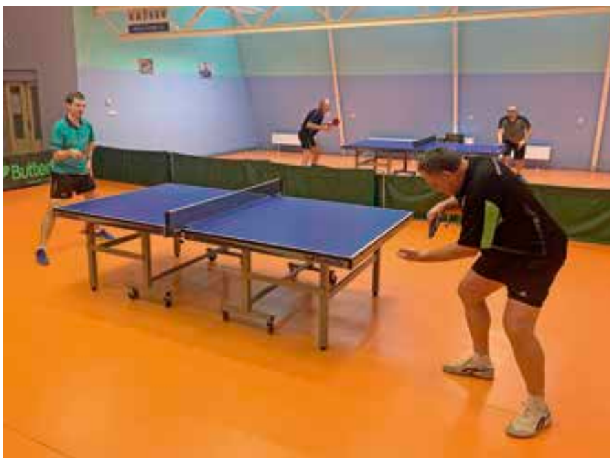
Stolní tenisté Vysokého Mýta uspěli napůl.