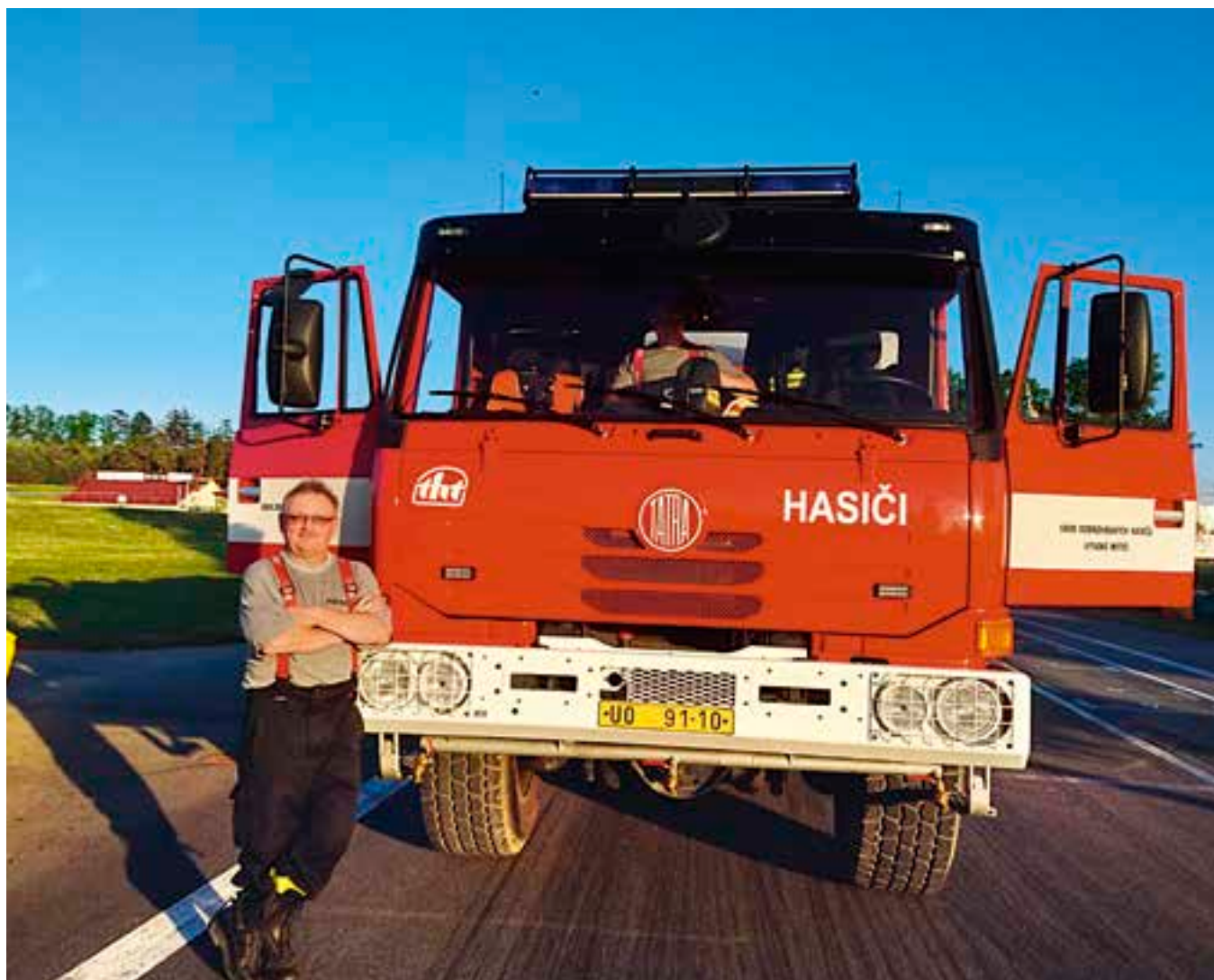
Vysokomýtská hasičská technika funguje také na místním autodromu.