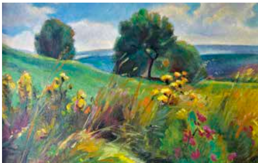
Louka, olej Josefa Pilaře.

Nová výstava 5. 4.–5. 5., Městská galerie KRAJINOU JOSEFA PILAŘE Vernisáž v pátek 5. 4. v 17 hodin