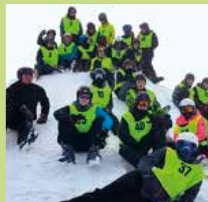
Studenti technické školy mají za sebou lyžařský výcvik v Krkonoších.