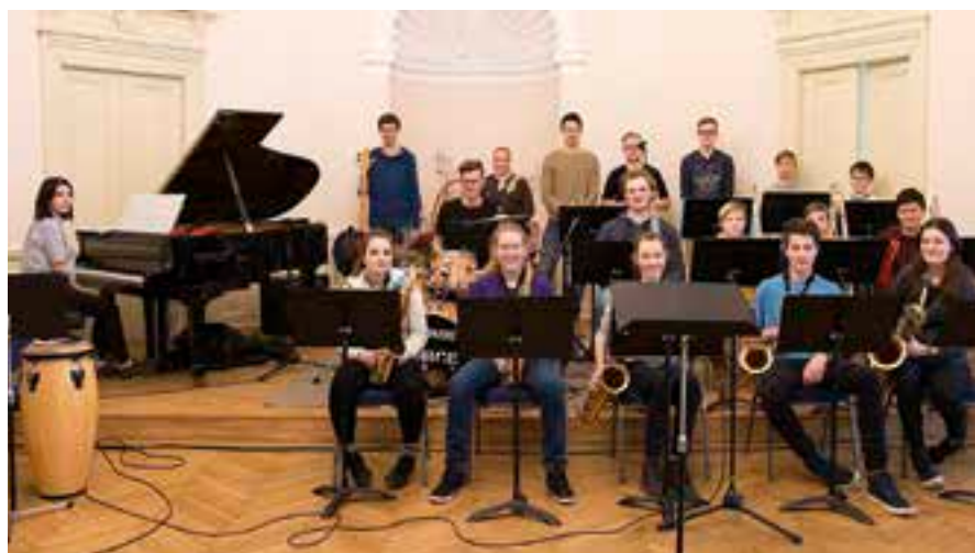
Juniorský Big Band se porovná s podobným seskupením ze Žamberku.

Vstupné: 100/150 Kč. Vstupenky v prodeji v IC ve Vysokém Mýtě, Litomyšli, Poličce a online.