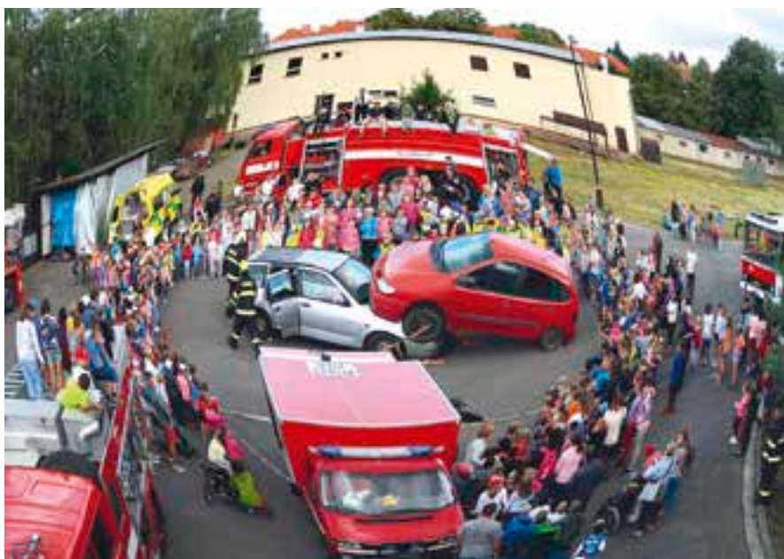
Den otevřených dveří u hasičů láká všechny věkové skupiny.

Statistika nejčastěji vykazuje technické záahy, jako jsou následky větrných smrští,