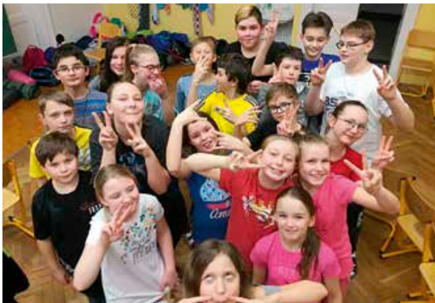
Noční škola byla jako dárek.