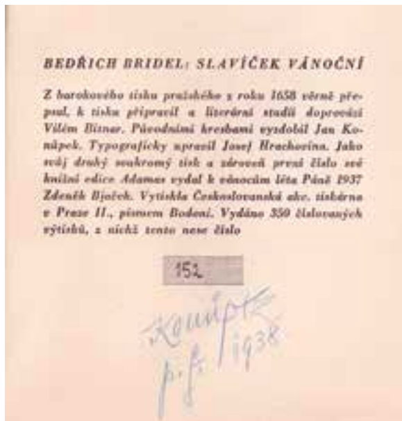
Bridel, Bedřich. Slavíček vánoční . Praha: Zdeněk Bjaček, 1937. Tiráž s podpisem ilustrátora.

Naše muzeum bohužel nevlastní žádný dobový tisk Bridelova díla, ve fondu máme