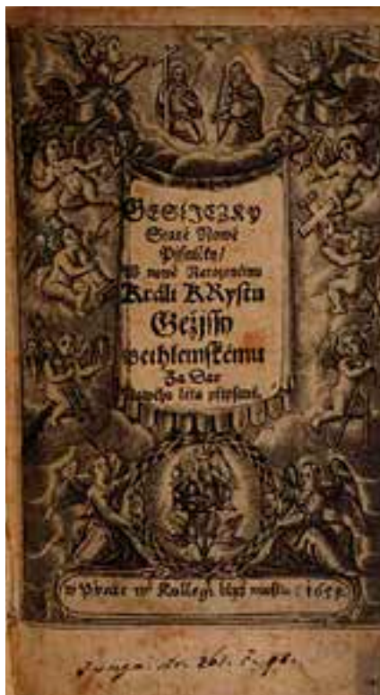
Bridel, Bedřich. GeslŹczky Staré Nowé Pjsničky . W Praze: w Kolegi blíž mostu, 1658. Titulní strana.

pouze pět jeho knih vydaných ve 20. století: Život svatého Ivana, prvního v Čechách poustevníka a vyznavače (1936), Křesťanské učení veršemi vyložené (1939), Slavíček vánoční (1937, 1993) a Básnické dílo (1994).