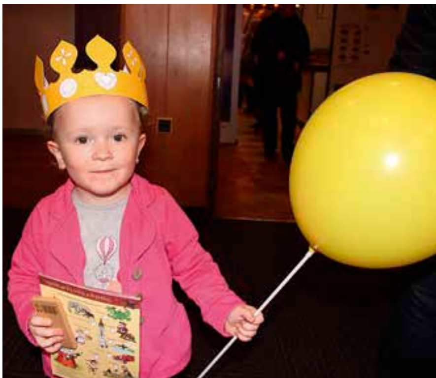
Na veletrhu v Hradci Králové byly i malé královny.