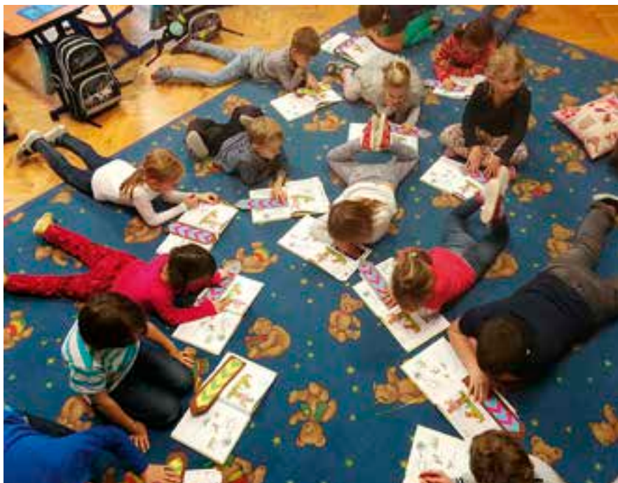
Děti ve škole v Knířově čtou rádi.

Poutavé besedy se spisovateli pořádáme i v naší škole. V březnu nás navštívila již podruhé spisovatelka Jitka Vítová. Její knihy O Květušce máme v naší knihovně pro spo-