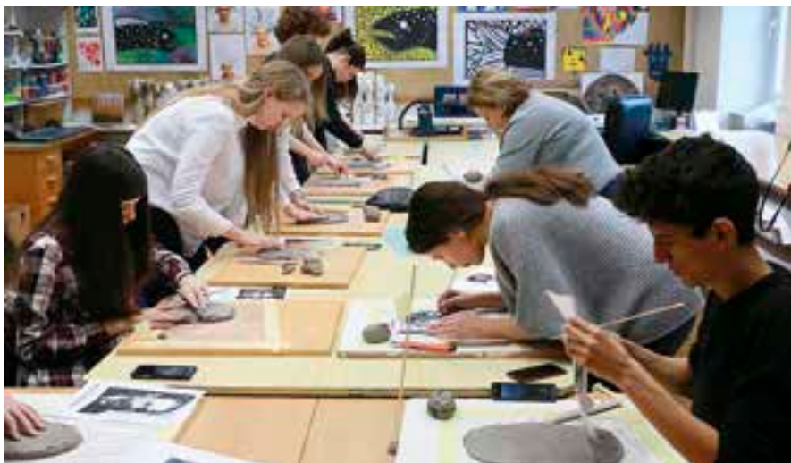
Zahraniční studenti pracují v prostorách ZUŠ Vysoké Mýto na výtvarných pracích v rámci projektu EU.