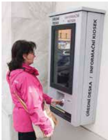
Úřední deska už má nyní jinou podobu.

hlednost, které ve vitrínách ani při nejlepší snaze nebylo možné docílit, protože listinné dokumenty v nich byly z kapacitních důvodů vyvěšovány podle volného místa.