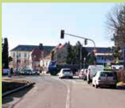
Od dubna do června se řidiči ve Vysokém Mýtě musí připravit na objížďné trasy.

Při úpravě křižovatek na silnici I/35 ve Vysokém Mýtě budou od dubna do června vždy pro jeden směr jízdy stanoveny objížďné trasy. V průběhu úpravy přechodu u krytého bazénu a světelné křižovatky s ulicí Prokopa Velikého bude objížďná trasa ve směru od Hradce Králové vedena přes ulici Průmyslovou, s odbočením vpravo na ulici Vraclavskou a dále vlevo, po tzv. „Peklovecké“ k silnici III/35711 (tzv. „Vanická“) a zpět do ulice Gen. Svatoně, ze které vyústí na křižovatku se silnicí I/35. Na uvedených komunikacích bude před zahájením i po skončení objížďky provedena výsrava vozovky.