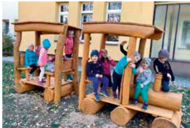
Počátkem dubna vyrazí do škol budoucí prvňáčci.

Jindřiška Kloudová, odbor školství, kultury a sportu