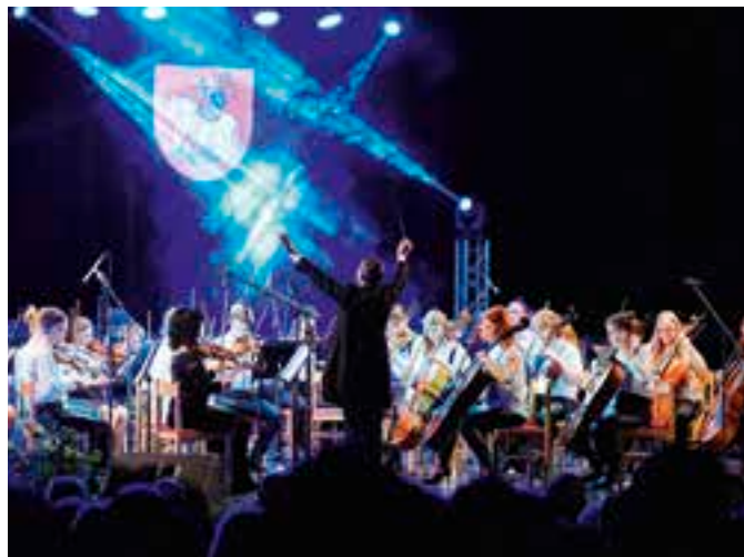
Orchestr Harmonia Iuvenis ZUŠ Vysoké Mýto rozdával celý večer dobrou náladu.