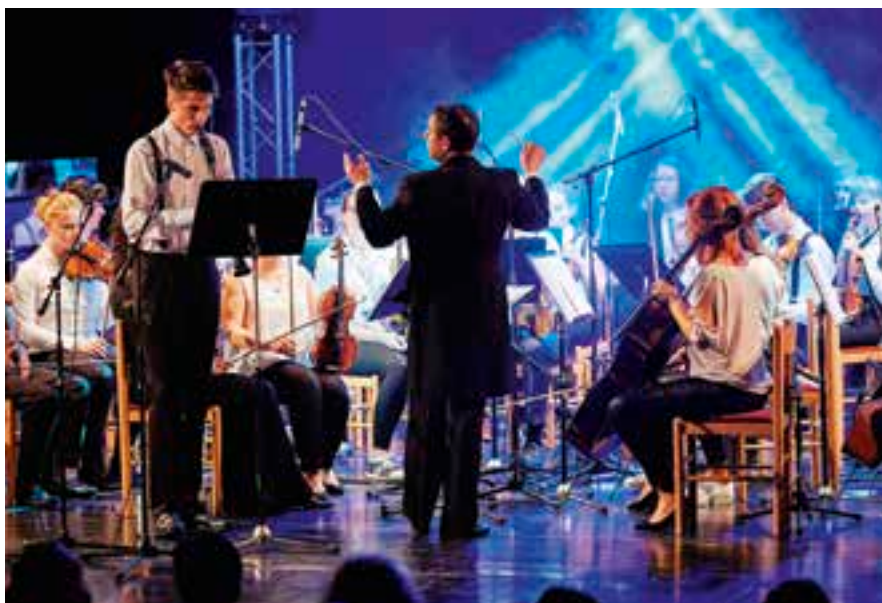
Harmonia Iuvenis nabízí velké příležitosti pro muzikanty.

Repertoár orchestru je v dnešní době složen ze skladeb rozmanitých stylů, období i žánrů. Děti hrají úpravy popových písní, filmové a muzikálové melodie, nechybí samozřejmě i klasická hudba.