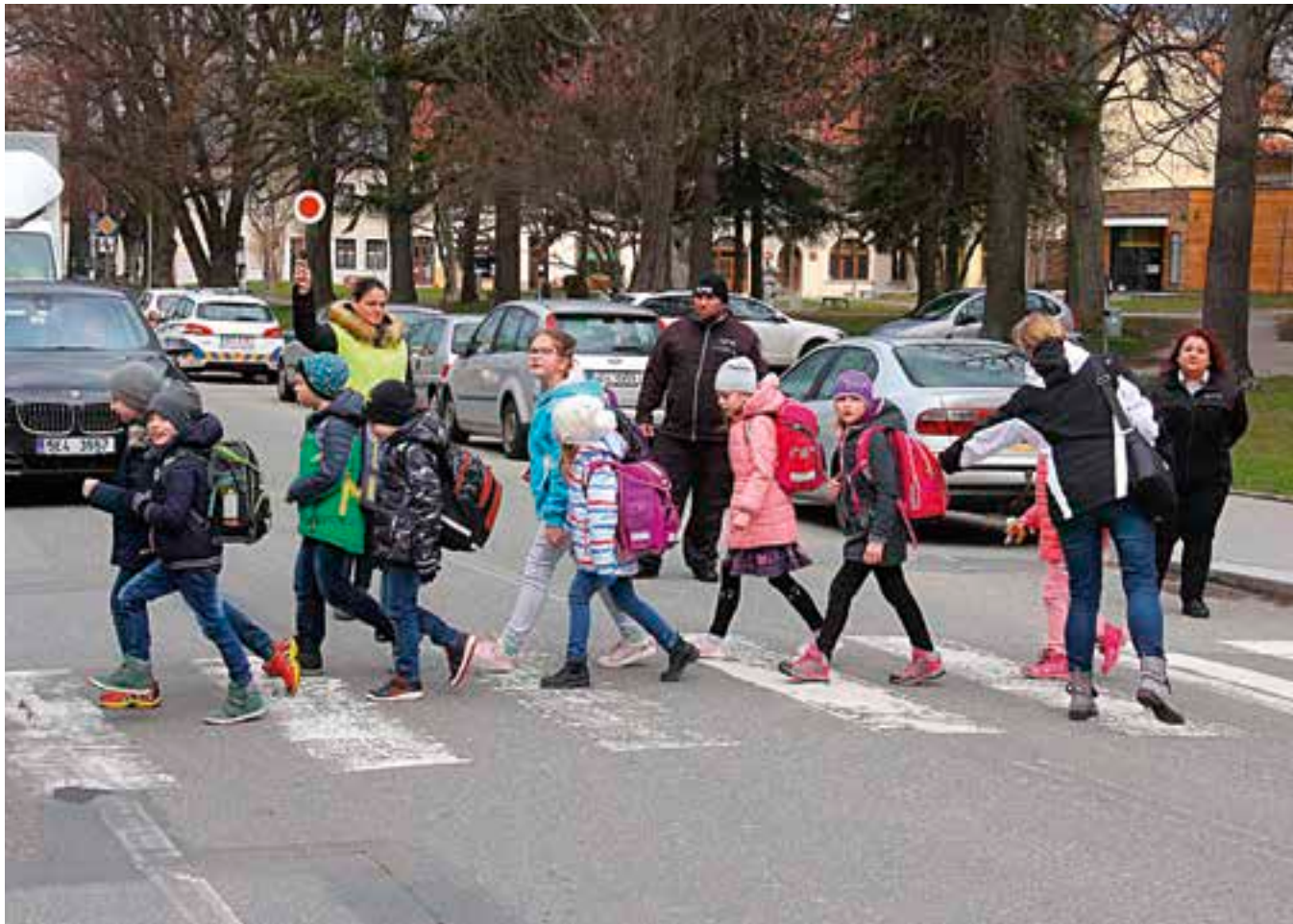
I tohle patří do pracovní náplně asistentů prevence kriminality.

Vysoké Mýto má už více než šestiletou dobrou zkušenost s činností asistentů prevence kriminality. Když s nimi v polovině roku 2012 začínalo, bylo jedním z prvních měst v republice, které se rozhodla pro soustavnou každodenní preventivní práci přímo v terénu.