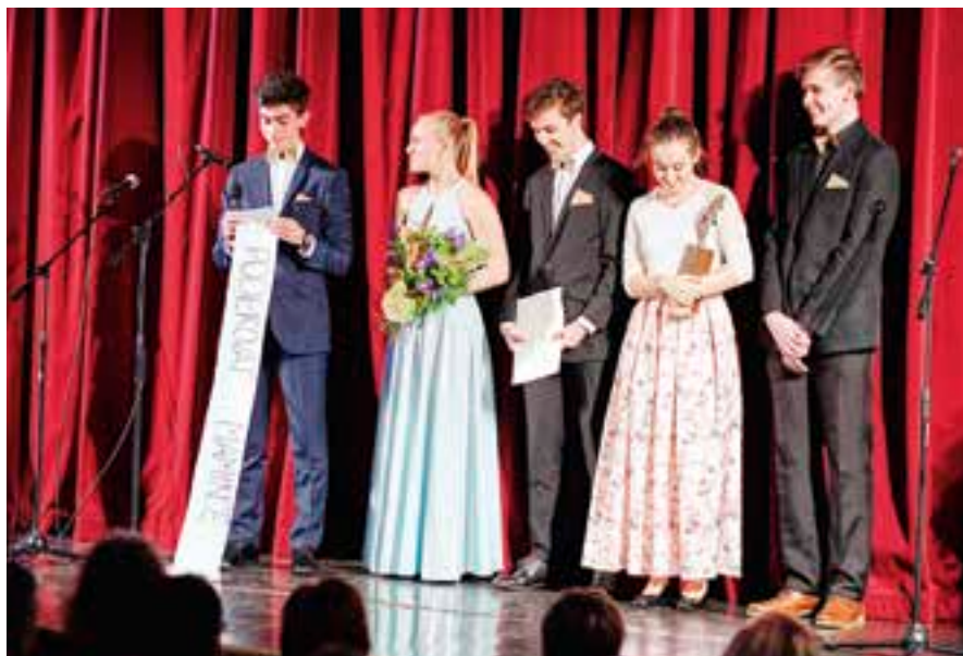
Studenti za stavební školy děkovali také rodičům.