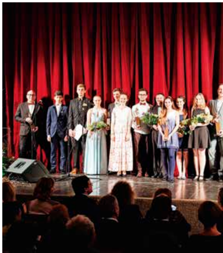
Plejáda oceněných při Výročních cenách města Vysoké Mýto za rok 2018.