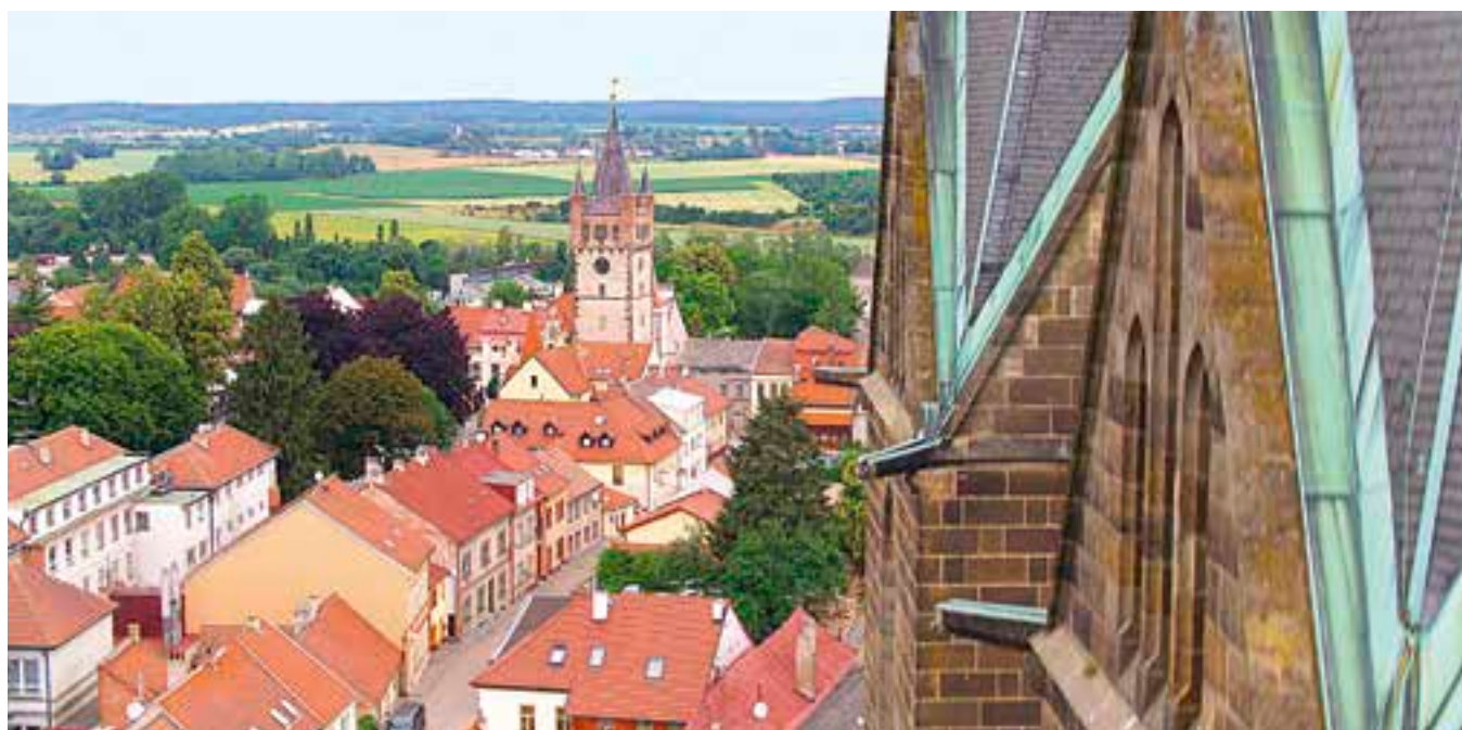
Takto vypadá Vysoké Mýto z dronu.