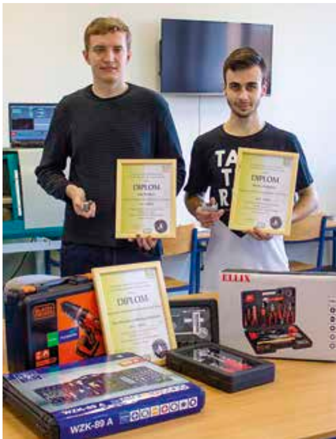
Soutěž KOVO Junior.