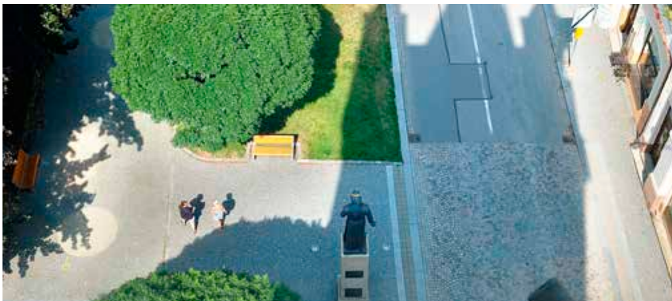
Pražská brána je otevřena o prázdninách každý den.