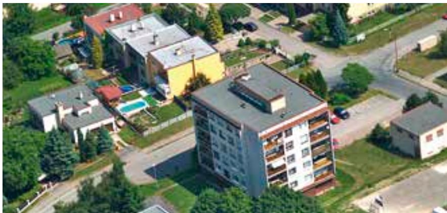
V Peklovcích se můžou těšit na nové přípojky.

Vodovody a kanalizace Vysoké Mýto, s. r. o.