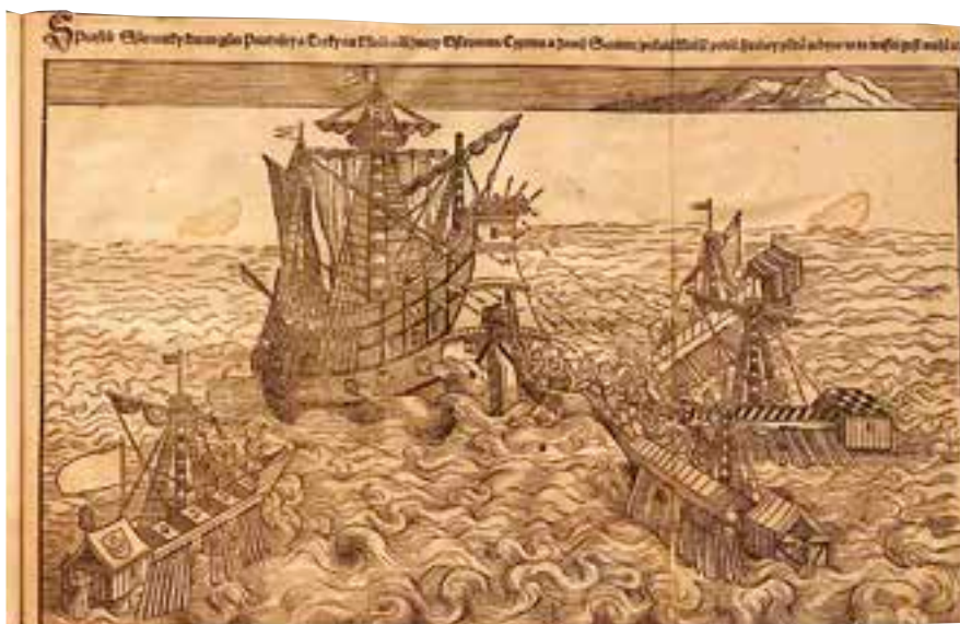
Námořní bitva s Turky. 54 D 005552; Národní knihovna České republiky; Praha; Česká republika.

Během své první cesty, kterou podnikl roku 1546, si psal podrobný deník. Zaznamenával v něm postřehy o stavbách, krajině, zvířatech a hlavně lidech. Po návratu ho půjčoval svým přátelům, kteří si ho opisovali a žádali Prefáta, aby své zážitky vydal knižně. Tomu se do vydávání knihy původně moc nechtělo, jak sám píše v předmluvě: „Ale já jsa toho dobře povědom, v jakou pomluvu a utrhaní se častokrát každý takový