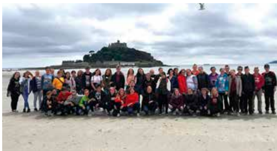
Poznávací zájezd do Anglie se vydařil.