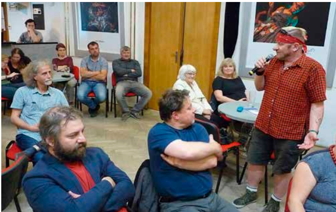
Seminář o umístování uměleckých soch ve veřejném prostoru byl zajímavý.