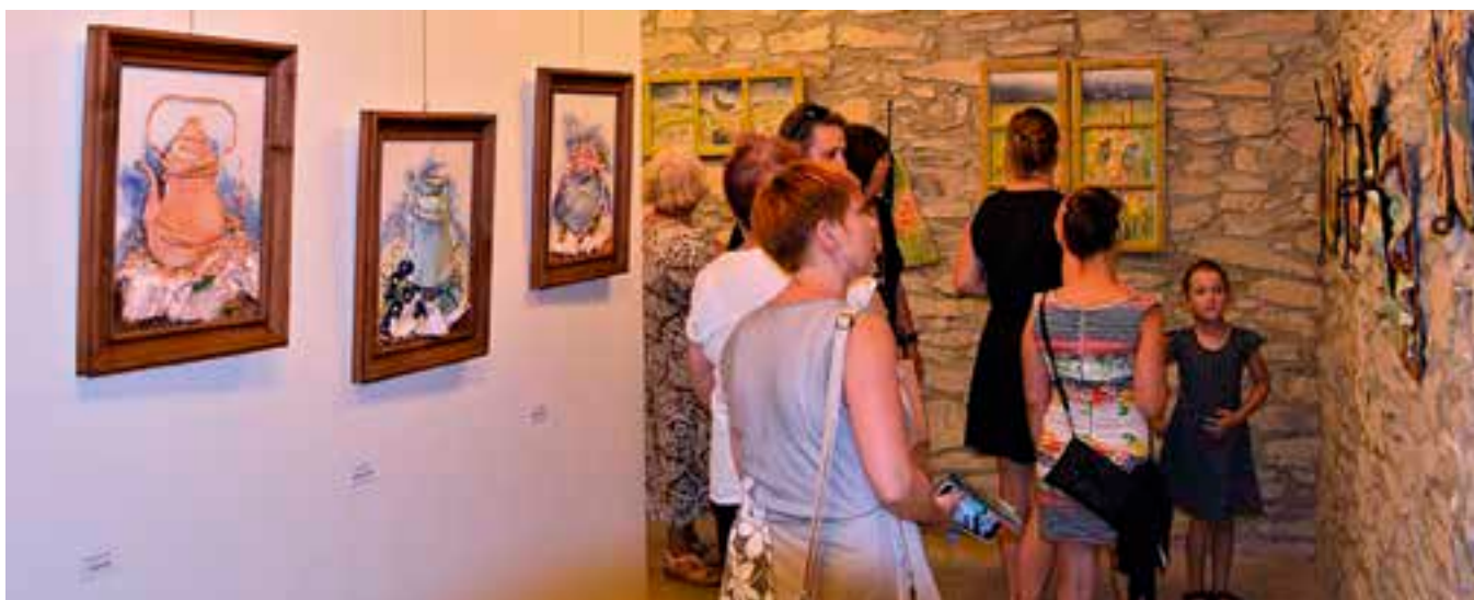
Galerie ve Zvonici nabízí během léta zajímavé výstavy.

Rozhodně stojí za to podívat se na Vysoké Mýto o prázdninách z vrchu... (ny)