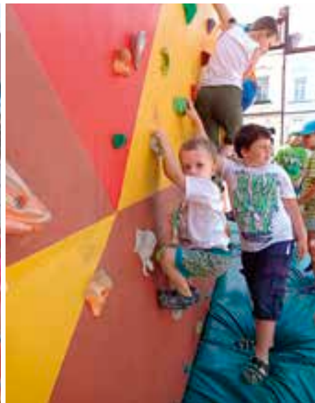
Sportovní den nabídl pestrý program.

Stovky dětí zaplnily 12. června náměstí Přemysla Otakara II., kde se už po deváté uskutečnil Sportovní den. Přišly se podívat na ukázky sportů, které jim zde představily vysokomytské sportovní kluby a oddíly, a trochu si i zasportovat. „Sportovní den organizuje město Vysoké Mýto ve spolupráci s Mikádem, Ivecem a hlavně s místními