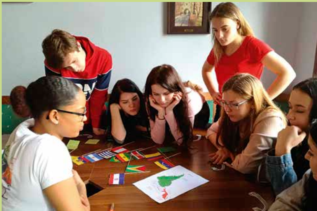
Žáci španělštiny při interaktivním workshopu.