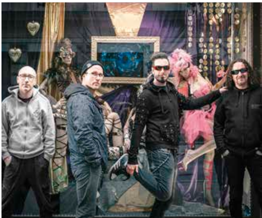
Týden hudby na vysokomýtském náměstí osvěží slovenská punková kapela Horkýže Slíže.

Změna programu vyhrazena. Uvedené časy jsou orientační.