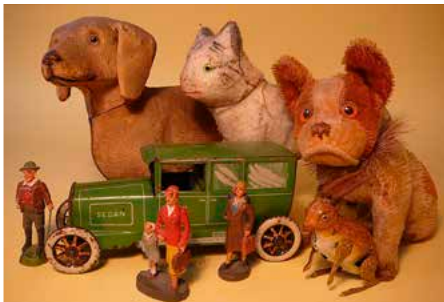
Hračky se sbírky Muzea technických hraček.