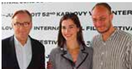
Karel Dobrý získal Českého lva za nejlepší mužský herecký výkon v hlavní roli.

100 min. V českém znění. Od 12 let. Vstupné 50 Kč.