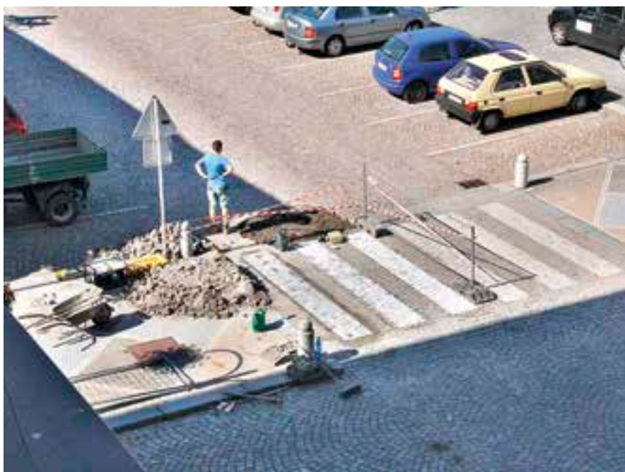
Na náměstí se opravují přechody.

Technické služby mají údržbu a opravy chodníků, komunikací, veřejného osvětlení a veřejných prostranství jako jednu ze svých hlavních činností. Do plánu oprav