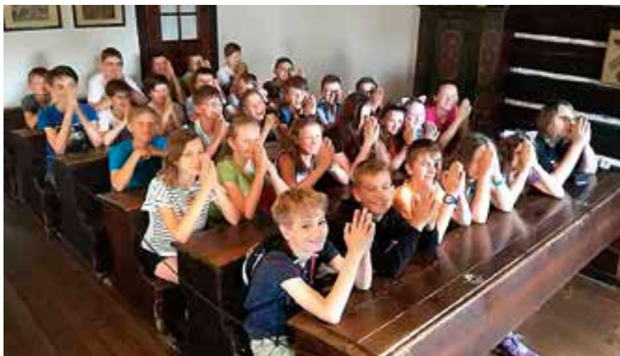
Konec školního roku přináší i spoustu výletů.