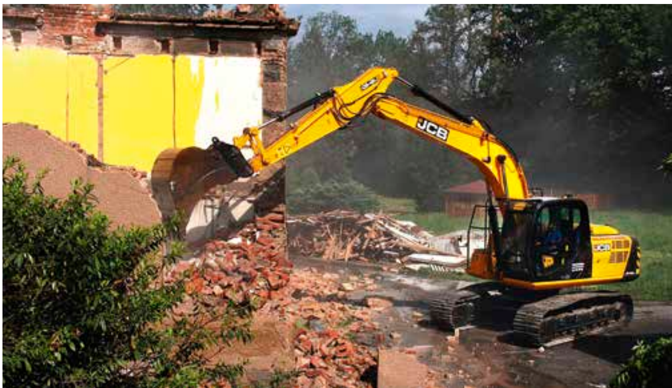
V Hradecké ulici už může začít stavba pro záchranku.