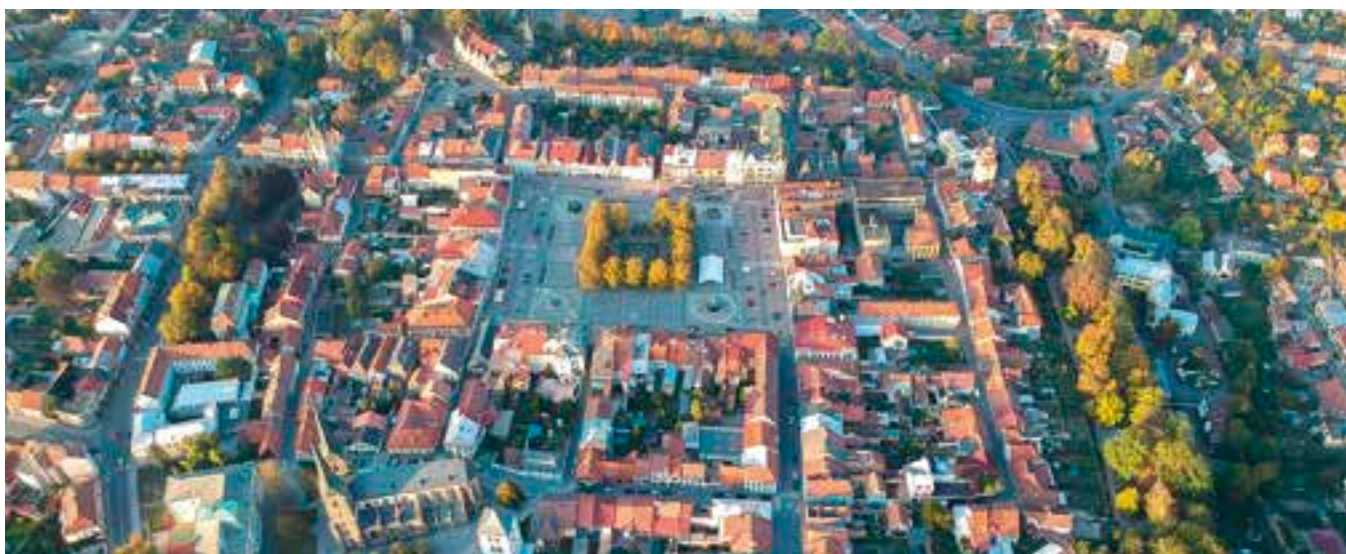
Regulační plán městské památkové zóny vydalo zastupitelstvo města.