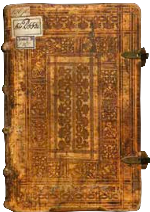
Renesanční vazba prvního vydání. 54 D 005552; Národní knihovna České republiky; Praha; Česká republika

Barbora Horáková, knihovna Regionálního muzea ve Vysokém Mýtě