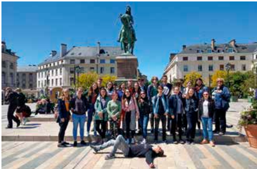
Pobyt ve Francii se vydařil.