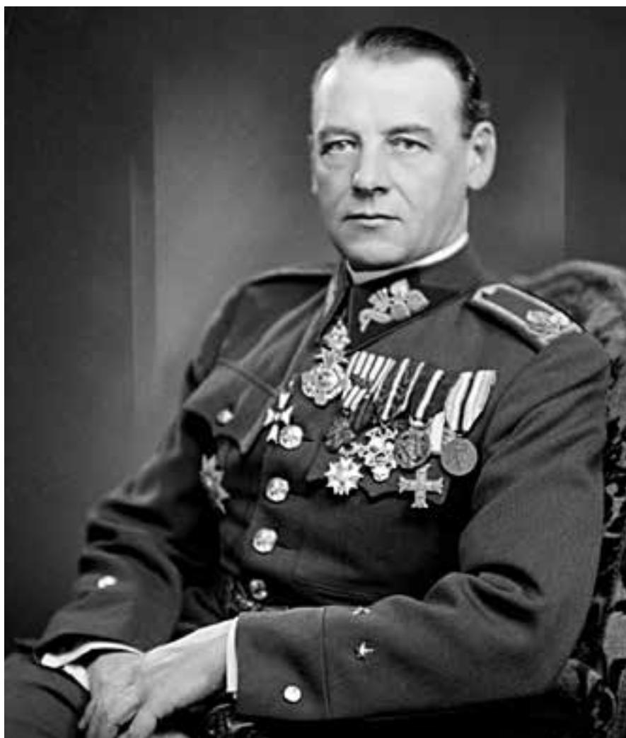
Armádní generál Rudolf Viest.

Vznik slovenského klerofašistického státu přivítal Rudolf Viest s nevolí. Podepsal spolu se stovkou slovenských kulturních a vojenských osobností memorandum, ve kterém se ohrazoval proti tomuto kroku. Dál nebylo co řešit, bez dlouhého rozmýš-