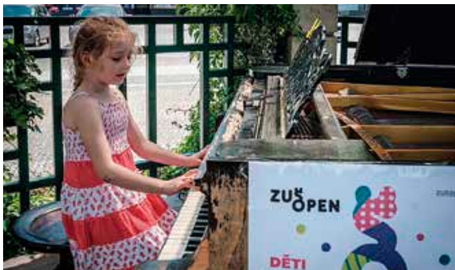
Žákyně klavírního oddělení ZUŠ.