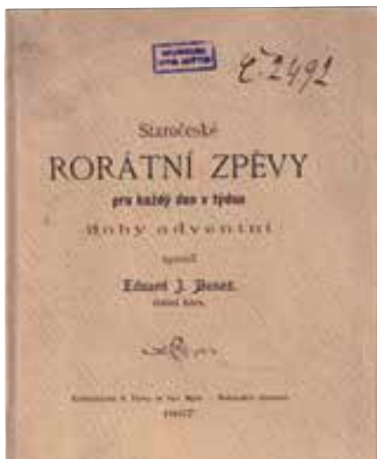
Obálka knihy, sbírka RMVM

„Rorate“, aneb „Rosu dejte“ je ranní votivní mše ke cti Panny Marie, která se slouží v adventu. Její počátky můžeme klást do doby vlády Karla IV. Dokládají to notované knihy arcibiskupa Arnošta z Pardubic, dopsané roku 1364. Mše byla původně v latině, v 16. století se začal liturgický text překládat do češtiny, zjednodušil se nápěv a chorál s textem v mateřské řeči přestal být výluč-