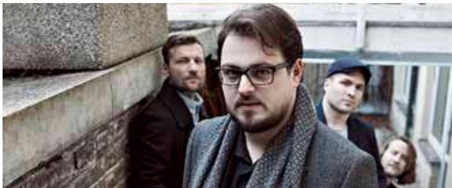
David Stypka se představí v M-klubu.

Vstupné: 200/250 Kč. Vstupenky v předprodeji v IC Vysoké Mýto, Litomyšl, Polička a online.