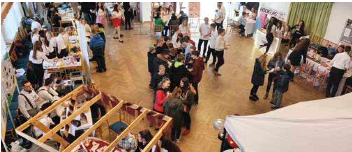
Veletrh fiktivních firem se uskutečnil už po sedmé.