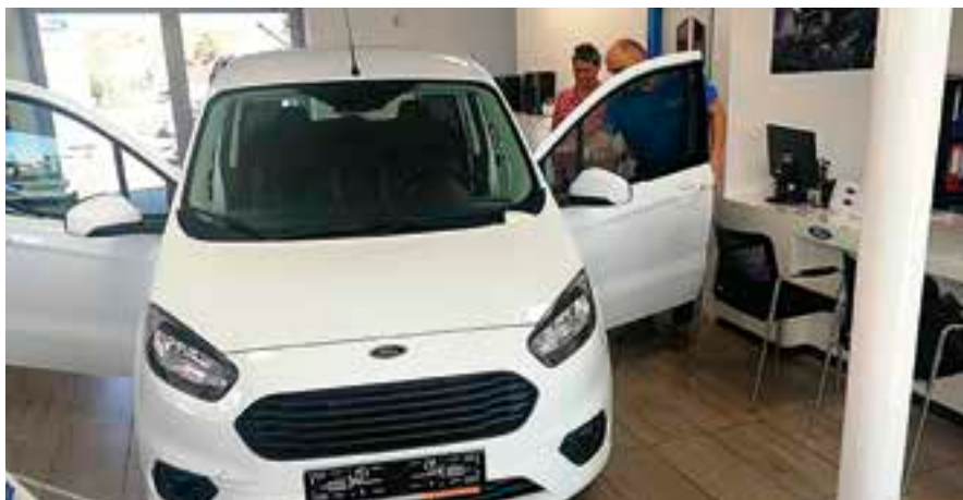
Nové vozidlo už jezdí za klienty.

Město poskytuje na území Vysokého Mýta pečovatelskou službu v domech s pečovatelskou službou a v domácnostech klientů, kteří se ocitli v nepříznivých sociálních situacích třeba z důvodu nemoci, samoty či zdravotního postižení. V rámci terénních programů město také pomáhá obyvatelům vyloučených romských lokalit. Sociální služby na území města zajišťují pečovatelské, které ke své činnosti nezbytně potřebují automobil. Nový automobil jim umožní operativnější a rychlejší přesuny, díky čemuž budou moci obsloužit více klientů. V neposlední řadě tak přispěje ke kvalitnějšímu poskytování sociálních služeb, které město zajišťuje. Nový automobil