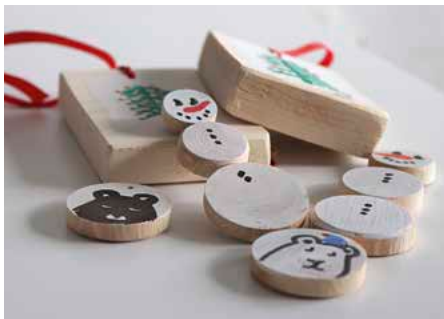
Dívky z výchovného ústavu vyrábějí například jemné ozdůbky na vánoční stromek.

Vánoce tráví děti, pokud situace dovolí, doma nebo u svých příbuzných. Bohužel u nás máme spoustu dětí, které nemají kam jít. Často do poslední chvíle netušíme, zda se najde někdo, kdo by si dané dítě na Štědrý den vzal. Je to velmi těžká situace jak pro děvčata samotná, tak pro kolegy.