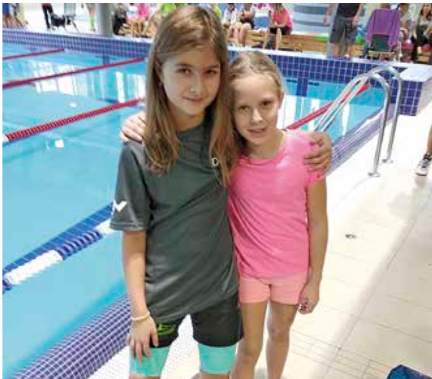
Vysokomýtské plavkyně mají za sebou sérii podzimních závodů.