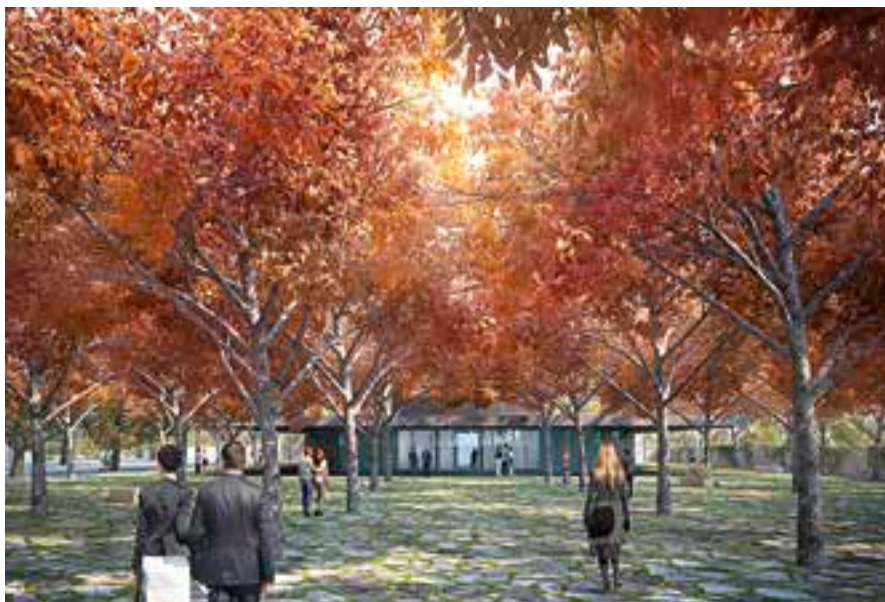
Vizualizace nové smuteční síně Projektil architekti, s. r. o.