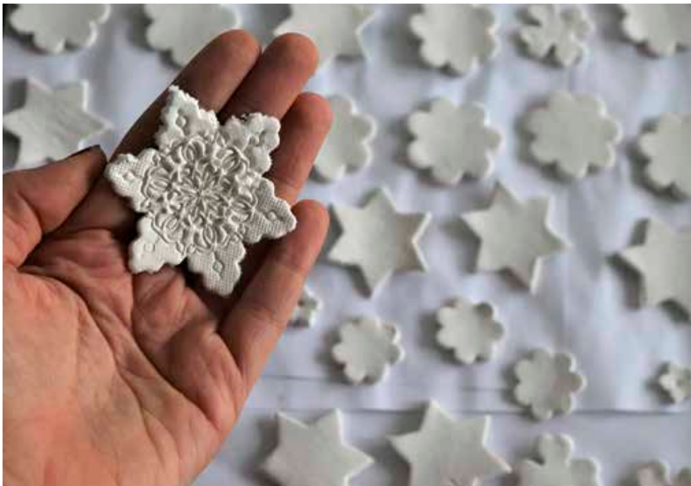
Vánoční výrobky děvčat si můžete zakoupit třeba na adventních jarmarcích.