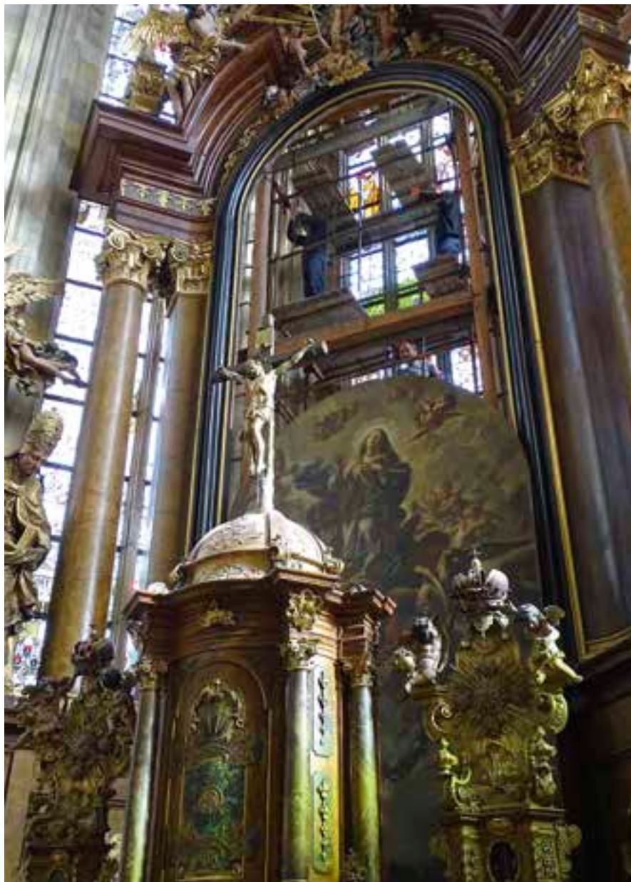
Oltářní obraz z kostela svatého Vavřince se má vrátit do města na podzim 2021.