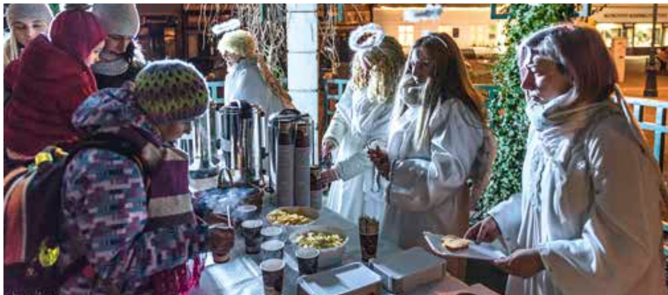
I letos budou andělé obsluhovat na akci Česko zpívá koledy.

Den D, hodina H, sbírka S – i takto by se dala vyjádřit středa 11. prosince na náměstí Přemysla Otakara II. Již tradiční akce Česko zpívá koledy, jejímž spoluorganizátorem jsou Turistické informační centrum a M-Klub, totiž přinese jednu výraznou a významnou novinku. Tou bude vyhlášení veřejné sbírky určené klientům Domova pro seniory Ledax Vysoké Mýto.