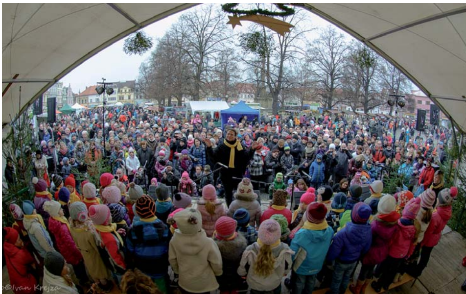
Adventní kujebácký jarmark (29. 11.).