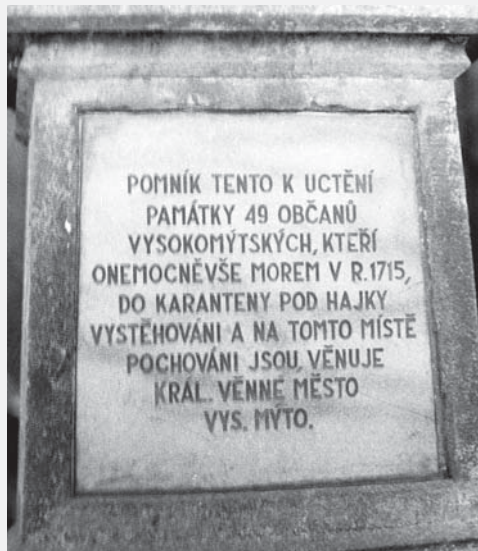
Detail nápisu na pomníku, foto Stanislav Loskot, 1978, ze sbírek RMVM.