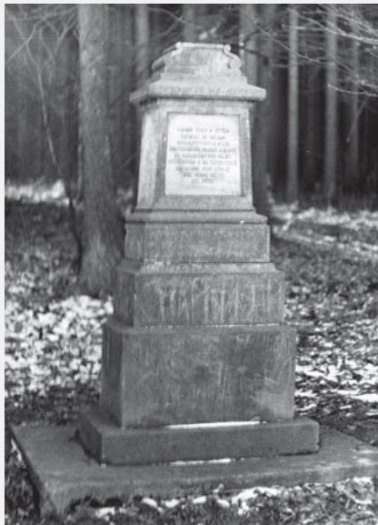
Stejný pohled z roku 1978, foto Stanislav Loskot, 1978, ze sbírek RMVM.

Pokud bychom prošli Knířovem směrem na Džbánov, pod kopcem uhnuli doleva a pokračovali kolem staré myslivny, došli bychom až ke kamennému pomníčku, který nahradil původní kříž a jehož nápis připomíná tyto události. Cesta pak obchází kopec Hájek a stáčí se okolo něj zpátky ke Džbánovu.