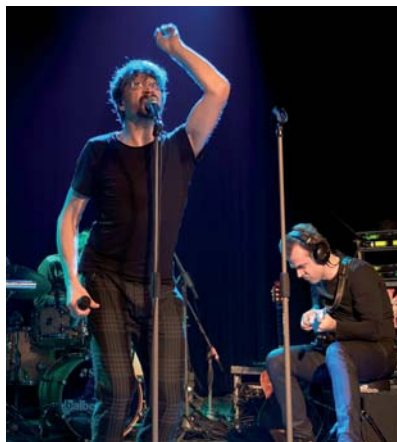
Hudba pomáhá (5. 12.).