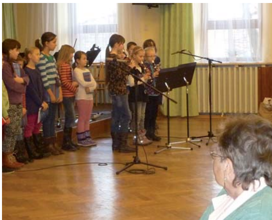
Beseda se seniory (4. 12.).