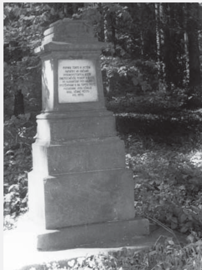
Pomník zemřelým pod Hájký, foto Jan Popelka, 1960, ze sbírek RMVM.

Lesů či alespoň částečně zalesněných míst s názvem Hájky, Hájek apod. se v Čechách nalézá mnoho. Jedno z nich nalezneme jihozápadně od Vysokého Mýta směrem k vesnici Knířov. Projdeme mezi poli po staré poutní cestě, nedávno znovu osázené lipovým stromoradiím, a brzy se nám naskytne pohled na starodávnou věž knířovského kostela Zvěstování Páně. Pokud bychom měli štěstí a bylo by možné do kostela nahlédnout, spatřili bychom barokní oltář s obrazem Panny Marie Knířovské. K této světici směřovaly prosby obyvatel Vysokomýtska při epidemiích moru v první polovině 18. století a sám kostel se měl stát útočištěm věřících, kteří zde hledali spásu před poslední hrozcí vlnou této nemoci v roce 1730. Morové rány, které Evropu pustošily od 14. století, se české kotlině z těžko vysvětlitelných příčin dlouho vyhýbaly. Řádily po celém kontinentě od Apenin po Skandinávii, neminuly dokonce ani severské osady v Grónsku či na Islandu. Částečně zasáhly i Moravu, ale vlast-