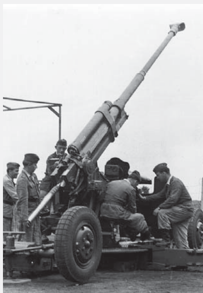
Protiletadlový kanón 85 mm PLK vz. 44S, kterým byli vyzbrojeni vojáci 251. pluku PVOS ve Vysokém Mýtě.