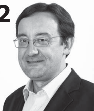
Novoroční přání starosty města