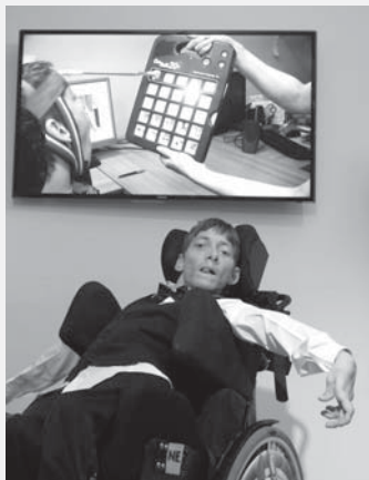
Velký zájem v loňském roce vzbudily obrazy T. Rybičky.

Enormní zájem o letošní výstavu betlémů v Turistickém informačním centru (ta potrvá do 22. ledna) naznačuje, že se tento historický prostor v budově staré radnice stal oblíbenou zastávkou pro rodiny, školy i návštěvníky Vysokého Mýta. Proto se i v roce 2017 připravuje představení celkem osmi různých expozic. Kromě betlémářských zastavení na začátku a na konci roku se zde objeví rozličná témata. V lednu si 120. výročí svého vzniku připomene Střední stavební škola výstavou Přehrady jako odkaz kulturního dědictví