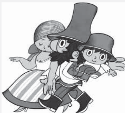
V létě vás čeká výstava Radek Pilař dětem aneb Rumcajs slaví padesátiny .