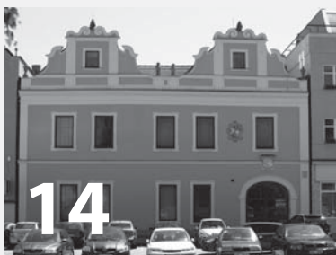
Činnost Městského úřadu v číslech