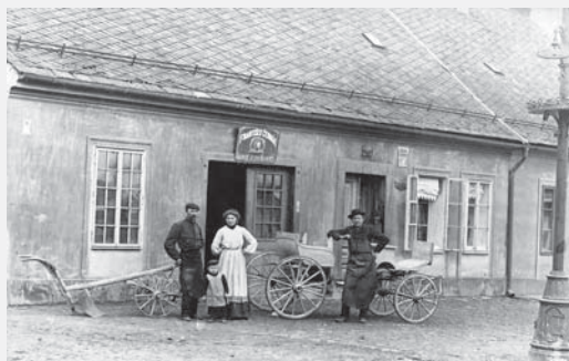
Kovárna Františka Čermáka v dnešní ulici Kpt. Poplera ve Vysokém Mýtě (proti Panskému mlýnu), nyní obytný objekt. 1908.

Nepatrně odbočme a připomeňme si, že termínem kovárna ve většině případů myslíme pouze vlastní kovářskou dílnu, tedy prostor, v němž kovář vykonává většinu práce, a nemusíme si tak ani uvědomit, že kovárnou je celý objekt např. v podobě vesnického trojdílného domu včetně světnice a síně. V kovářské dílně nesmí chybět výheň, měch (s ruční či nožní obsluhou), kovadlina a již zmíněné ruční nářadí.