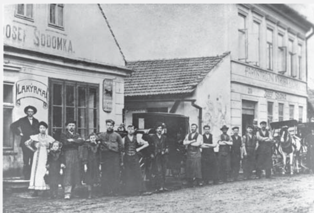
Karosárna před rokem 1914.