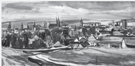
Pohled Vysoké Mýto

Jeho ryze krajinářské dílo vycházelo na počátku 30. let z mařákovských tradic, ale i později, po odchodu od oleje a příklonu k temperě, zůstal věrný krajinářství. Naprostá většina krajinářského odkazu Jana Jušky vznikla ve Vysokém Mýtě a jeho okolí. Jeho dílo tedy patří k nejvzácnějším ikonografickým plodům výtvarného života našeho města.