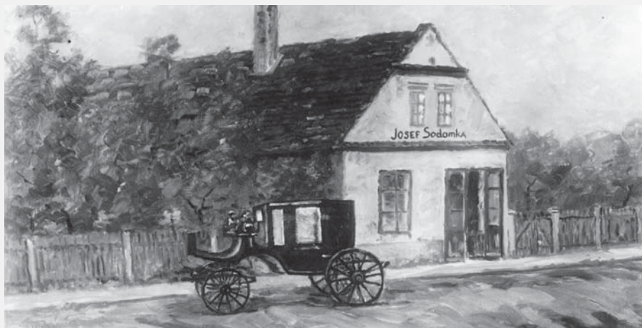
První objekt firmy Sodomka.