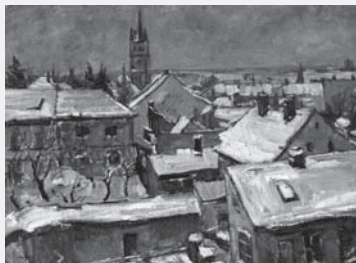
Vysoké Mýto v zimě