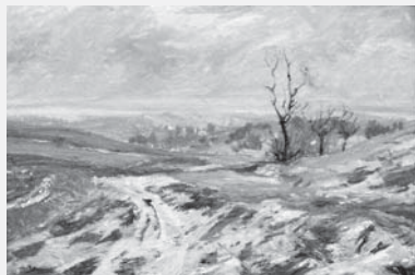
Zimní krajina na Vysokomýtsku