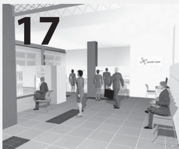
Nové clientské centrum MěÚ