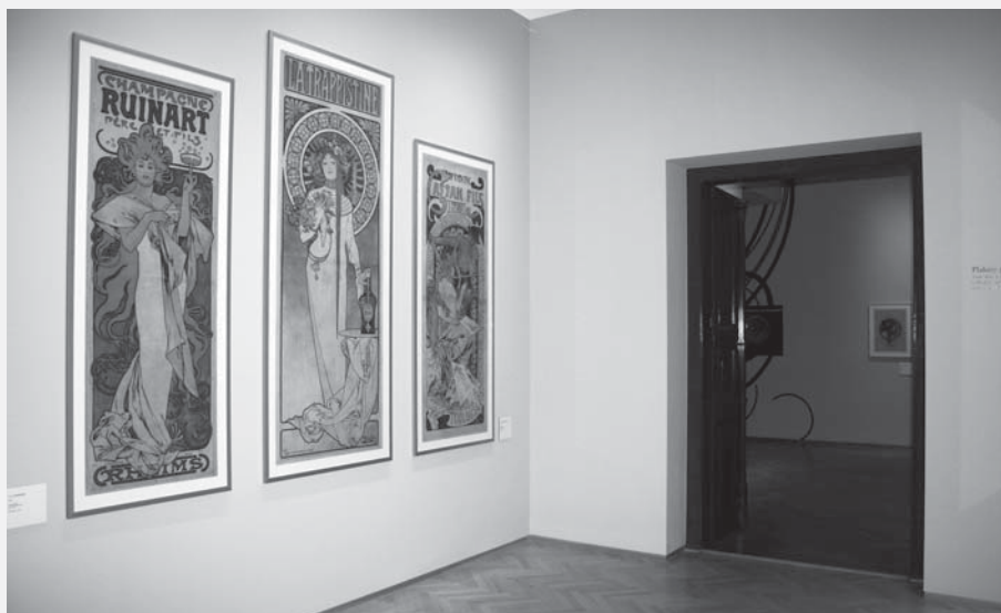
Stálá expozice „Alfons Mucha - Plakáty“ v Regionálním muzeu v Chrudimi.

Ihned za úvodní stěnou je připravena působivá prezentace souboru divadelních plakátů. V malém prostoru diváka naplno atakuje červená barva zdi a nadživotní postava Sarah Bernhardtové. Tento výrazný moment opět střídá klidná řada grafických listů a dekorativních panó. V druhé místnosti je představena kolekce Muchových plakátů pro propagaci a výstavu zakončují kalendária. Mezi nimi je zrcadlově s dispozičním řešením první místnosti vložen další, tentokrát černý, prostor, ve kterém na zájemce čeká krátký dokumentární film o cestě Alfonse Muchy od postavy módního pařížského malíře k tvůrci Slovanské epopeje. Architektonický návrh expozice, respektující nejmodernější požadavky na prezentaci vzácných uměleckých prací na papíře, obsahuje několik zajímavých výtvarných detailů, které propůjčují novému prostoru příjemnou atmosféru. Mezi vizuálně nejnapadnější patří již dříve zmíněné barevné řešení prostoru v souzvuku béžových, červených a černých barevných tónů, které navíc podtrhuje motiv jemných vlnek, odvolávajících se na