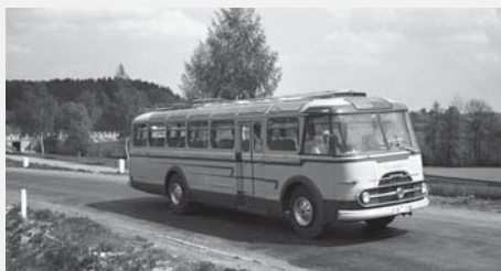
Zájezdový autokar, vyrobený v roce 1955 pro ZV ROH v Karose.