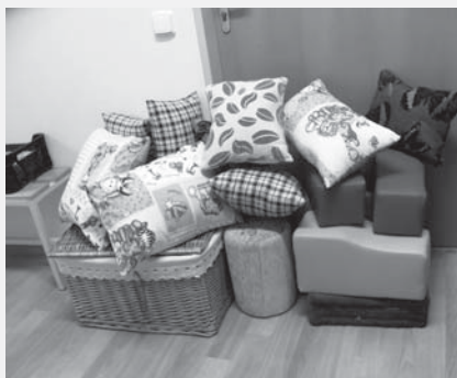
Některé hotové výrobky.

kde se seznámily s prostředím obou zařízení a poznaly ty, pro které budou pomůcky potřebné. V rámci praktického vyučování postupně začaly jednotlivé pomůcky vyrábět. Žákyně vymýšlely na atypické tvary jednotlivých pomůcek technologické postupy, vytvářely různé šablony pro nástřih potahových látek.