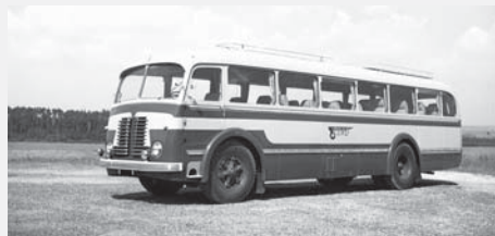
Dálkový autokar Škoda 706 RO z roku 1955.

Autobusy Škoda 706 RO se vyráběly ve třech základních variantách: pro přepravu cestujících ve městech v provedení městském, pro přepravu cestujících na kratší a střední vzdálenosti v provedení linkovém a pro delší vzdálenosti a zájezdy v provedení dálkovém (LUX). Městské autobusy měly nejprve dvoje čtyřkřídlové, později dvoukřídlové elektropneumatically ovládané dveře. Zadní dveře sloužily pro nástup cestujících a přední, umístěné za přední nápravou, pro výstup. Před vstupními dveřmi bylo sedadlo pro průvodčího. Za řidičem byla částečně zasklená mezistěna. Nejstarší vozy měly uzavřenou kabinku, která zcela oddělovala řidiče od cestujících. První městské autobusy měly podélně uspořádaná sedadla, další je měly umístěné příčně v počtu 2+1, přičemž dvojmístné byly většinou na pravé straně. Celková obsaditelnost byla 72 osob, z toho 23 míst bylo k sezení a 49 k stání. Linkové autobusy měly jediné dveře, které byly ovládané elektropneumatically řidičem. Byly