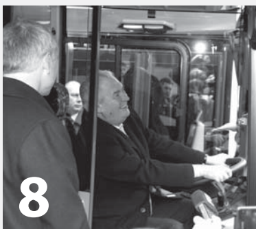
Prezident na návštěvě...