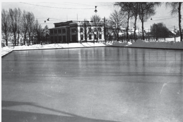
Pohled na vysokomýtské kluziště na tenisových kurtech u elektrárny, na obrázku je patrné osvětlení posuvnými žárovkovými lampami, v pozadí dodnes stojící budova rozvodny, 1938.