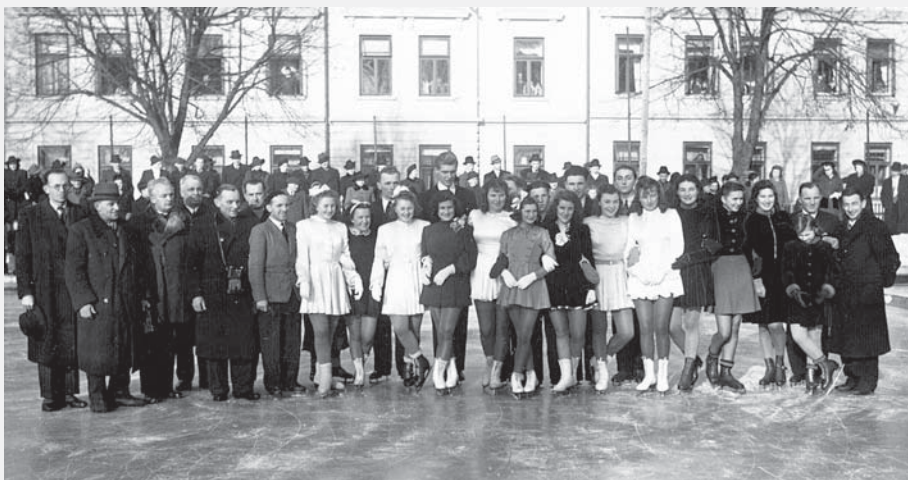
IV. přebor bruslařské východočeské župy v Chocni, 31. leden 1943.

lení, zvláště koncem 30. let a v době okupace, kdy byla zavřena pražská Štvanice a mnohé bruslařské akce byly místo toho pořádány právě ve Vysokém Mýtě.