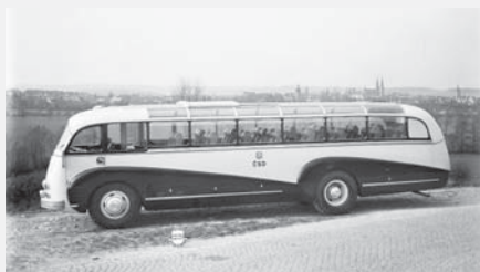
Luxusní autokar Škoda 706 RO Pullman, z roku 1947 s originální karosérií i výbavou.