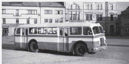
Autobus Škoda 706 RO v městském provedení pro export.