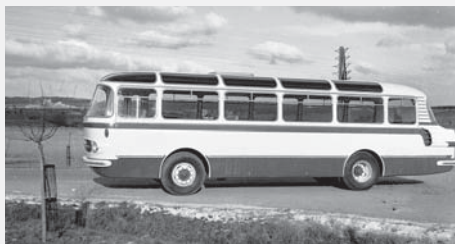
Druhý prototyp autobusu Karosa SB II v linkovém provedení.

Vývoj středních autobusů se samonosnou karosérií pokračoval v Karose i po ukončení výroby horských autobusů T 500 HB. Další etapou vývoje se měly stát autobusy označované SB (střední bus) v délce necelých deseti metrů. Po zkušenostech s horskými autobusy měly být pouze dvounápravové, se vzduchem chlazeným šestiválcovým motorem Tatra 926 V uloženým vzadu a pneumaticky ovládanou šestistupňovou převodovkou T 501. Oba agregáty byly vyvíjeny v n. p. Tatra přímo pro autobusy. Střední autobusy SB se měly stát součástí jednotné typové řady autobusů Karosa s maximálním možným počtem stejných,