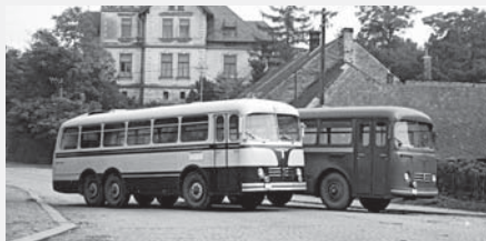
Dvě varianty olakování horských autobusů v sériové výrobě.