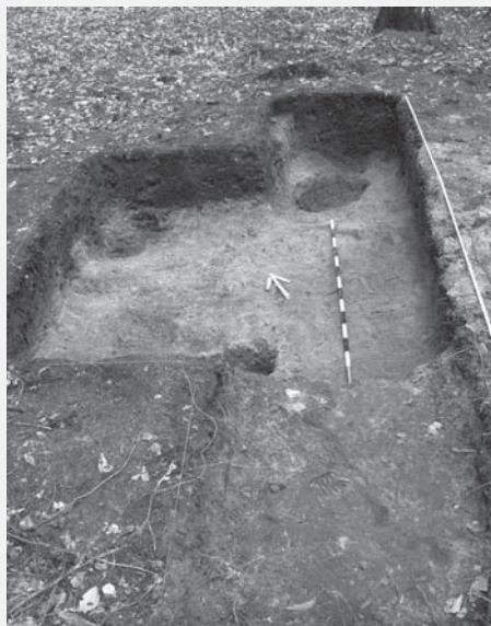
Pohled do archeologického nálezu v lokalitě Hlavačov.

Dále po proudu Tiché Orlice, opět vysoko nad jejím tokem, se setkáváme s hradem Hlavačov. Také v jeho pojmenování se odráží jméno novověkých vlastníků pozemků, dobový název hradu se nedochoval a bez problémů není ani jeho datování. Podle archeologických nálezů jednoznačně vzniká ve 13. století, kdy bylo osídleno i jeho širší (neopevněné?) předpolí. O okolnostech vzniku hradu se můžeme pouze dohadovat, z písemných pramenů víme, že v okolí Chocně král Václav II. chtěl zbudovat hrad, aniž by písemné prameny prozradily, zda k tomu skutečně došlo. Někteří badatelé předpokládají zánik hradu v souvislosti s vojenskou akcí Karla IV., který ve svém životopise Vita Caroli píše o dobytí hradu Chocně v r. 1338. Archeologické nálezy (na rozdíl od Zítkova) dobytí hradu nesignalizují (ovšem mohlo jít o rychlý přepad, který nezanechal stopy v archeologických pramenech), některé