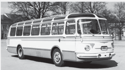
Prototyp dálkového autobusu SB IV LUX.