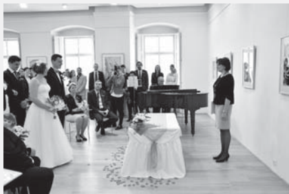
Svě „ano“ si řekli v Muzeu českého karosářství první snoubenci.

Druhá svatba na sebe nenechala dlouho čekat, uskutečnila se hned následující týden, v sobotu 21. února. Těšíme se na další svatební setkání v muzeu či galerii. Konání svatby v našich prostorách je nutné vždy předem domluvit v muzeu a na matrice. (kov)