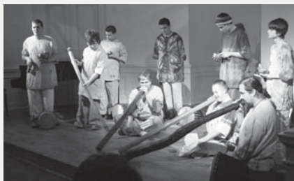
Děti ze stacionáře Svítání.

Ve čtvrtek 22. ledna proběhl v sále ZUŠ již šestý ročník tradiční akce s názvem Vysokomýtské souznění, které pořádá Základní škola a Praktická škola SVÍTÁNÍ, o. p. s. ve spolupráci s Centrem sociálních služeb Berenika - Vysoké Mýto, o. p. s a Základní uměleckou školou Vysoké Mýto. Děti se zdravotním postižením společně s žáky naší ZUŠ během tohoto vystoupení vytvořili úžasnou atmosféru plnou dobré nálady a radosti ze života.