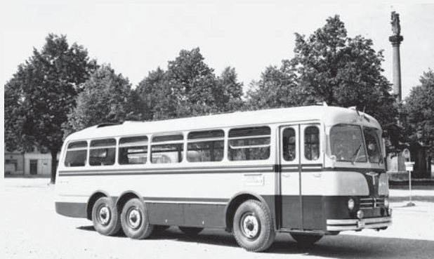
Horský autobus Karosa T 500 HB.