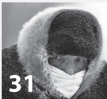
Další semestr University volného času začíná