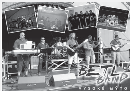
Betl Band oslavil loni v červnu dvacáté narozeniny.