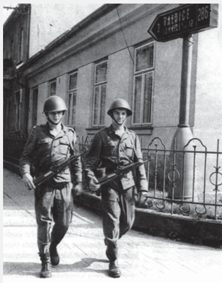
Polští vojáci v Jičíně, září 1968, foto in Zahradníček, Tomáš, Zvláštní výprava na jih, Dějiny a současnost 1/2008.

Českoslovenští vojáci se po několik dní nacházeli ve značně stresové situaci. Až do stažení polských sil do polního tábora 26. srpna na ně mířily těžké zbraně. Odpovědnost důstojníků s ohledem na možnost propuknutí závažných incidentů byla vysoká, přesné pokyny neměli a situace, ve kterých se ocitli, byly často nenadálé a nepředvídatelné. Velmi se lišilo chování okupačních vojáků. Někteří sovětsí a polští velitelé jednali poměrně korektně, leckdy i s určitým pochopením, jiní se s chutí oháněli zbraněmi, často se uchýlovali k nátlaku a otevřenému vyhrožování. Úsměvný popis nátlakové situace lze číst v kronice Zdechovic, kde pozdějším přeškrtnutím slov okupace-okupační na pomoc-spojenecký vzniklo toto: „Velitelé okupačních spojeneckých vojsk nařizují stále represálie. Zpráva z rozhlasu 26. 8. 68: městu Habartov hrozí sovětský důstojník, že město srovná se zemí... televizní vysílačka Severní Čechy okupačními spojeneckými vojsky rozstřílena – škoda podle odborníků činí 75 milionů Kčs.“ V okolí došlo k nejdramatičtější situaci u vysílače Pohodlí u Litomyšle, kde se polští výsadkáři při pokusu o přerušení vysílání dopustili násilí na vojácích základní