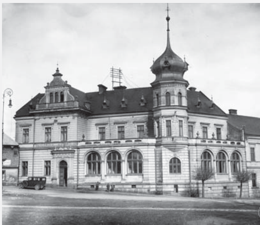
Svoji činnost zahájila galerie na podzim 1957 v bývalém vojenském kasinu (dnes ZUŠ).