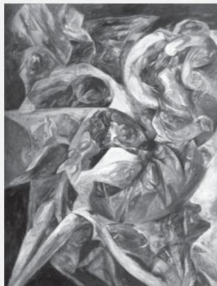
Jaroslav Klát mladší: Zátíší u vodopádu .