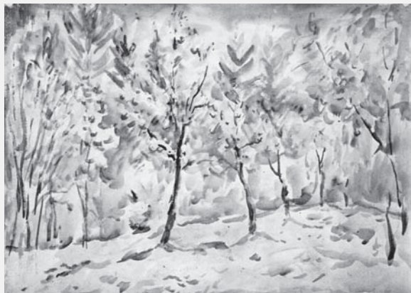
Jaroslav Klát starší: Z cyklu Podzim na Božím Daru , akvarel.