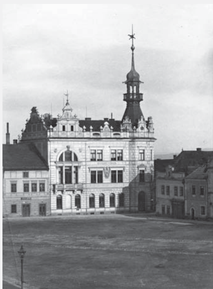
Na čtyři dekády se domovem galerie stala stará pošta.

Po privatizaci staré pošty bylo město nuceno hledat pro galerii nové místo. Kvalitní zázemí pro svoji sbírku získala galerie v září 2014,