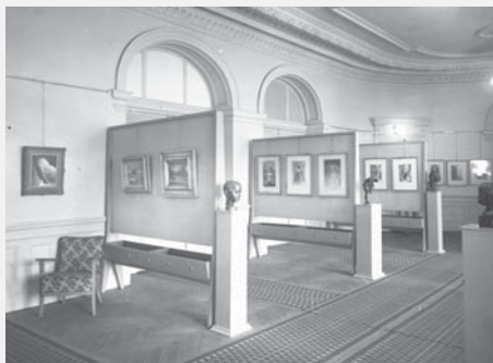
Výstavy se v kasinu konaly pouze 13 let.

Štukou vyzdobený reprezentativní sál však sloužil k pořádání výstav pouze do roku 1970, kdy bylo nařízeno budovu kasina vyklidit. Poslední expozice výtvarného umění zde byla k vidění na jaře 1970, kdy si návštěvníci prohlédli 66 sochařských kreseb a pastelů od rumunského výtvarníka George Aposta. Po té galerii přišla nejen o výstavní prostory, ale i o celé své zázemí. „Celá sbírka a výstavní vybavení bylo vykázáno do prostor staré budovy