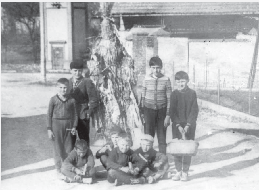
Velikonoční obchůzka s Jidášem, Pustina, 60. léta 20. století, autor neznámý

V několika obcích kolem Vysokého Mýta, Luže a Chroustovic se dodnes zachoval krásný velikonoční zvyk. Od Zeleného čtvrtka – kdy zvony podle tradice utichnou a odletí do Říma – se brzy ráno, v poledne a večer rozléhá vsí rytmické klapání. Chlapci z vesnice s klapači (dřevěný nástroj k vyluzování klapavého nebo vrčivého zvuku – to podle konstrukce) prochází kolem domů ve spořádaném dvojstupu. Naposledy projdou celou vesnicí ještě na Bílou sobotu ráno. Pak se ale musí, většinou za pomoci dospělých, připravit na zakončení této obchůzky. Jeden z nich (často ten nejstarší) je vpraven do těžké a nepohodlné masky, která má představovat proradného Jidáše. Nohy, ruce a hrudník mu omotají provazy ze slámy nebo sena, do ruky dostane prut a na hlavu dlouhou špičatou čepici – ta zakrývá obličej, a pokud ne, tak je obličej začerněn. V čele průvodu pak pomocníci Jidáše vedou za doprovodu hrkáčů a nosičů koledy celou vsí. U každého domu se zastaví, recitují text koledy a vše doprovází ohlušující zvuk hrkáčů a klapáčů. Koleda se skládá nejčastěji z vajíček