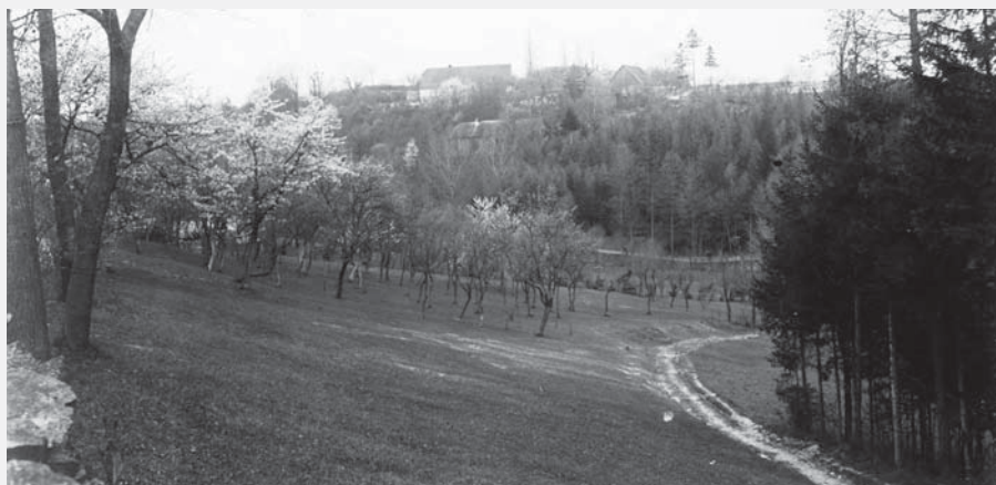
Pohled na část vsi Javorník (u Vysokého Mýta). V popředí sad, v pozadí mezi vzrostlou zelení je vidět několik domů a usedlostí, 1912.

A přišlo se na to tak: V tmavé noci před dávnými časy přišel k jezeru letním parnem unavený dráteník, který nemoha odolati lákavé svěží trávě kol jezera bující, svlékl halenu, pověsil ji na starou vrbu, která nad jezero se nakláněla, natáhl zmožené údy nedaleko na břehu a tvrdě usnul. Když dosti vysoko již stojící slunko osvěženého spáče probudilo, chystal se dále do světa, aby sobě a milým svým na chudé Slovači chleba na zimu opatřil. Jaké bylo však jeho leknutí, když přišel k vrbě, na kterou halenu svoji pověsil, halena byla pryč. Chvilí ještě hledal, pak však pobručel si na lidskou „pochtivost“, bral se dále. Po čase dostal se až k matičce Praze a tu v jedné vesnici slyšel vypravovat, jakých škod v okolí kroupy nadělaly a že s nešťastnými kroupami spadla také drátenická halena, která jest u rychtáře uložena. Již zamířil dráteník k rychtáři a zůstal jako omráčený, když v haleně poznal halenu svoji, záhadně zmizelou. Vypravoval vesničanům, jak se mu ztratila, a když se zase vrátil k Javorníčku, vypravoval po celém okolí o kroupách u Prahy spadlých, a jak tu s nimi spadla jeho halena, která na vrbě u jezera visela. Nebylo pochyby, že kroupy se utvořily v jezeře, a slunce