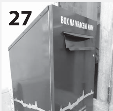
Bibliobox slouží nově čtenářům