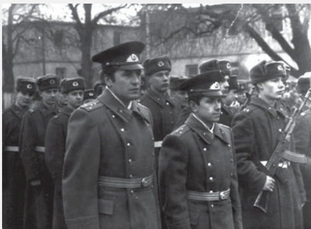
Sověští vojáci v prostoru kasáren na dnešním Masarykově náměstí („u Alberta“), 80. léta.

Zdeněk Horák, Regionální muzeum ve Vysokém Mýtě