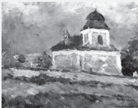
První obraz zapsaný do sbírek Městské galerie Vysoké Mýto. Antonín Slaviček. Kostelík v Kameničkách . Olej, plátno, 44 x 51 cm.