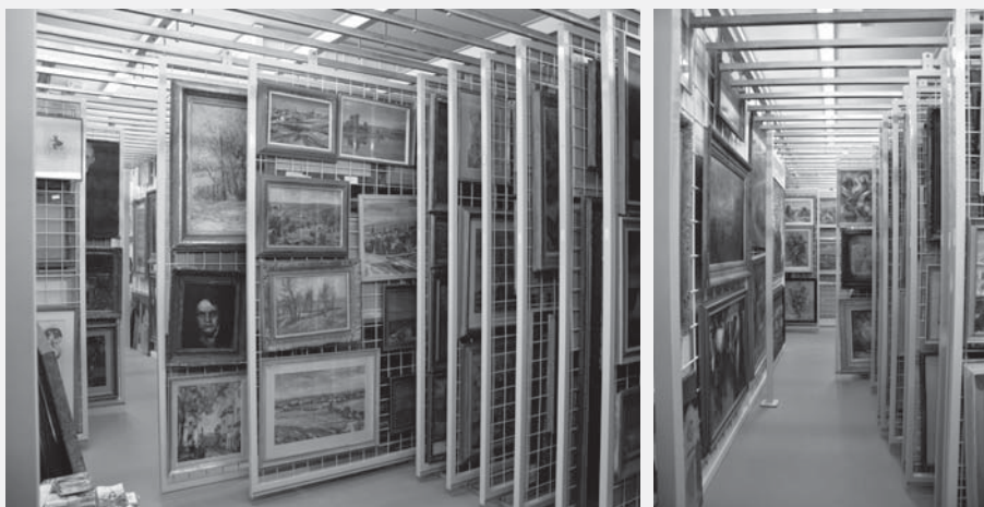
Pohledy do nového depozitáře v budově bývalého okresního soudu na náměstí.