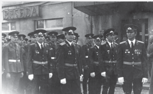
Skupina sovětských důstojníků před restaurací Beseda, 80. léta.

Po sérii jednání došlo k uzavření dohod se Sovětským svazem, které tato mocnost pokládala za momentálně uspokojivé. Mohlo tak dojít k postupnému stahování bojových okupačních armád a formálnímu ukončení celé operace Dunaj, které bylo vyhlášeno 15. listopadu 1968. Mobilizované síly nahradily stálé posádky s běžným mírovým režimem,