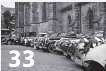
Součástí Sodomkova Vysokého Mýta je Den otevřených dveří firmy Iveco Czech Republic, a. s.