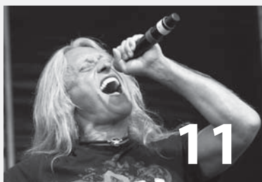
Kulturní léto na náměstí a v Amfiteátru