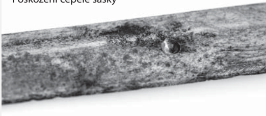
Poškození čepele šašky