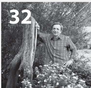
Městská galerie - rozhovory