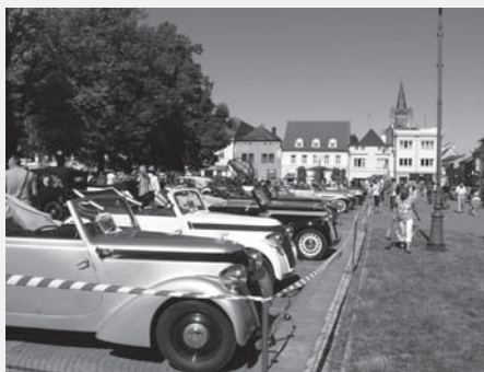
7. června 2014 zaplnily automobily s karoserií Sodomka vysokomýtské náměstí.