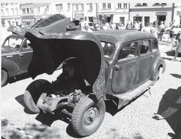
Tatra 52 z roku 1939 v nálezovém stavu.