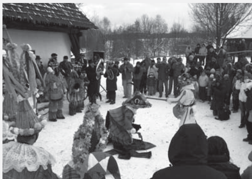
Závěr pochůzky masopustních mášek na Veselém Kopci.

Veselý Kopec se svým charakterem nabízí k pořádání národopisných akcí, čehož Soubor lidových staveb Vysočina velmi dobře využívá. Vedle vánočních a velikonočních akcí či ukázek pracovních činností patří k nejatraktivnějším pochůzka masopustních masek,