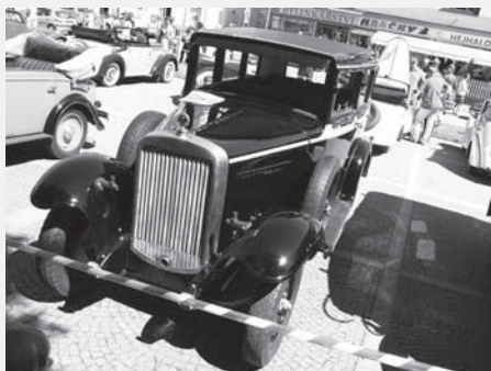
Automobil Walter 4B před dokončením náročné renovace.