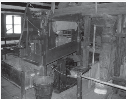
Interiér mlýnice ve mlýně přeneseném z Oldřetic. Vysévací část před mlýnskou hranicí a vpravo část tyčové stoupy na výrobu krup. Foto: Radim Urbánek, 2013.

Zapomenout nesmíme na vědeckou rekonstrukci záhřivky z Přívratu, která je jediným objektem svého druhu v Čechách, přestože v minulosti jich jen v jediné vesnici