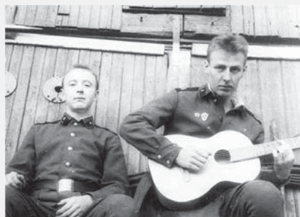
Sovětsští vojáci ve Vysokém Mýtě koncem 80. let, snímky z ruského webu.