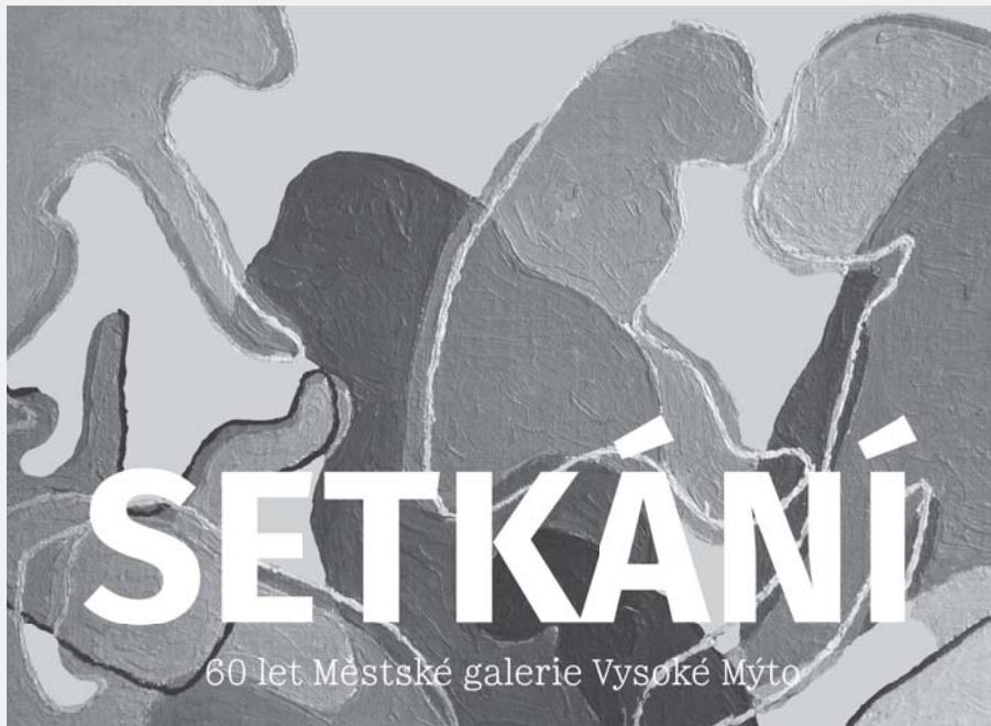
Titulní strana knihy Setkání.

V tom, že chtějí vydat knihu, měli pracovníci galerie jasno hned od počátku, kdy se před rokem pustili do příprav letošních narozeninových oslav. Knihu ano, ale o čem vlastně? O historii? O té již bylo mnohé napsáno v bulletinech, které galerie vydala u příležitosti svých desátých, dvacátých a čtyřicátých narozenin. A my přece nechceme připomínat pouze historii, ale také současné dění! Tak tedy představit sbírku? To však bude zajímat pouze úzký okruh čtenářů... Chce to něco čtivého – nejlepší je vždy skutečný příběh. Musíme najít pamětníky, kteří nám přiblíží historii galerie jinak než v pouhých datech a archivních dokumentech! Nejlépe příbuzné zakladatelů galerie. Seznam těch, kdo stáli u jejího zrodu, byl jasný. Naši předchůdci byli v archivaci poctiví. Ale žijí ještě jejich manželky, děti, vnuci?