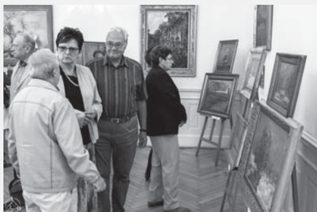
Výstavou Setkání v kasinu se galerie vrátila do míst, kde před šedesáti lety zahájila svoji výstavní činnost.

Závěrečnou akcí pro veřejnost je MEJTO GRAFFITI JAM . Ten se koná v sobotu 30. září a vy se můžete přidat! Přijďte od 10 do 18 hodin sprejovat do zdejších podchodů, které se tak stanou uměleckým dílem. Malovat budou i dvě desítky zkušených graffití umělců z celé republiky.