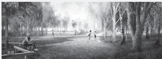
Návrh architekta Jakuba Meda a Johany Šimčíkové