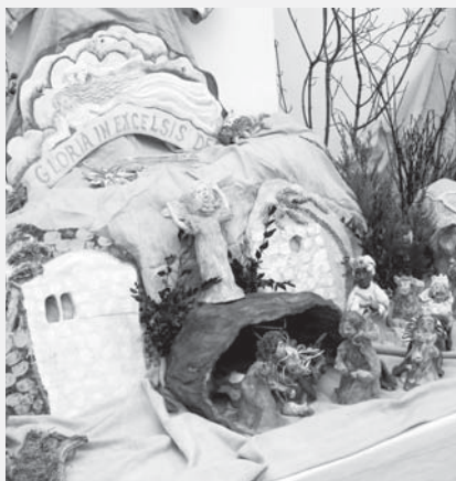
Tento betlém pochází z dílny Ireny Švecové.

Turistické informační centrum láká i na konci roku k návštěvě nejen místní, ale také turisty. Ti si můžou prohlédnout volně přístupnou výstavu betlémů, na které se tentokrát představí kousky, o které pečuje muzeum v Třebechovicích pod Orebem. Ty vystřídaly kolekci obrazů handicapovaného autora Tomáše Rybičky. Na jeho výstavě - podobně jako na betlémů je vstupné dobrovolné - se vybralo 2 700 korun, které už byly předány Domovu pod hradem Žampach, kde Tomáš Rybička tráví většinu svého života. (ny)