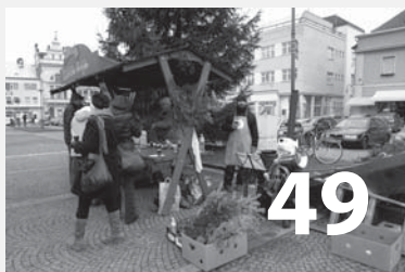
Medovina pod vánočním stromem