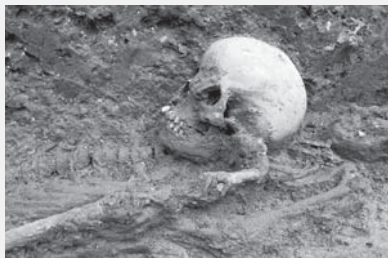
Sonda č. 1, detail hrobu 17/2016.