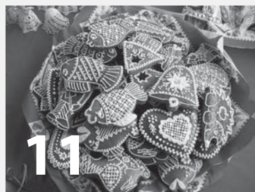
Farmářské trhy pokračují i v adventním čase