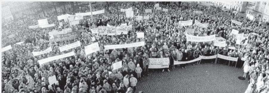
Demonstrace ve Vysokém Mýtě, 1990.

Zdeněk Horák, Regionální muzeum ve Vysokém Mýtě