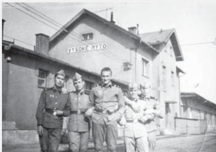
Na vysokomýtském nádraží, 1990.