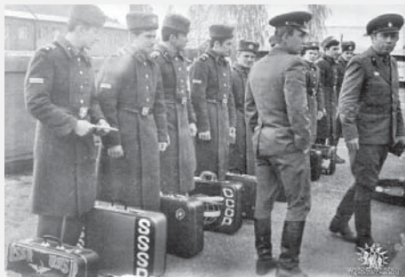
Příprava k odjezdu.

Stejně jako o umístění, i o stažení vojsk se však rozhodovalo jinde. Prohlášení o protiprávnosti srpnové okupace urychleně přijala ještě Adamcova vláda 4. prosince 1989, zároveň se však snažila proces odchodu interpretovat jako součást odzbrojovacího procesu, vycházejícího z jednání mezi SSSR a USA. Je úsměvné, že zatímco účastníci operace Dunaj, tj. Polsko a Maďarsko, se za invazi omluvili již před několika měsíci a dokonce i Sovětský svaz ústy Gorbačova prošel významným posunem, Československo jako oběť i nadále vydávalo sovětské vojáky na svém území za součást vlastní obranné doktríny. Situaci změnila až nová vláda M. Čalfy. Jednání se Sověty probíhala od ledna 1990. Sovětský svaz se stažením souhlasil, avšak požadoval lhůtu do pěti let. Situace byla pro něj velmi komplikovaná, na jeho území se vracely statisíce vojáků z NDR, Polska, Maďarska, Afghánistánu atd. a Gorbačov, zápasící o reformy, se obával totálního rozpadu včetně