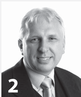
Novoroční přání starosty města