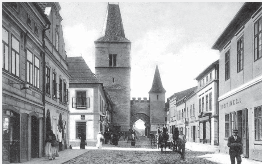
Pohled do dvou ulic ze stejného místa: nahoře Tůmova ulice - vpravo oblíbená Dittrichova hospoda, za níž proslulé lahůdkářství U Žižků. Dole Foerstrova (tehdy Děkanská) ulice: vpravo boční fasáda Dittrichovy hospody, vlevo vstup do Žižkovy vinárny.