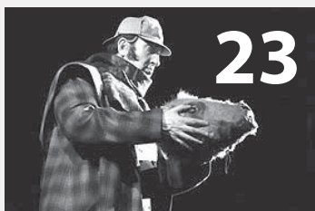
Informace o divadelním předplatném