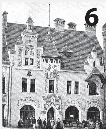
Nové téma Vitrianky: vysokomýtské hospody