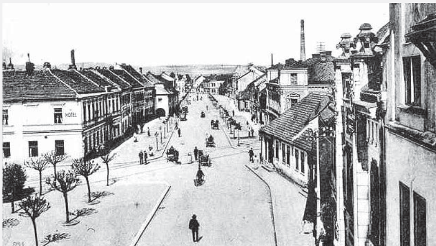
Pohled z Pražské věže na Pražské předměstí roku 1920: vlevo hostinec U Zlaté hvězdy (později Kobylka) v pozadí s podlouhým hostincem U Bílého beránka, zcela vpravo fasáda hostince Na Střelnici.

S přáním dobrého čtení a dobré chuti po celý rok Pavel Chalupa