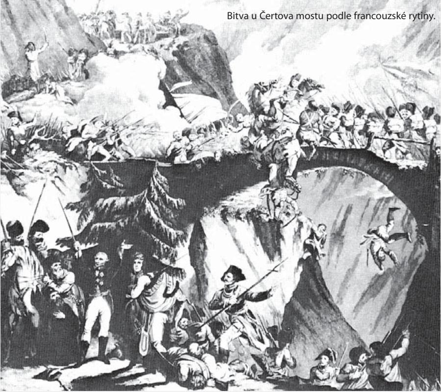
Bitva u Čertova mostu podle francouzské rytiny.

Vyčerpaní a vyhladovělí, po 60 hodinách nepřetržitého horského pochodu stáli bez větších děl, zásob, dostatku munice a koní proti 60 000 Francouzů. A zbytečně. Korsakovův sbor nezachránili, Švýcarsko bylo ztraceno a na tažení do Francie nebylo možné dál pomýšlet. Na válečné poradě 30. září měl Suvorov nad mapou k těžké situaci říci toto: „Francouzi jsou v těchto místech. Rozdrtíme je a potáhneme ke Glaurusu. Jsme Rusové.“ Tvrdými údery zatlačil Massénu k Swyzu a proklouzl okolo Glaurusu k údolí Rýna. Švýcarská kampaň sedmdesátiletého Suvorova vyčerpala. Neprohrál jedinou bitvu, ale křížové tažení proti francouzské republice zcela ztroskotalo. Do Ruska se vracel přes Čechy. V listopadu navštívil divadelní představení v Praze, po další cestě se mu výrazně přitížilo. Když 1. února 1800 nocoval ve Vysokém Mýtě, byl už jeho stav vážný. Car Pavel I., který ho 28. října jmenoval generalissimem, se na něj z nějaké těžko pochopitelné příčiny ještě stihl rozhněvat, bylo zrušeno velkolepé přivítání a car sotva vnímajícímu Suvorovovi vzkázal, že jeho přítomnost u dvora je nežádoucí. Zemřel 14. května a jeho pohřbu se zúčastnila jediná výše postavená osobnost - britský diplomat. Náhrobek nikdy neporaženého generála zdobí jen strohý nápis „Zde leží Suvorov“.