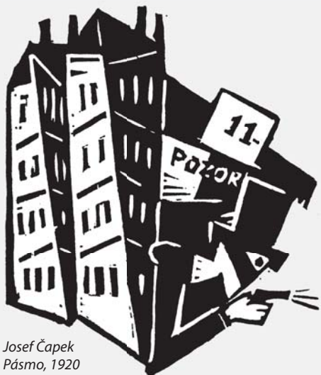
Josef Čapek Pásmo , 1920