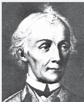
A. V. Suvorov na rytině N. I. Utkina

terénu za každého počasí. Důstojníci a poddůstojníci byli vedeni k samostatnému uvažování, nesměli zanedbávat průzkum a namísto složitých plánů a manévrů měli zvládat pružnou improvizaci v konkrétních situacích. Ruští vojáci se nebáli prudkých ztečí s bajonety či tvrdých bojů chladnými zbraněmi a maršál své muže dobře znal. Uměl využít vlastností ruského mužika i divokých kozáků, pamatoval si jejich jména, dbal na jejich potřeby, stravu a žold a byl svými muži zbožňován.