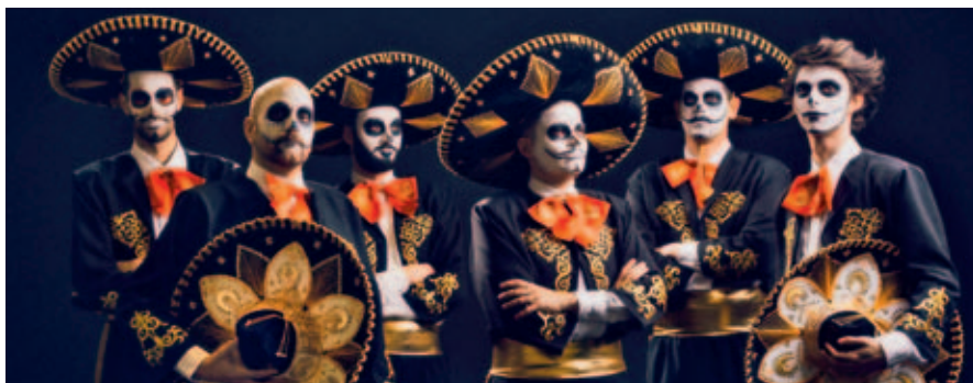
Členové Fast Food Orchestra si srdce fanoušků získali především díky pozitivní energii, tanečním rytům a interaktivní show.

Vstupné v předprodeji 350 / 400 Kč v den konání.