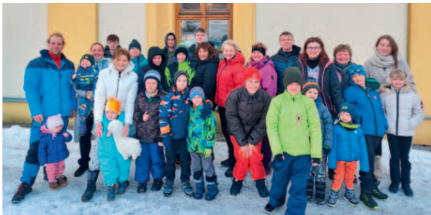
Mikádo připravilo o jarních prázdninách pobyt na horách.

mohli zúčastnit příměstského tábora, který nabídl pestrý program plný her a výletů. Laser game, bazén, bowling nebo hradeckou jump arénu si s Mikádem užilo na padesát vysokomýtských školáků. Obě akce přinesly dětem spoustu zážitků, nových přátelství a radosti z pohybu. Mikádo opět ukázalo, že prázdniny nemusí být nudné. Filip Krejza, Mikádo