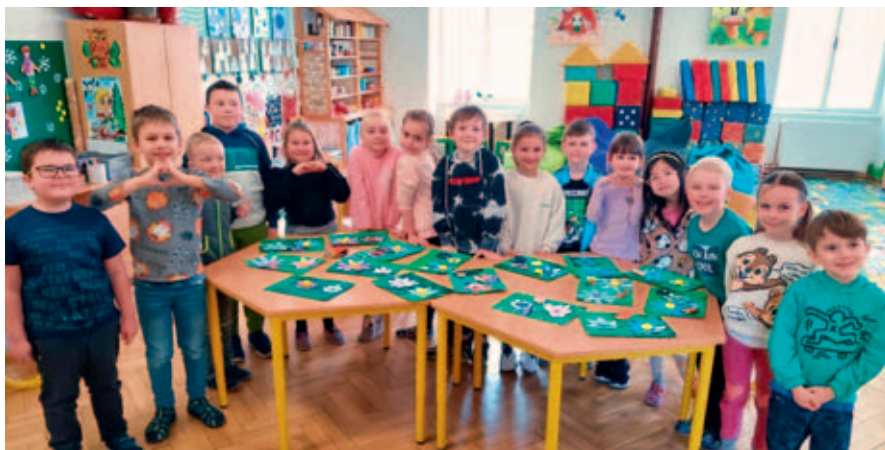
V knihovně své výtvary představí děti ze ZŠ Javornického.

Jarní výstava potěší nejen milovníky umění, ale i všechny, kteří mají zájem o dění na Základní škole Javornického.