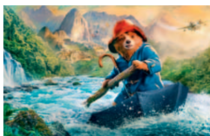
Paddington v džungli