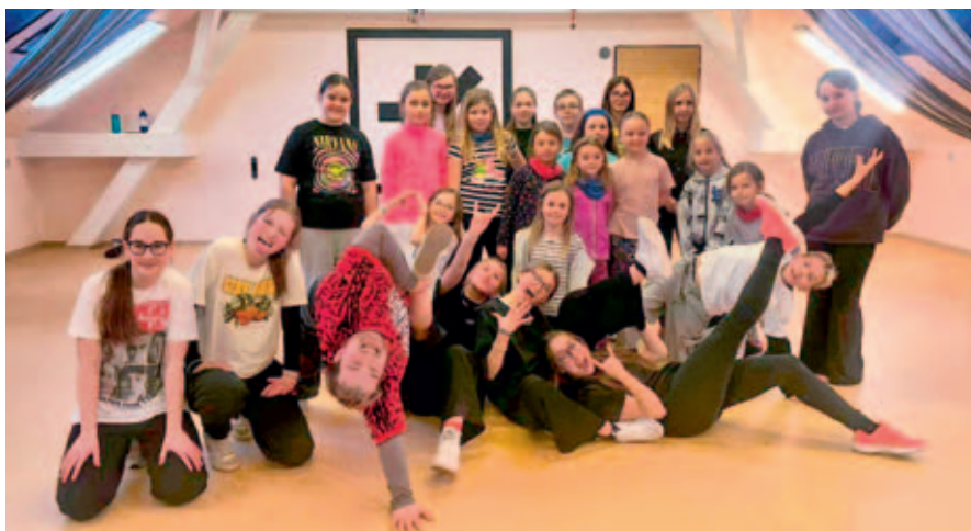
Noc a den strávily děti o pololetních prázdninách v Mikádu.

hudby, tance a zábavy zakončený tanečním battlem (bezkontaktní taneční souboj, pozn. redakce). V pátečním programu se našel prostor i pro vlastní kreativní tvoření. Děti si odnesly nejen krásné vzpomínky, ale i nové přátelství a zážitky, které jim budou ještě dlouho dělat radost. Už teď se těšíme na další ročník! Filip Krejza, Mikádo