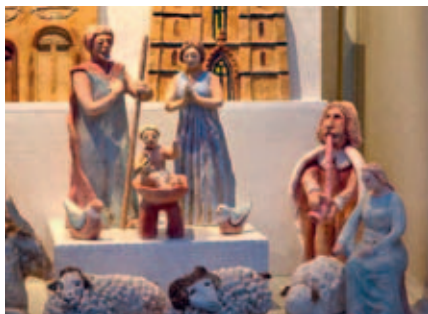
Vysokomýtský betlém se rozroste o postavy z prostředí divadla.

Spolek variace vm se připojí k oslavám 200 let ochotnického divadla ve Vysokém Mýtě po svém. Jistě si vzpomenete na vysokomýtský keramický betlém, který s naší malou dopomocí vytvořili naši spoluobčané na společných dílnách. Poprvé byl vystavený v oknech Turistického informačního centra ve vánočním čase v roce 2020 a shledal se s velkým ohlasem a radostí tvůrců. V dalších letech o jeho vystavení projevíli zájem například v kostele ve Džbánově nebo v Hrochově Týnci. A tak se zrodil nápad: k betlémským keramickým darovníkům připojit další figury, tentokrát z prostředí divadla – známé