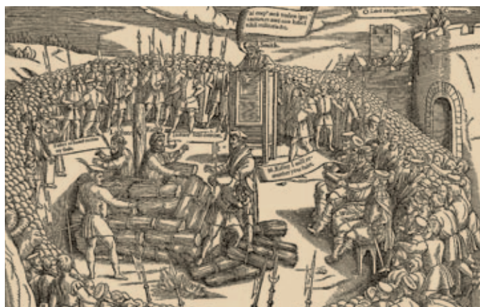
Upálení Latimera a Ridleyho z Knihy mučedníků od Johna Foxe (1563).

Psal se rok 1553. V Anglii probíhal boj o smysl života – boj mezi protestantismem a katolicismem.