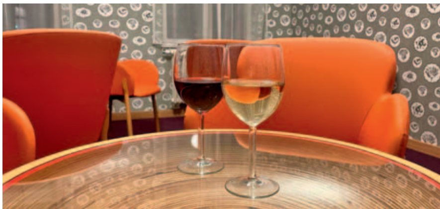
Divadelní kiosek nabízí novou službu předobjednání občerstvení na přestávku.

V nové sezóně se i nadále můžete těšit na oblíbenou službu, kterou je předobjednávka na přestávku.