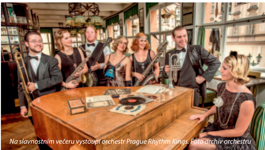
Na slavnostním večeru vystoupí orchestr Prague Rhythm Kings.