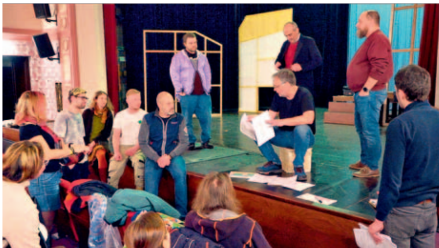
Jedním z vrcholů celoročních divadelních oslav bude představení Poprask na laguně . Video Radek Štěpán

V letošním roce si Vysoké Mýto připomíná 200 let od uvedení první divadelní hry vysokomýtskými ochotníky v českém jazyce a 100 let od otevření Šemberova divadla. Oslavy probíhají po celý rok, ale jistě jedním z vrcholů budou březnová představení slavné Goldonihovy hry Poprask na laguně v podání místního Divadelního spolku Šembera.