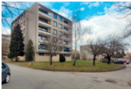
2. etapa revitalizace sídliště.

Tato etapa revitalizace bude město stát 14,8 milionů korun. Stavební práce budou