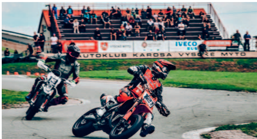
Vysokomýtský autodrom bude v letošním roce dějištěm významných závodů a další akcí.