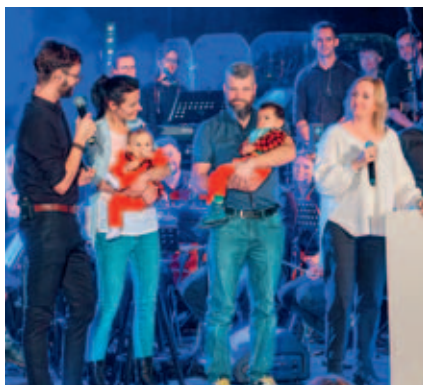
Základní umělecká škola se také podílí na benefiční akci Hudba pomáhá.