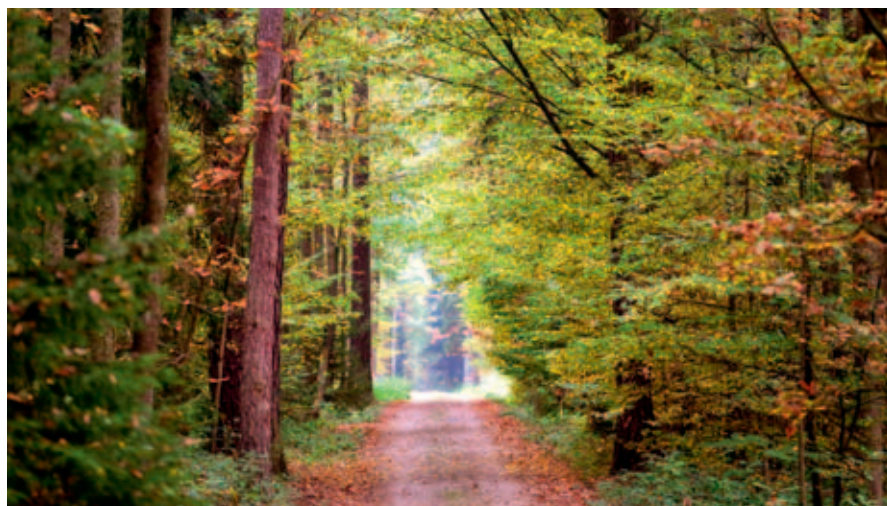
Příměstský les Vinice.