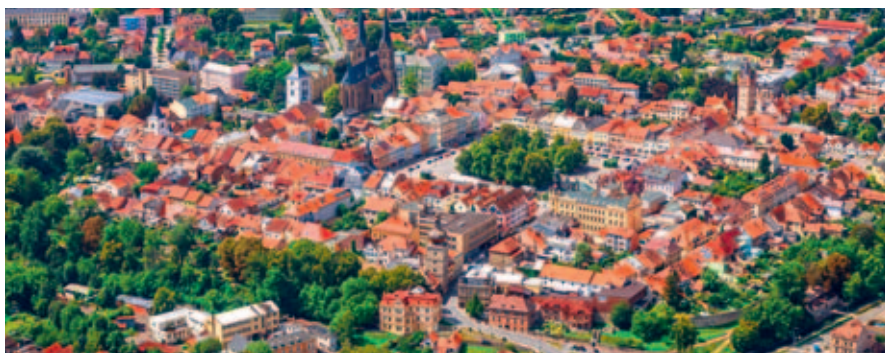
Památková zóna Vysoké Mýto.

Město Vysoké Mýto přijímá od 1. ledna do 30. listopadu žádosti do dotačního programu Fond památkové péče města Vysokého Mýta pro rok 2025