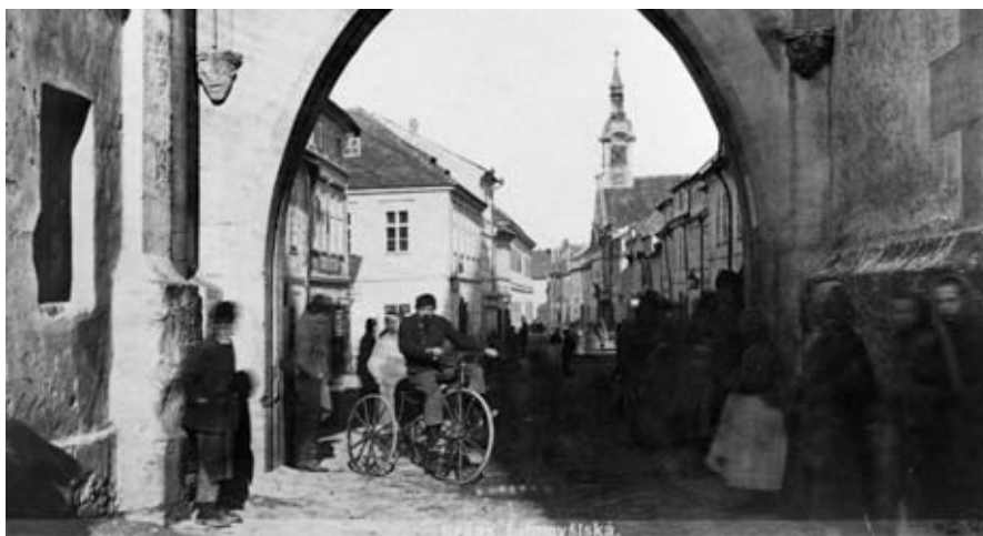
Průhled Litomyšlskou branou do Tůmovy ulice. Foto F. A. Brožek, 1876, sbírka RMVM

A nemusíte kvůli tomu chodit venku – ve výstavních prostorách v Šemberově domě pokračuje až do 30. března historicko-topografická výstava s titulem Vysokomýtský uličník.