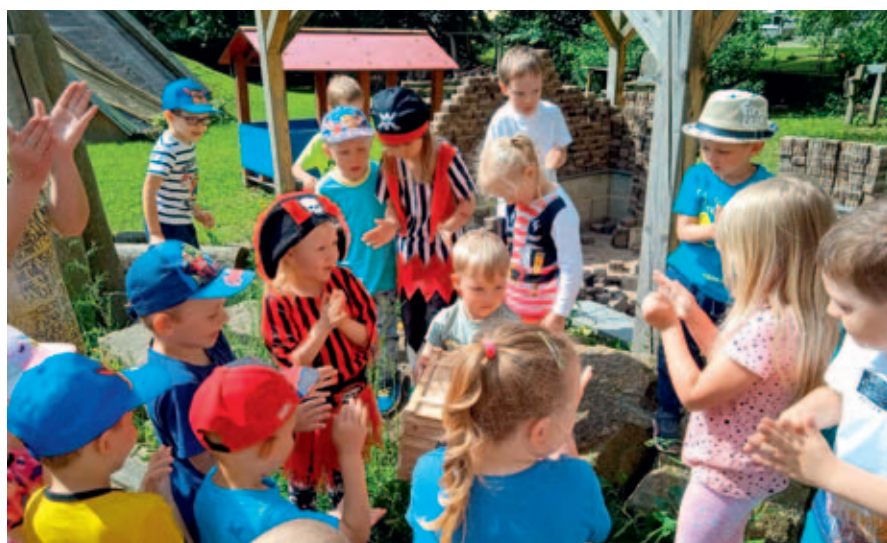
Během letních prázdnin mají rodiče možnost umístit své dítě i mimo kmenovou mateřskou školu.