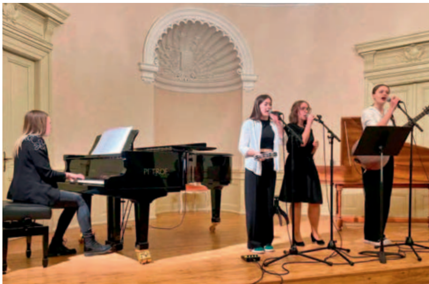
Základní umělecká škola zakončila pololetí koncertem svých žáků.

Ve středu 29. 1. proběhl ve velkém sále ZUŠ Vysoké Mýto Pololetní koncert, ve kterém se představili žáci různých hudebních oborů od dechových nástrojů, přes klavír a zpěv až po smyčcové nástroje.