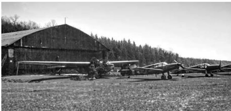
Vysokomýtské letiště na přelomu dubna a května 1945. Vlevo před hangárem je zamaskovaný kluzák DFS 230 (těmito kluzáky se zásobovala obklíčená Vratislav); dále zleva je spojovací a kurýrní letoun Messerschmitt Me 108 a dva výcvikové letouny Bücker Bü 181.

O transportech vězňů z koncentračních a zajateckých táborů jsme psali v lednovém zpravodaji. Přesto připomeňme, že i na jaře roku 1945 byli občané Vysokomýtska svědky hrůzostrašných a takřka likvidačních pochodů zubožených lidí. Mnohé obecní kroniky na tyto smutné události vzpomínají. Například v období mezi únorem a březnem 1945 dle odhadů prošlo Dolní Sloupnicí 20 000 a Českými Heřmanicemi až 60 000 vězňů. Tyto kolony, mezi nimiž se patrně nacházeli jak vězni z koncentračních, tak i zajateckých táborů, posléze pokračovaly přes Vysoké Mýto, případně Choceň dále na Dobříkov, Jaroslav a Holice.