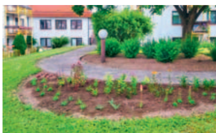
Záhon u domu s pečovatelskou službou.

Technické služby Vysoké Mýto uspořádají na vysokomýtském náměstí tradiční obli-