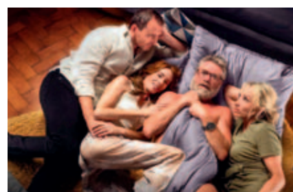
V dobrém i zlém