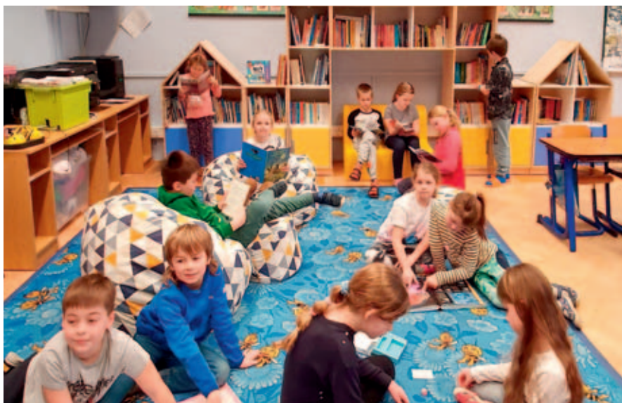
V Knířově mají novou školní knihovnu.

Jarní prázdniny utekly jako voda a hned na začátku druhého pololetí školního roku čekalo na všechny žáky knířovské školy velké překvapení – nová školní knihovna.