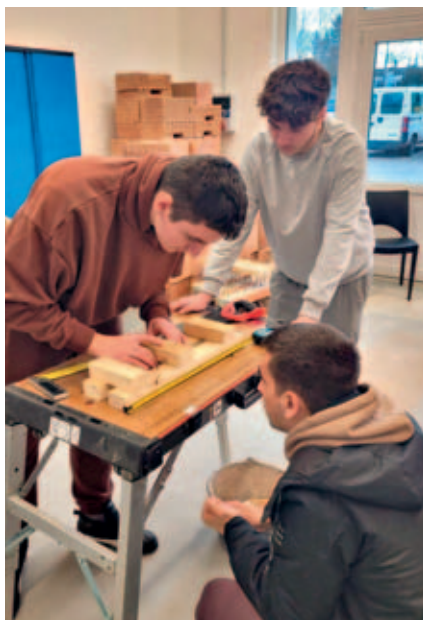
Vrcholem projektového dne byla soutěž ve výrobě dřevěného žebříku. Foto archiv školy

Den začal návštěvou místní pobočky instalátérství, kde si týmy zakoupily potřebný materiál pro následné praktické činnosti. Jako přínosné se ukázalo propojení studentů různých ročníků, když zkušenější žáci mohli předávat své znalosti mladším kolegům. V dílenských prostorách školy pak smíšené skupiny postupně procházely různými stanovišti, kde si vyzkoušely polyfúzní svařování, pájení a práci s různými druhy trubních materiálů. Součástí programu byla také praktická výuka demontáže a montáže vodovodních baterií. Projektový den byl zakončen opakovacím testem, který prověřil získané znalosti. Celé dopoledne se neslo v příjemné atmosféře vzájemné spolupráce a studenti měli možnost nejen zdokonalit své praktické dovednosti, ale také navázat nové vztahy napříč ročníky. Tento projektový den byl skvělou příležitostí pro studenty, aby si uvědomili význam týmové práce a vzájemné podpory, což jsou klíčové dovednosti nejen pro jejich budoucí profesní život, ale i pro osobní rozvoj.