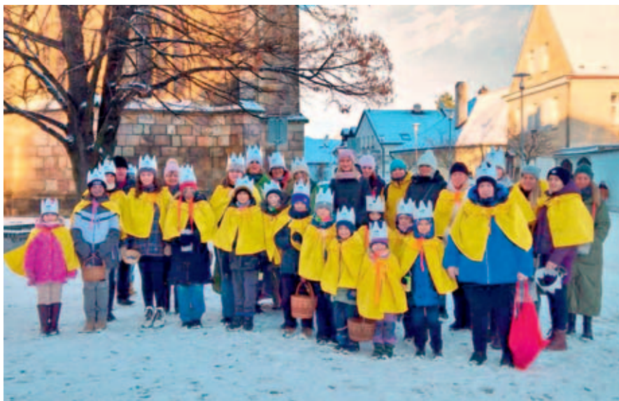
Koledníci Tříkrálové sbírky před kostelem sv. Vavřince.

V letošním roce jsme s radostí oslavili jubilejní 25. ročník Tříkrálové sbírky. Rádi bychom upřímně poděkovali všem, kteří se do ní zapojili a podpořili ji ve vašem městě.