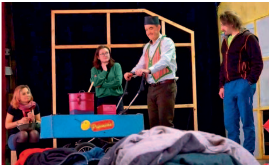
Momentka ze zkoušky nového představení Divadelního spolku Šembera.

Divadelní spolek Šembera ve spolupráci s Vysokomýtskou kulturní o. p. s. v rámci programu oslav Divadlo 1825–1925–2025 připravil bláznivou komedii Carla Goldoniho, v úpravě Vlastimila Pešky, Poprask na laguně.