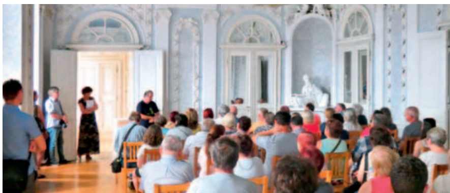
Interiér zámku Chroustovice nabízí zajímavou podívanou.

8. 6. v 13.00 a 15.00, 13. 7. v 13.00, 17. 8. v 13.00 a 7. 9. v 13.00 a 15.00, zámek Chroustovice KOMENTOVANÉ PROHLÍDKY ZÁMKU A ZAHRAD V CHROUSTOVICÍCH