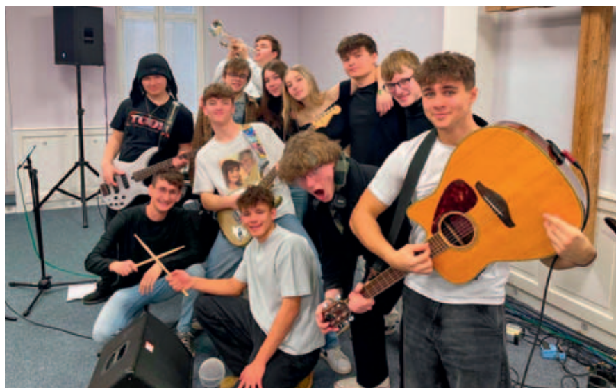
Kapela z podnikatelské školy.