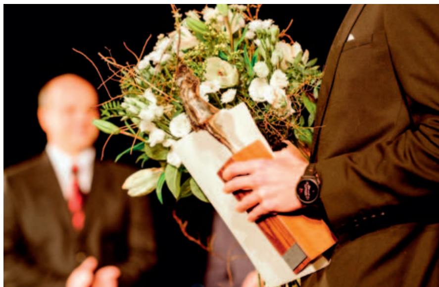
Ceny města budou předány v Šemberově divadle 6. března.

Vstupenky budou k dispozici zdarma od 3. března v Turistickém informačním centru.