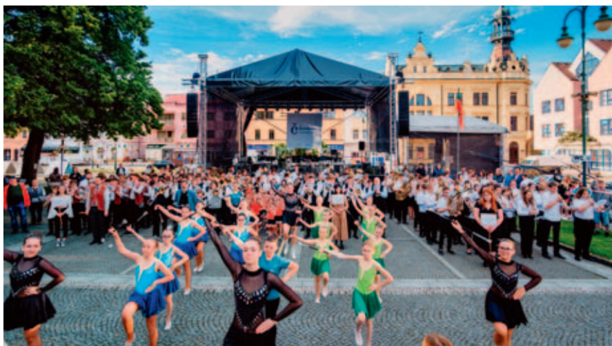
Vysokomýtské náměstí ožije hudbou.

Sobota 24. 5. od 9.00, náměstí Přemysla Otakara II. ČERMÁKOVO VYSOKÉ MÝTO Program: