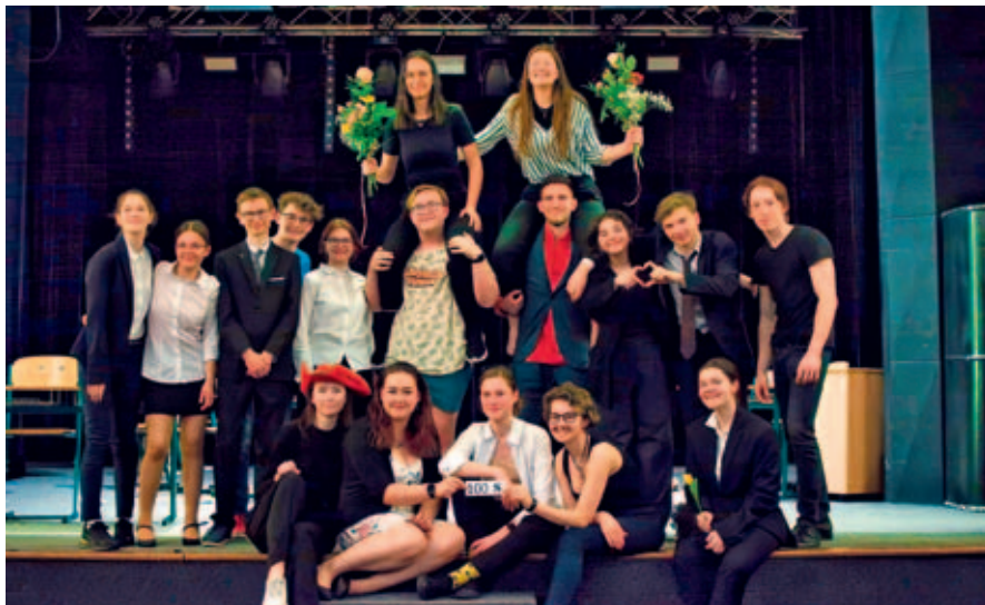
Dramatický klub na gymnáziu.

Jsme parta studentů vysokomýtského gymnázia, kteří mají rádi divadlo a chtěli si ho zkusit i zahrát.