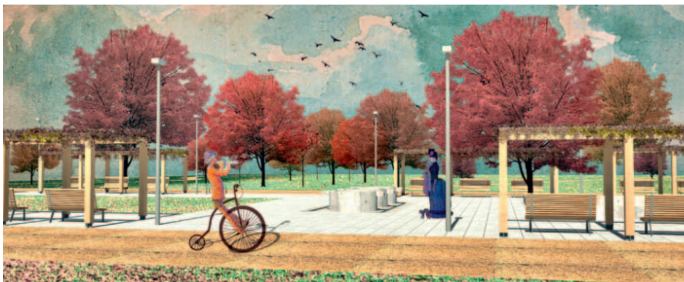
Vizualizace parku za pivovarem. Autor architekt Vladimír Balda

Město zahájilo stavbu parku v lokalitě za bývalým pivovarem. Nový park bude vybudován podle návrhu architekta Vladimíra Baldy a vzešel z architektonicko-krajinářské soutěže.