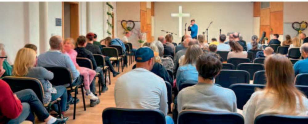
Nový sál modlitebny postavili baptisté ve dvoře domu čp. 72 v Pražské ulici.

jsem viděl, že je to realita. Chtěl jsem mít to, co on. Uvěřil jsem, že mi Bůh odpouští hříchy, že za ně už Ježíš zaplatil na kříži, a rozhodl jsem se světit mu svůj život. Někdy jsem ještě nejedl maso, ale pak mi došlo, že buď budu věřit celé Bibli, kde o vegetariánech nic není, nebo to nemá smysl. Tehdy začal můj živý vztah s Bohem.