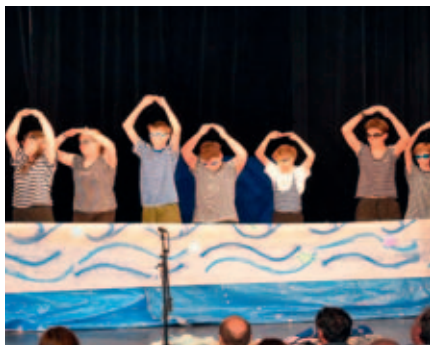
Vystoupení akvabel na suchu.

ZŠ Jiráskova se připojila k oslavám 200. výročí založení ochotnického divadla ve Vysočském Mýtě velkolepým Kaleidoskopem. Konal se 3. dubna a pro velký úspěch se 13. května uskuteční repríza. Pestrého programu se účastnili žáci z 1. stupně, ale pozadu nezůstali ani žáci starší. V široké paletě