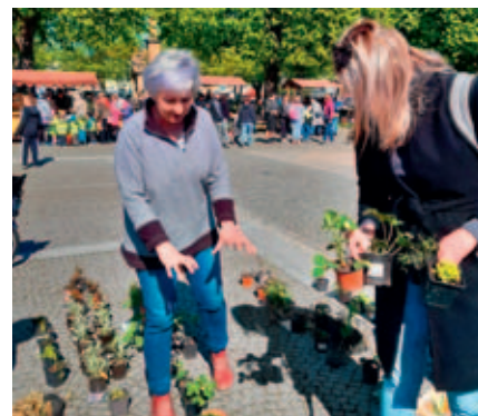
Rostlinný bazar.

Pátek 16. 5. od 8.00 do 13.00, náměstí Přemysla Otakara II. DEN ZEMĚ