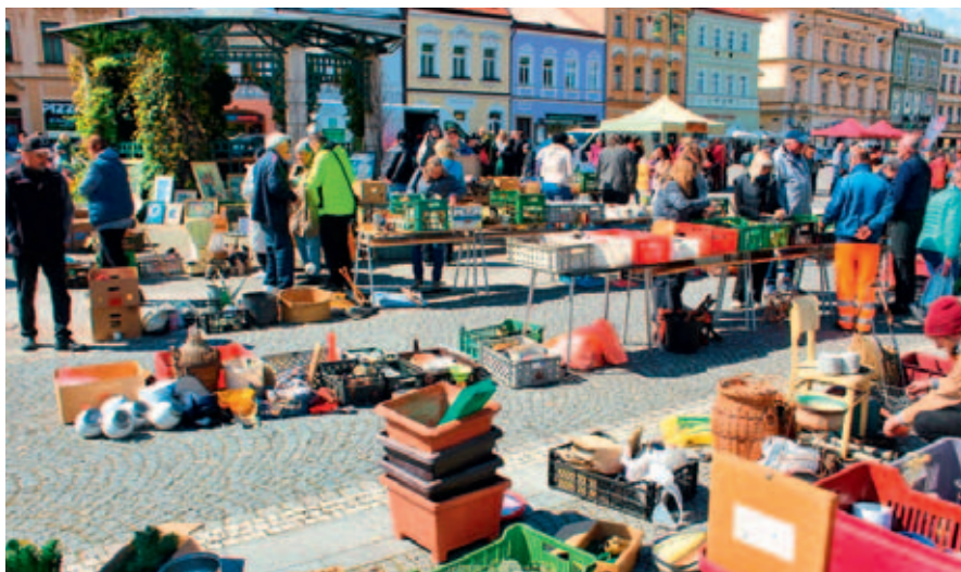
Součástí Dne Země je oblíbený Kujebazar.

Náměstí Přemysla Otakara II. pohostí Den Země, další ročník tradiční ekovýchovné a osvětové akce.