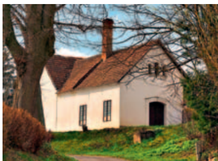
Řepníky čp. 37 – kovárna.