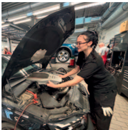
Studenti z technické školy si vyzkoušeli, jaké to je pracovat v zahraničí.