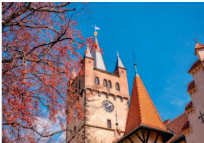
Pražskou věž je možné od 24. května navštívit o víkendech.

Pražská brána, jedna z dominant našeho města, přivítá v průběhu května první letošní návštěvníky. Otevřena bude už v sobotu 24. května.