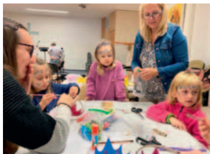
Hra pro děti při loňské Noci kostelů.

David: Ve srovnání s jinými baptistickými sbory je ten vysokomýtský mnohem aktiv-