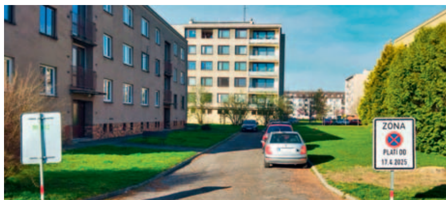
Z důvodu úpravy veřejného prostranství dojde na sídlišti k uzavírce provozu.

Jaromír Holub, odbor dopravních a správních agend