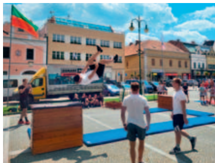
Na Sportovním dni představí místní kluby a oddíly své umění.

Středa 4. 6. od 8.30 do 13.00, náměstí Přemysla Otakara II. SPORTOVNÍ DEN Program: