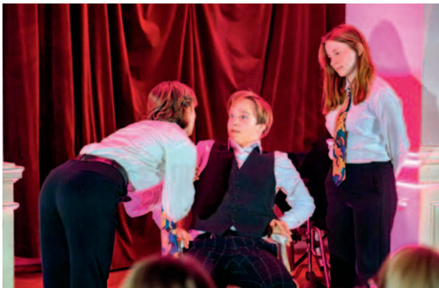
Zpracování hry Dům na silnici v podání žáků ZUŠ.

Prvním významným milníkem ochotnického divadla na Vysokomýtsku se stal rok 1825, kdy se podařilo odehrát první představení v českém jazyce. Právě tento rok proto vnímáme jako počátek ochotnického divadla ve Vysokém Mýtě.