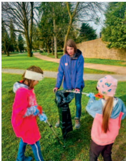
Žáci ZŠ Javornického uklízeli okolí školy.

V sobotu 12. dubna se naše škola připojila k celorepublikové akci Uklidme Česko. Tento den se nesl ve znamení společného úsilí o čistší a příjemnější okolí, ve kterém žijeme a vyrůstáme.