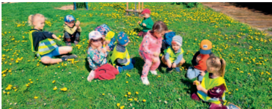
Děti z MŠ Kamarádi.

Zápisys do mateřských škol ve Vysokém Mýtě pro školní rok 2025/2026 budou probíhat v týdnu od 5. do 7. května.