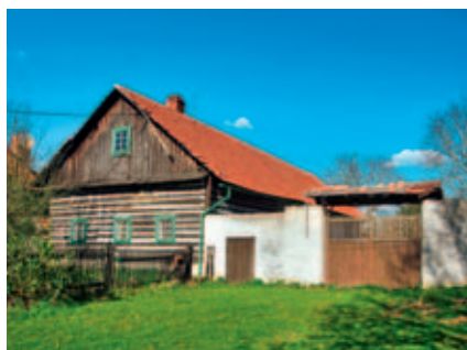
Vinárny čp. 27.

Květen – říjen, bývalá trafostanice ve Svařeni ČÍST DOMY Výstava fotografií.