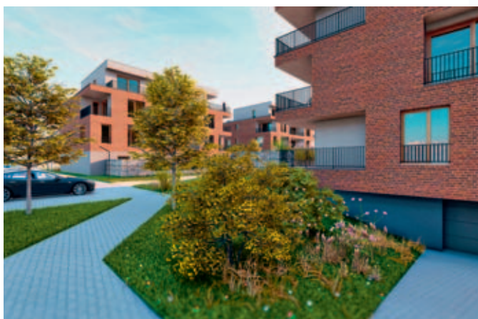
Bytové domy v lokalitě za pivovarem. Vizualizace architektonické studie ateliér nolimits

Město Vysoké Mýto připravuje vybudování infrastruktury v lokalitě za pivovarem, kde se na tříhektarové ploše plánuje výstavba jedenácti bytových domů.