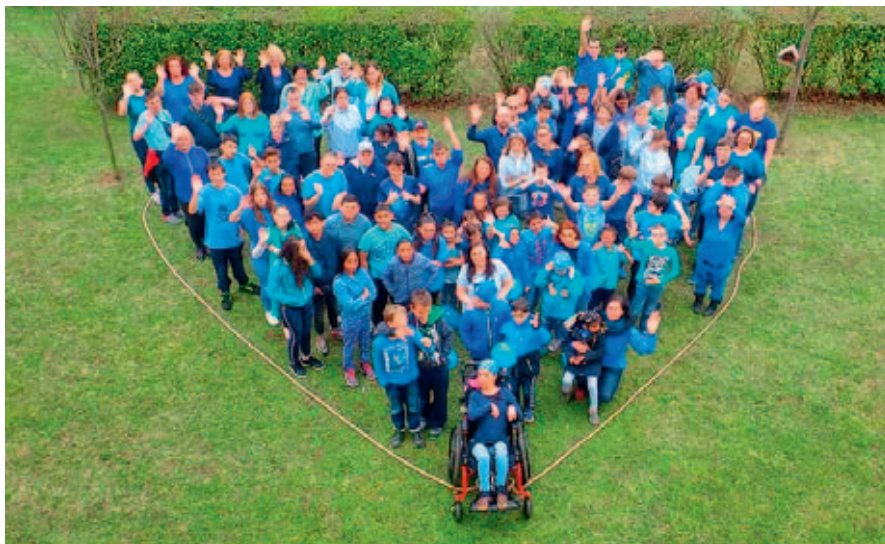
Speciální škola vyjádřila podporu lidem s autismem během v modré barvě.

2. dubna si připomínáme Světový den porozumění autismu. Den, kdy se celý svět halí do modré na podporu lidí s poruchou autistického spektra.