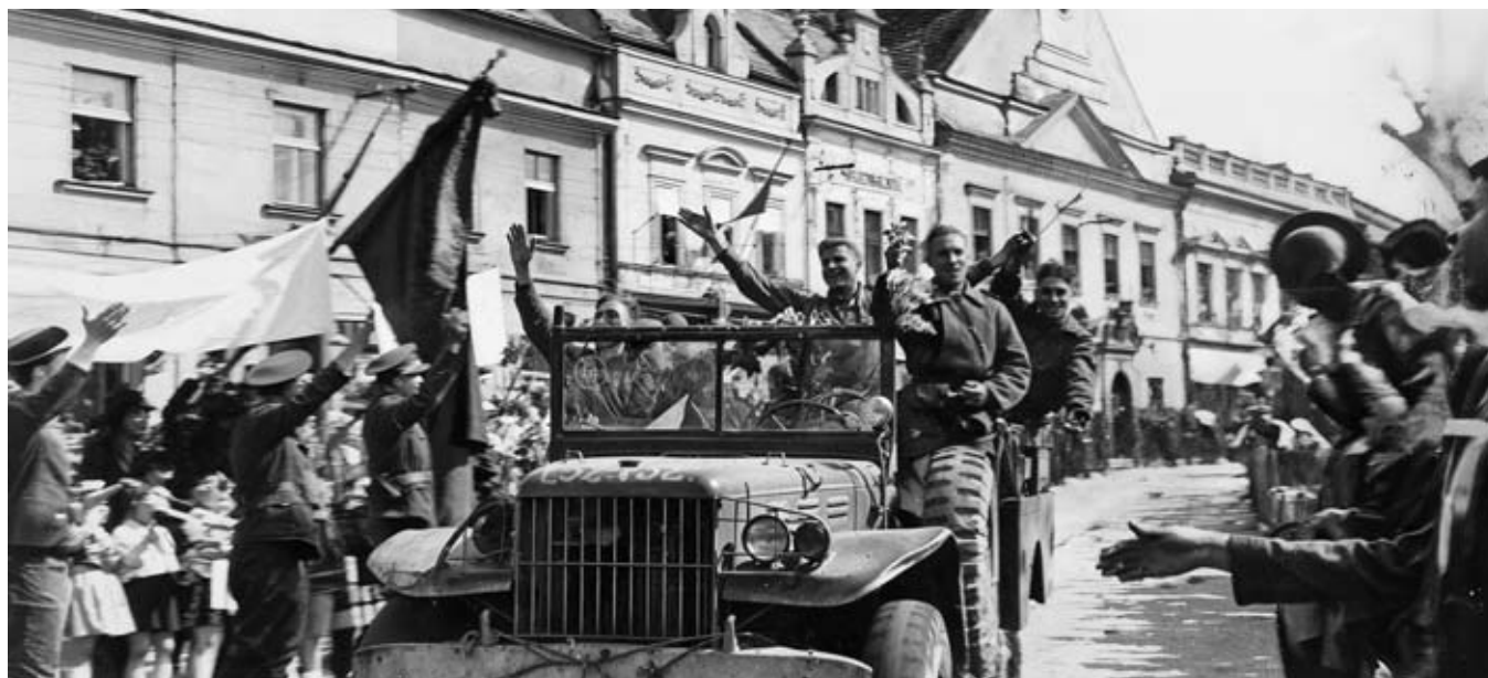
Příjezd Rudé armády do Vysokého Mýta dne 9. května 1945.