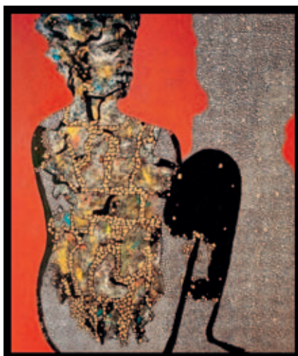
Díla Heshama Malika jsou inspirována lidskými příběhy, ve své tvorbě používá různé techniky.

Obrazy nabízejí kritický pohled na témata, jako je válka, moc a chamtivost. Výstava se