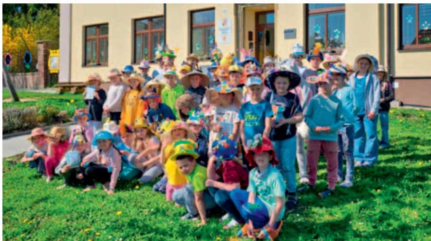
Kloboukový den.

Všechny dubnové dny v naší škole byly plné pestrých a nových akcí. Je úžasné, kolik jsme toho prožili a hlavně si společně užili.