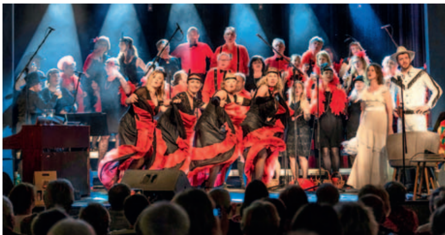
Z premiéry koncertu k oslavám divadla.

Vstupenky lze zakoupit v infocentru a na webových stránkách M-klubu.