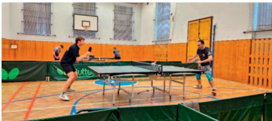
Stolní tenisté skončili sezonu 2024/2025.

První dubnový víkend odehrálo žákovské družstvo poslední zápas své soutěže, což byl zároveň poslední zápas vysokomýtských stolních tenistek a tenistů z jednoty Orel Vysoké Mýto v této sezoně.