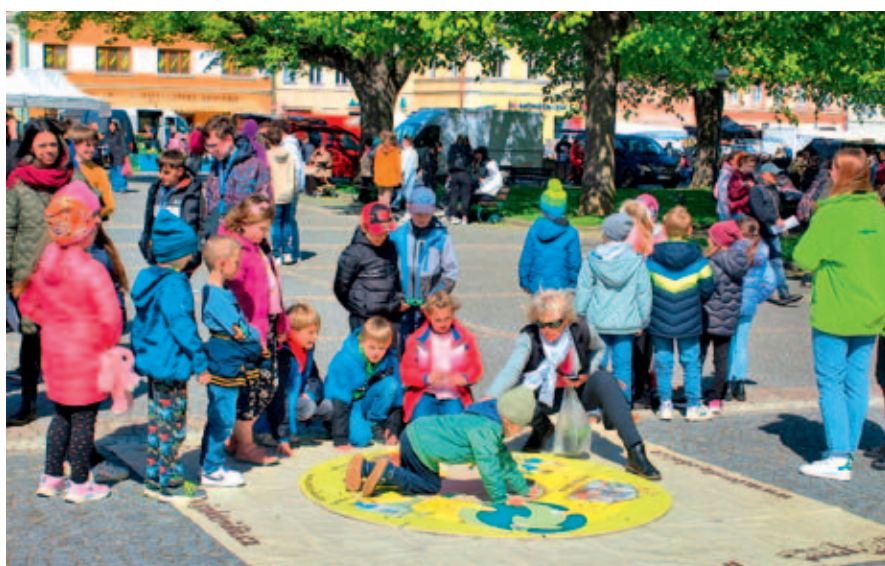
Pro děti je připraveno množství kvízů a soutěží.