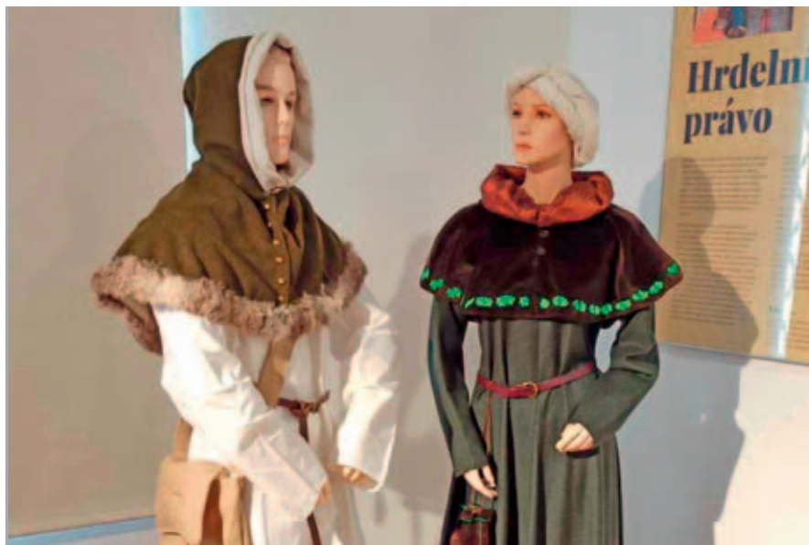
Výstava nabízí mnohé, včetně středověkých oděvů.

V neděli 27. dubna byla za účasti krále Přemysla Otakara II. zahájena hlavní výstava tohoto roku.